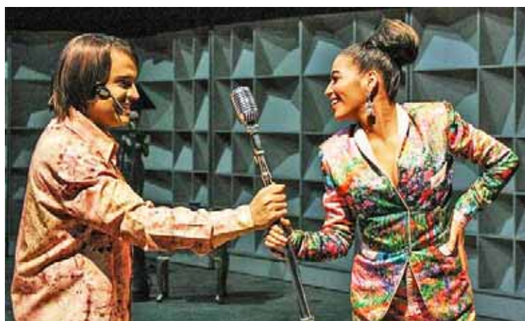
Tendrá doble función hoy en la Sala José Félix Ribas

T/ Redacción CO