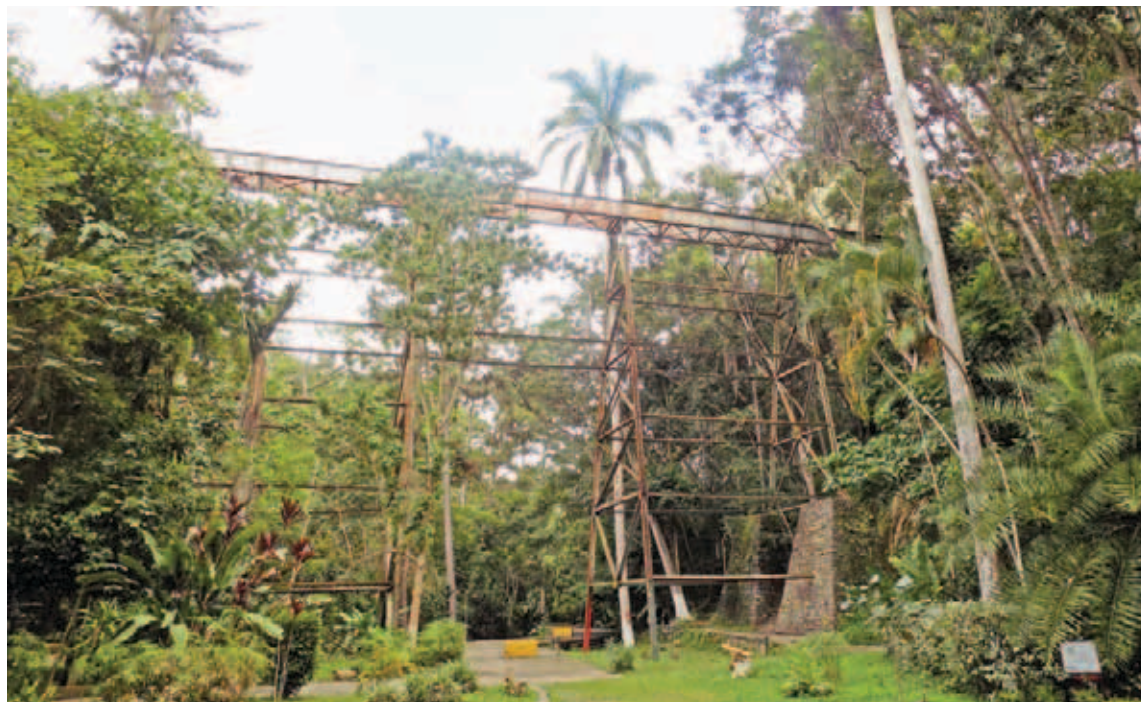
Parque los Coquitos o parque Knoop

“Mi papel aquí”, dice, “es tratar de hacer todo lo posible para que la gente recuerde con respeto, con criterio, pero además que prevalezca el patrimonio, de lo que quede como patrimonio. Eso obliga a una investigación permanente sobre todos los procesos históricos, no solamente sobre los relatos anecdóticos, sobre los cuentos de principios de siglo, el cuento del tren, y sobre todo el tema de salud, de higiene, el tema del ambiente, el tema ecológico, hay cosas que tienen que recordarse, y además recomponer una amplitud histórica que se ha ido deslastrando precisamente por