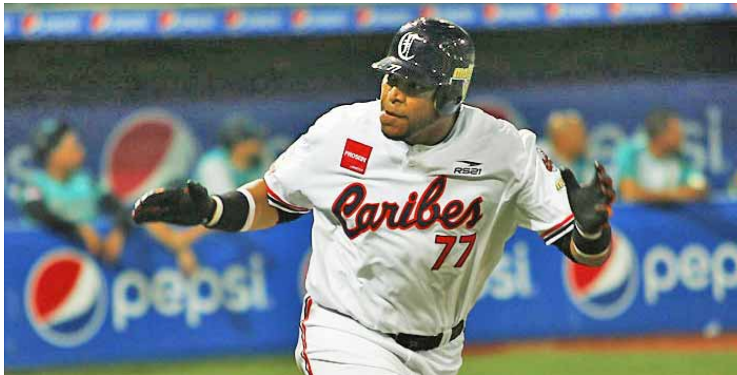
Reyes ha jugado con varios equipos en nuestra liga

“Es verdaderamente impresionante encontrarme cerca de esos peloteros, que con mucho esfuerzo están en un pedestal en el beisbol venezolano. Aquí los muchachos me están apoyando para que logre la marca. Me llevan la cuenta de los hits. Pero ahora sí sé cuántos llevo. No como en aquella ocasión cuando conecté el 900 y no sabía. Aún me duele no haber pedido esa pelota (risas)”, comentó el exgrandeliga, quien agregó que le dará mucho más regocijo si sus imparables ayudan a la causa de Caribes, como lo hizo el miércoles por la noche, cuando con par de dobles y cuatro remolques ayudó a que la Tribu