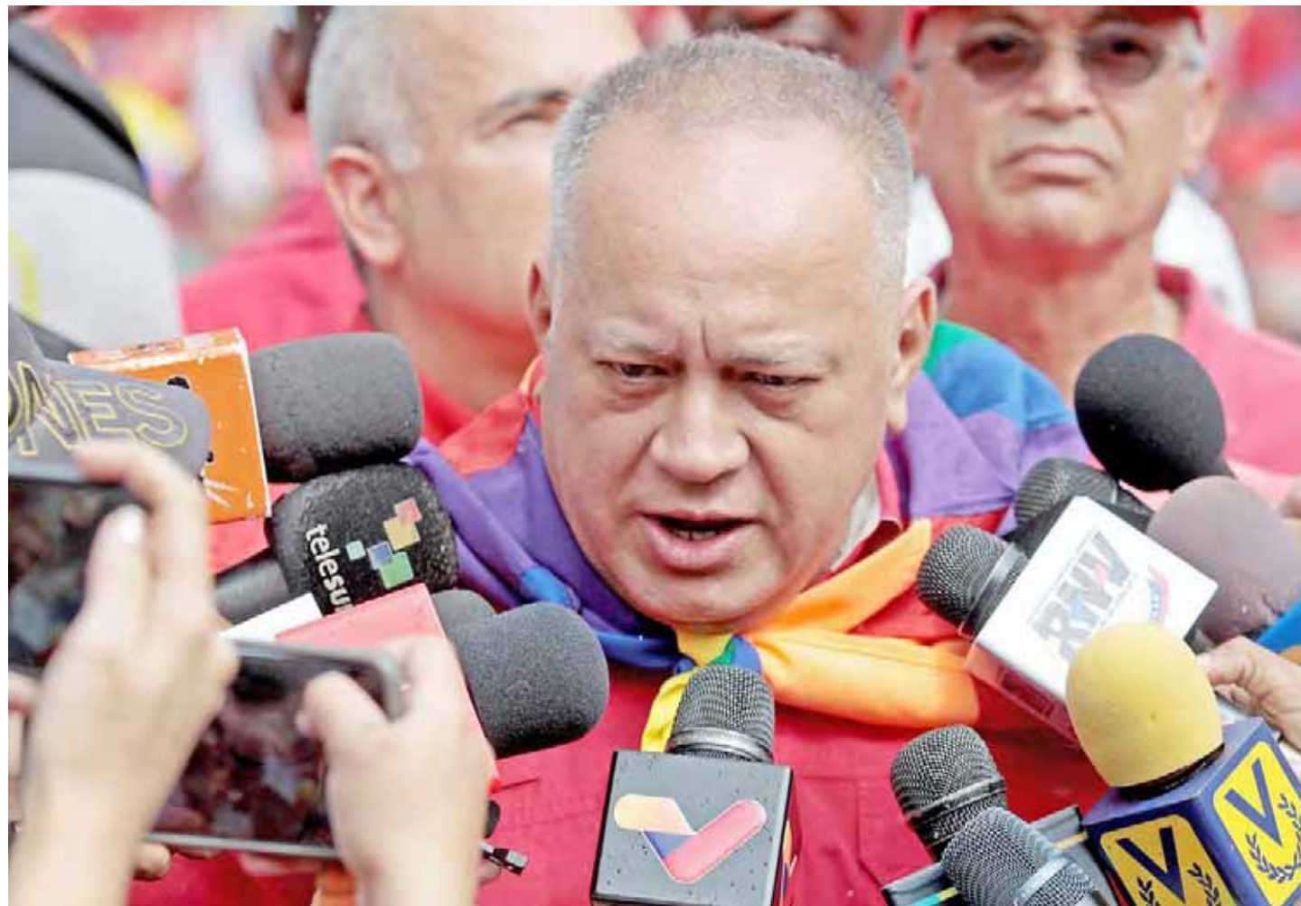
El pueblo revolucionario está calentando motores para el día sábado, expresó Cabello

Al referirse al ámbito nacional, el dirigente sostuvo: “Si alguien es experto en mentirle a su propia gente es ‘Juanito Alimaña’. Es experto en crear falsas expectativas, de esperanzas que no existen. Aquí en Venezuela va a haber Navidad, quiera o no quiera ‘Juanito Alimaña’”