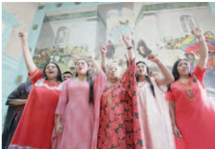
Hay un pueblo consciente en las calles de Bolivia, afirmó Núñez

La aseveración la hizo en el Palacio Federal Legislativo con motivo del pronunciamiento de la Comisión de Pueblos y Comunidades Indígenas de la Asamblea Nacional Constituyente (ANC) sobre el golpe de Estado