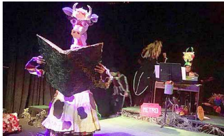
Dora, la vaca encantadora es una de las piezas para los más pequeños de la casa