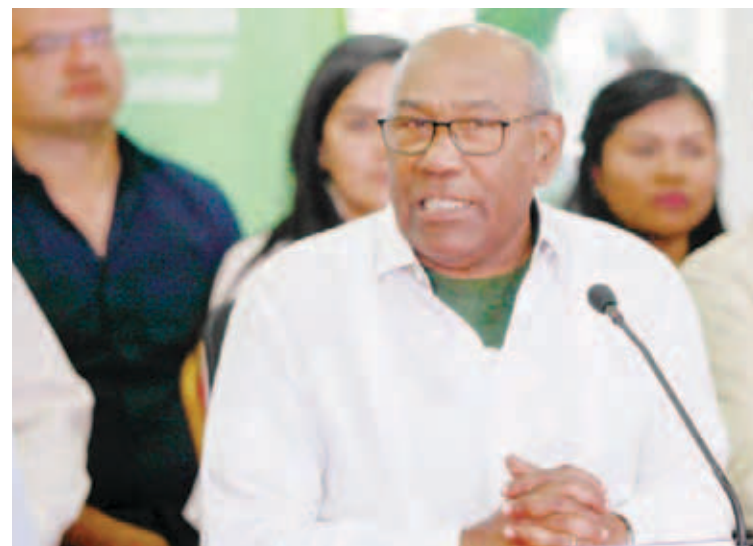
“Somos un pueblo que tiene conciencia política”, afirmó Istúriz

Aseveró que la movilización realizada el pasado sábado por las fuerzas revolucionarias demuestra a los pueblos del mundo, “que somos un pueblo que tiene conciencia política, y tener conciencia es saber quién es el enemigo. Nosotros estamos en la calle porque somos gente de palabra, estamos en la calle para defender la patria”.