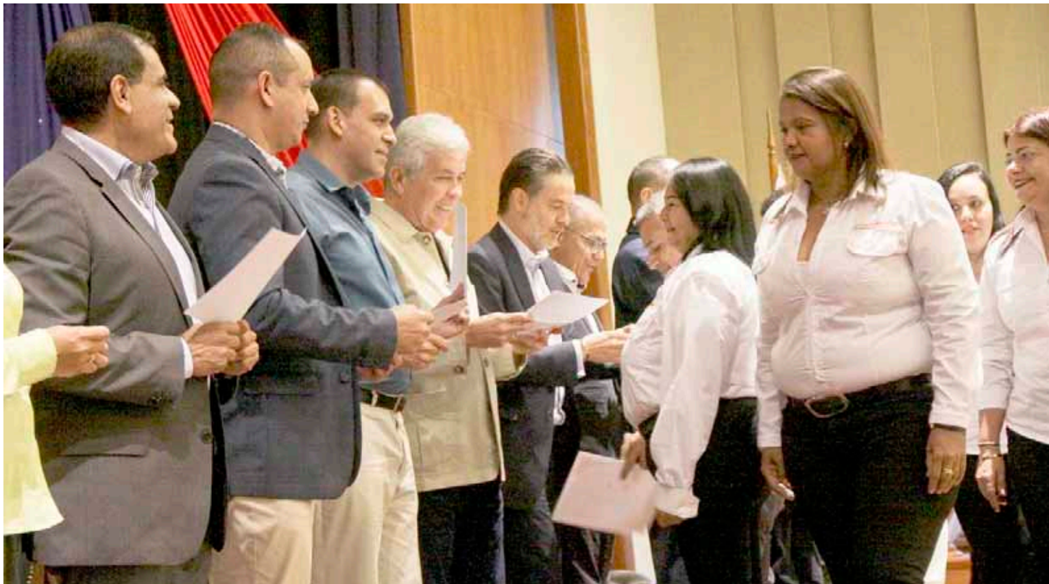
Con resultados exitosos Conviaza está celebrando 15 primaveras