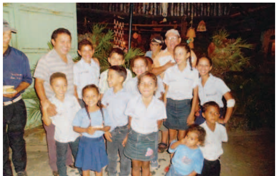
Niños de la parranda de Agua Clara