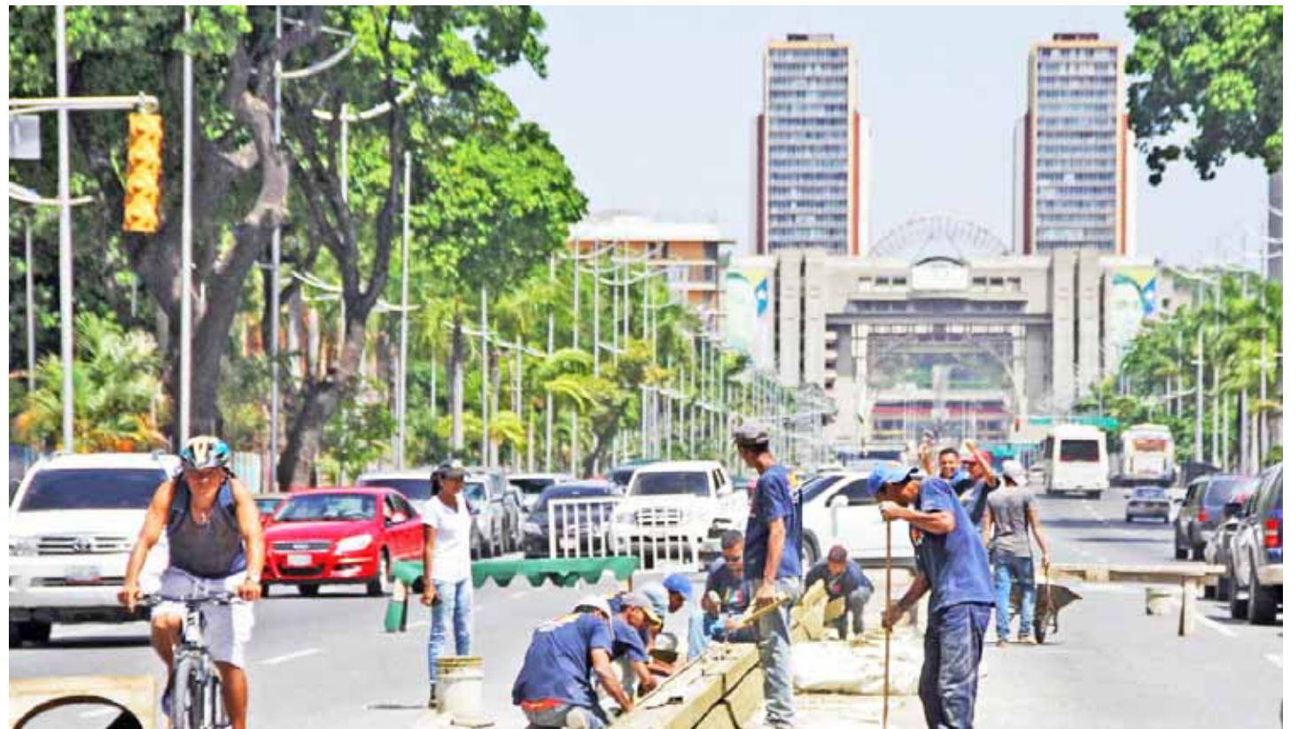
Quinientos consejos comunales han recibido recursos de manera directa para ejecutar obras en sus comunidades, aseguró Faria

pueblo organizado señaló “la recuperación de espacios públicos y fachadas, obras de acceso para el barrio y mejoras para que el transporte público pueda prestar un mejor servicio”.