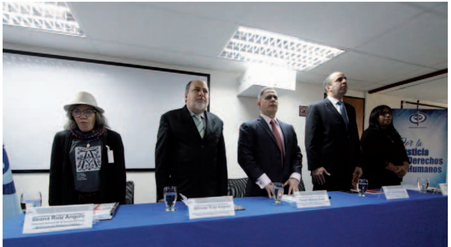
El fiscal general de la República destacó el trabajo de la Escuela Nacional de Fiscales

Siempre he dicho -comentó- que los orígenes de la lucha de los derechos humanos debieran verlos en profetas como Jesús,