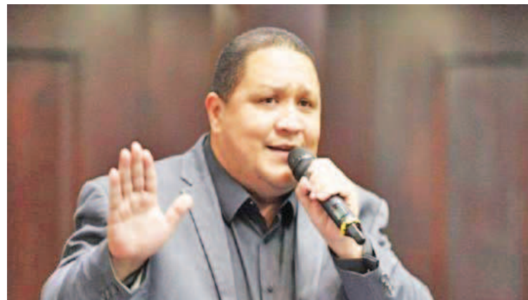
Brito calificó de “estafadores” a varios parlamentarios de la oposición

La declaración la ofreció ayer momentos antes del inicio de la sesión de la AN, en la que calificó de “estafadores” a varios parlamentarios de la oposición y sostuvo que en el interior de la AN ha surgido “una nueva