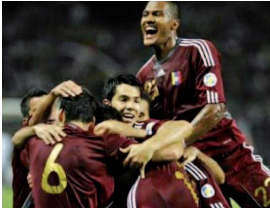
Venezuela volverá intentar llegar a un mundial de fútbol

Gracias a esto, la Vinotinto suma un paso más en la planificación de sus objetivos para buscar su primera clasificación en un certamen de esta naturaleza, conociendo el orden de los rivales y las fechas en las que estará jugando cada jornada, iniciando ante Colombia en condición de visitante y luego ante Paraguay, en casa, durante marzo de 2020.