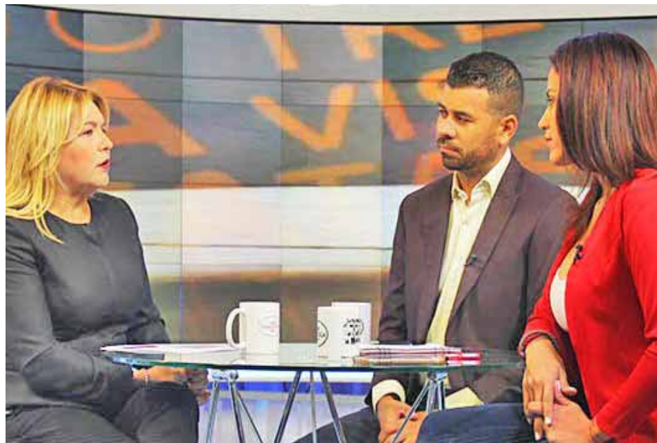
Banco del Tesoro hará los ajustes para el uso del petro, anunció Laya Lugo

Manifestó que el Gobierno Nacional ha dirigido todo su esfuerzo para reforzar la producción nacional. “Hemos apostado todo para fortalecer la producción nacional, y puedo decir que estamos cerrando el mes de noviembre con más de