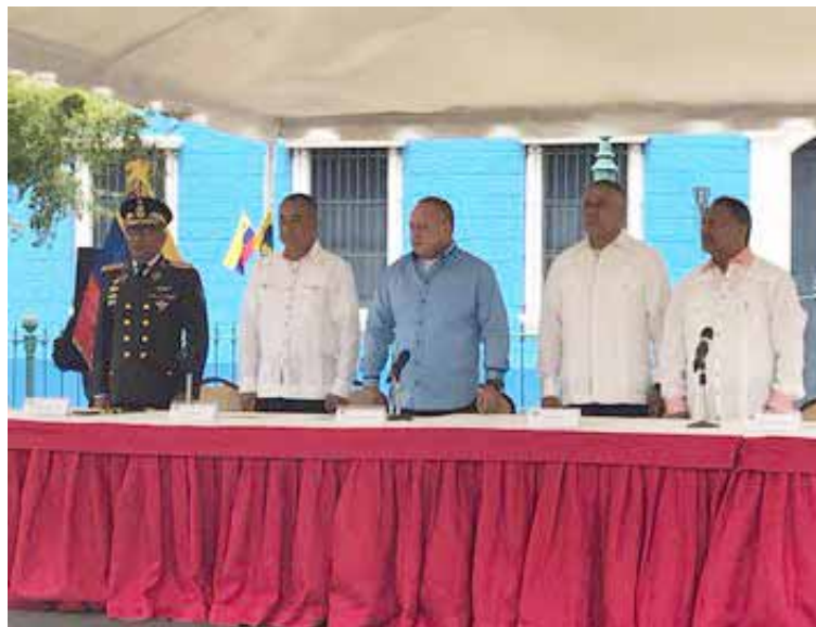
“Fue Hugo Chávez quien impulsó la unidad latinoamericana”, aseguró Cabello

Desde la Presidencia colombiana, “nos atacan, sienten que nosotros somos los enemigos, y se les olvida que fue un venezolano, un caraqueño, quien creó a Colombia, quien les dio la Libertad, que soñó con una patria unida; pero les faltó grandeza a algunos para verlo”, aseveró Cabello