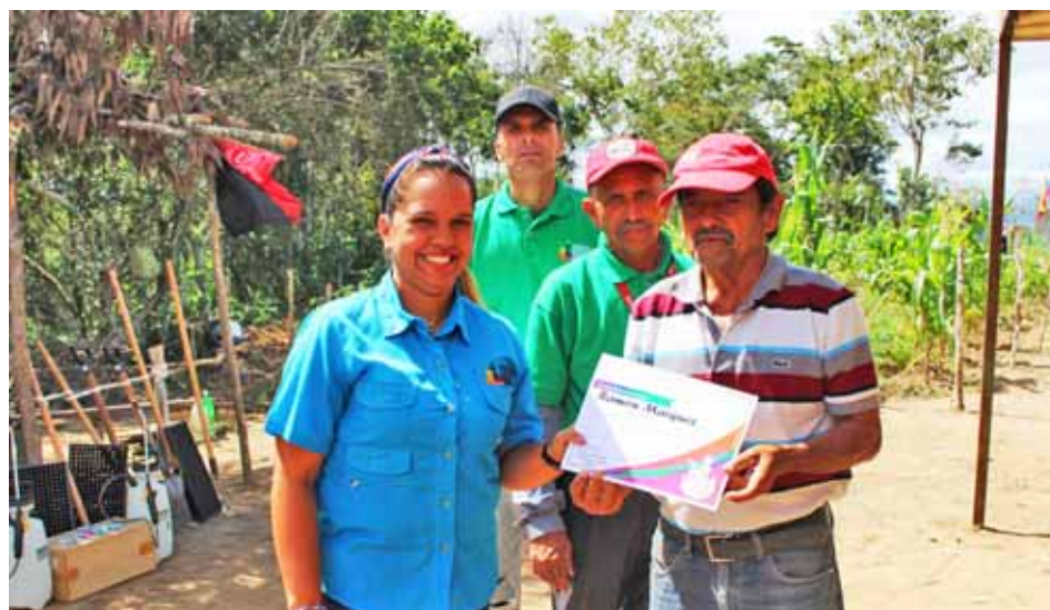
Peña destacó la importancia de convertir a Venezuela en un país potencia

Peña aprovechó la ocasión para verificar algunas potencialidades productivas del referido espacio, en compañía de algunos maestros y del técnico de campo de la Fundación de Capacitación e Innovación para Apoyar la Revolución Agraria (Ciara), institución