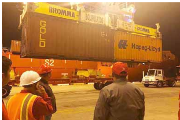
El 75 por ciento de los juguetes ha sido distribuido, expresó Laya

Detalló que estos 5 millones de juguetes completarán los