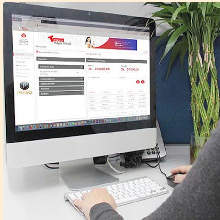
Banco del Tesoro labora por una mayor eficacia