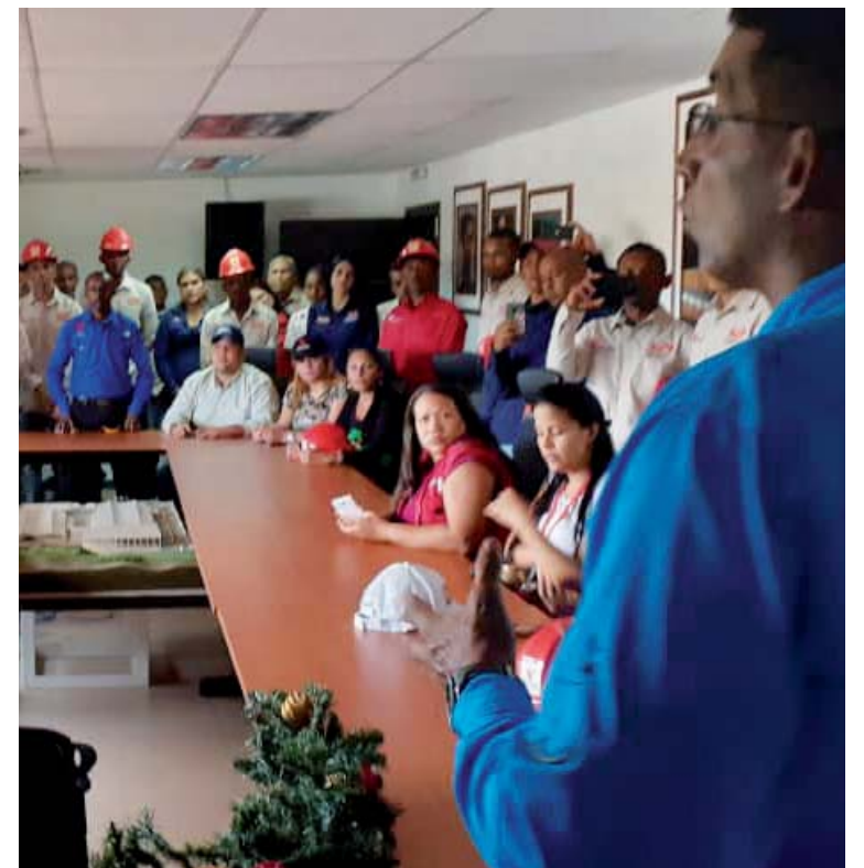
“Seguimos potenciando el aparato productivo e industrial del país”, destacó Villarroel

En otro mensaje, aseguró: “En aras de continuar garantizando la potencialidad de la #GMVV, realizamos recorrido por las instalaciones de la Empresa Tubhelca, en el revolucionario Edo #Lara, para generar estrategias que beneficien al pueblo, seguimos potenciando el aparato productivo e industrial del país”.