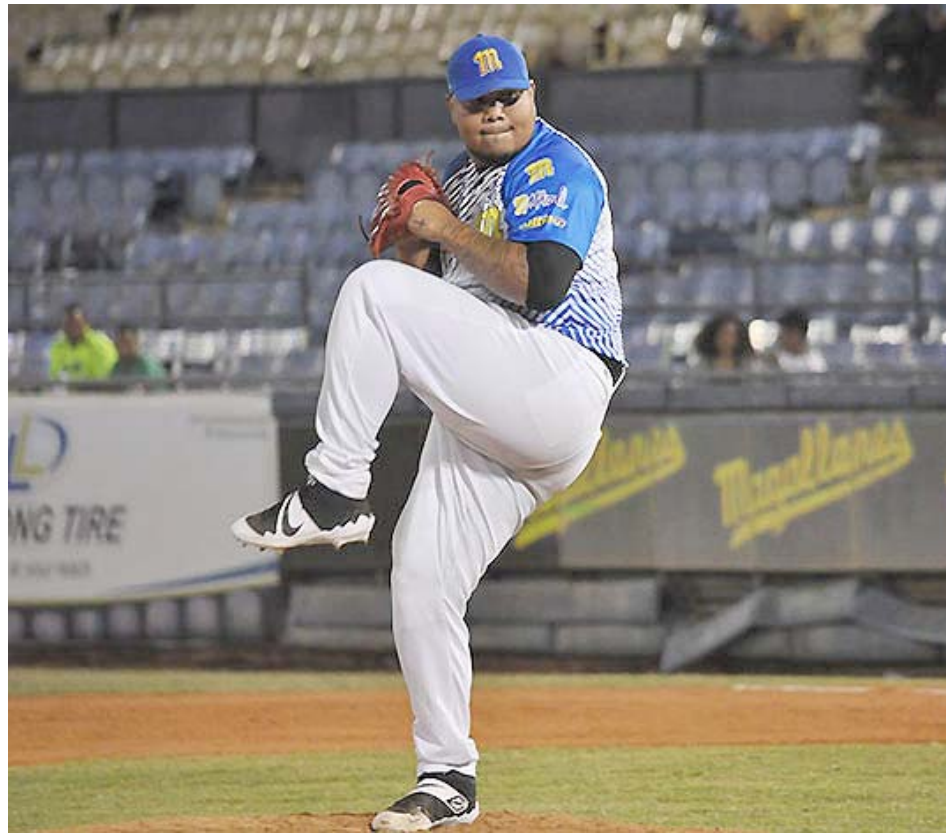
El derecho quiere volver al sistema MLB

Luego de ese gran año, de pronto, todo cambió. Cuando se perfilaba a su segunda zafra en el mejor beisbol del mundo, tuvo que someterse a la operación Tommy John, lo que hizo que se perdiera todo el 2014 y, a su vez, perdiera también velocidad en su poderosa recta, que llegó a marcar las 100 millas por hora.