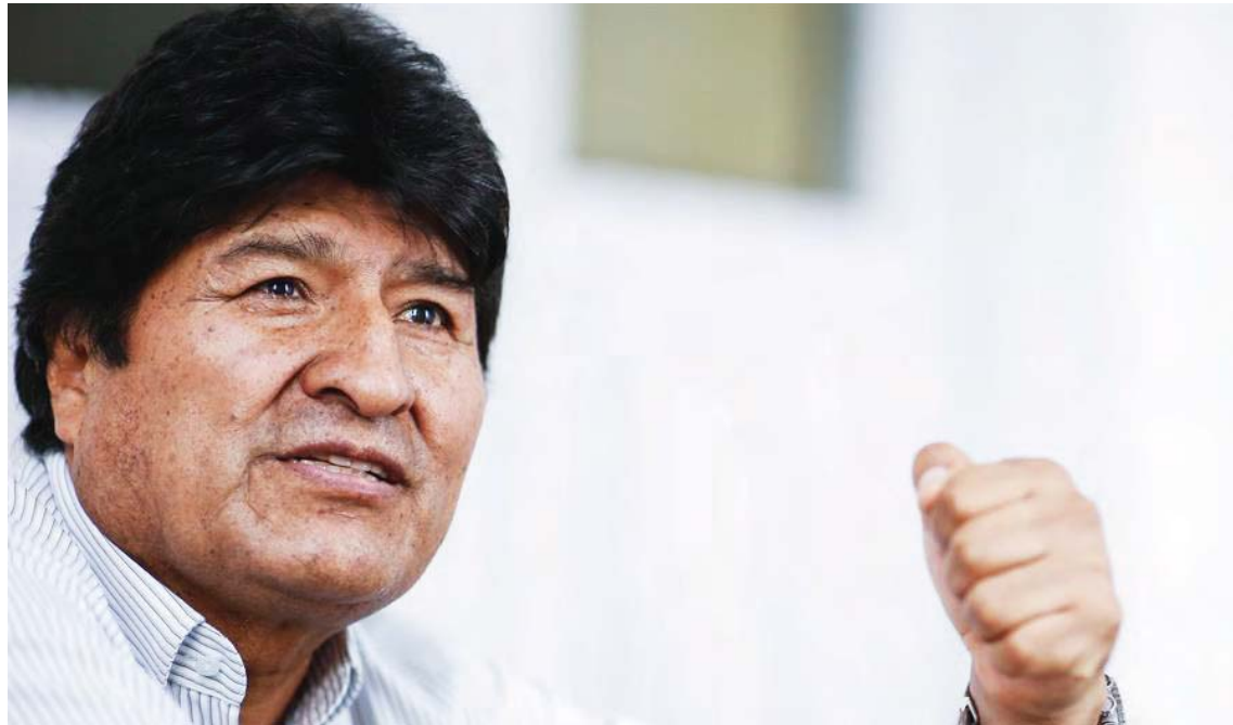
Dirigentes nacionales de organizaciones sociales participarán en la escogencia de los candidatos

T/ Elizabeth Pérez Madriz -AVN F/ EFE Caracas