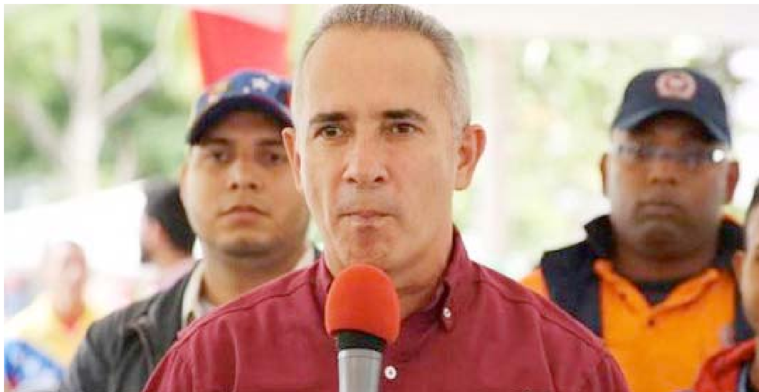
“Seguimos en combate permanente contra las estructuras criminales”, aseveró Bernal

La información la suministró Bernal por medio de su cuenta Twitter: @FreddyBernal, en la que señaló que los hechos ocurrieron en el sector Peronilo de Colón, municipio Ayacucho del estado Táchira, “donde se incautó material destinado al contrabando y extorsión. ¡Sin descanso seguimos combatiendo a los criminales que operan en la frontera!”, expresó Bernal en su cuenta social.