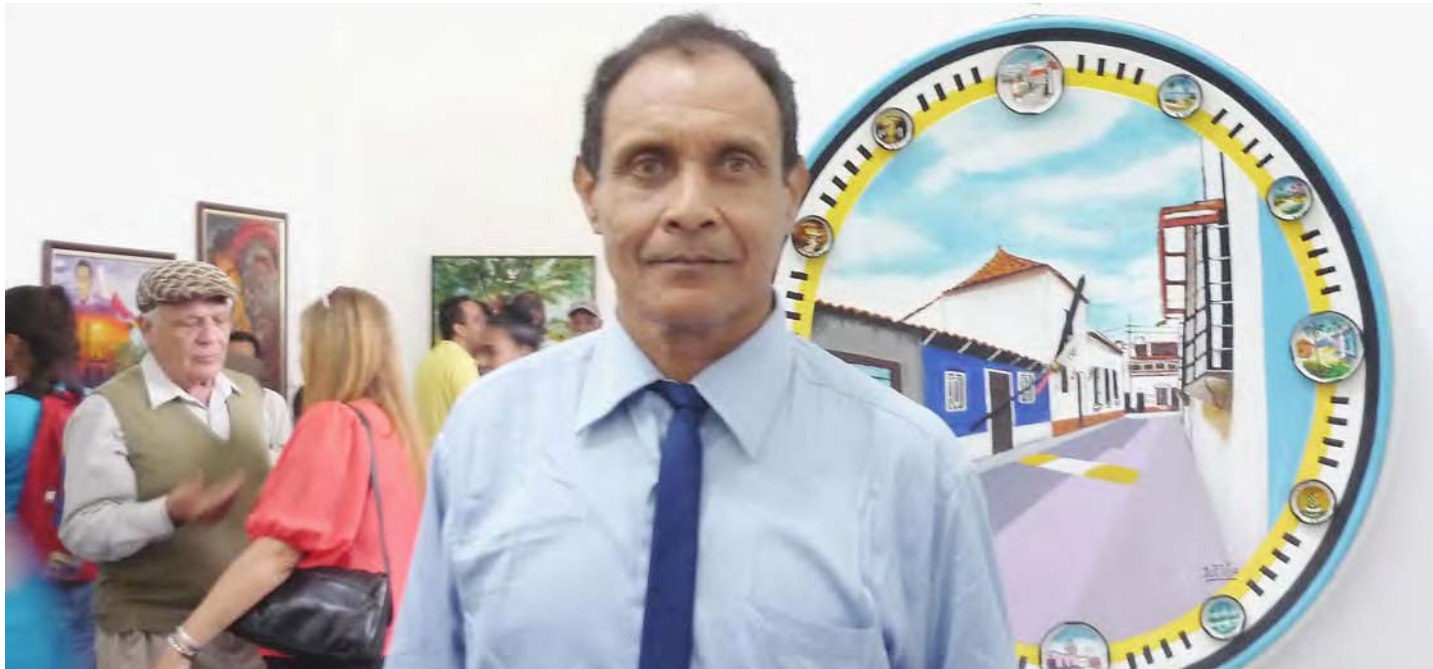
Petit tiene varias exposiciones en su haber

Con medio siglo de trabajo continuo, “ahora me dedico a formar nuevas generaciones”