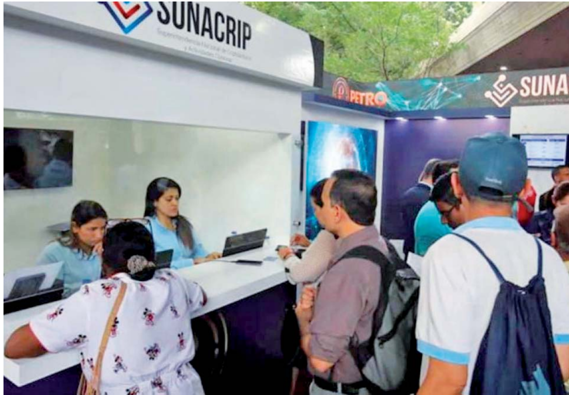
Los lineamientos técnicos se aplicarán a partir del 1 de enero de 2020

La información fue dada a conocer en nota de prensa de la Vicepresidencia Sectorial de Economía, en la que explica que dicha providencia número 097-2019, fue publicada en Gaceta Oficial número 449.066, de fecha 23 de diciembre, la cual establece los parámetros para la presentación de la reexpresión de los registros contables de operaciones y hechos económicos con criptoactivos, reali-