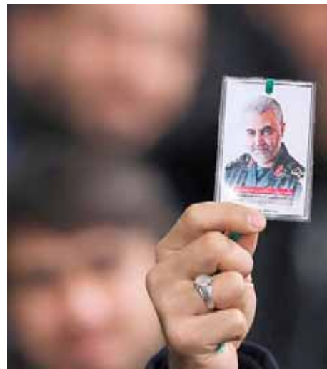
El anfitrión de la Casa Blanca comentó que el ataque eliminó a “dos por el precio de uno”

Los militares, entre otras cosas, informaron al Presidente que el general iraní había llegado al Aeropuerto Inter-