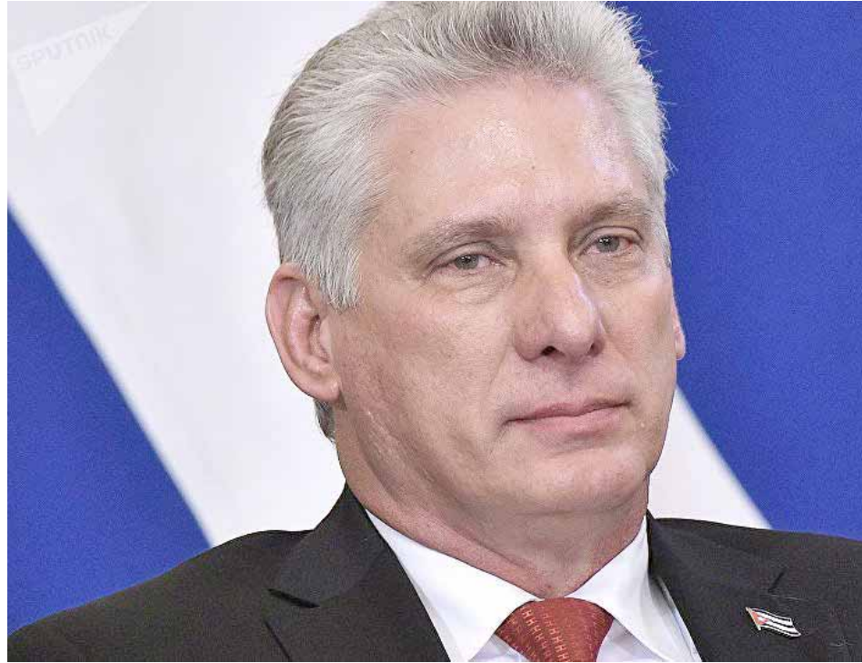
Cada gobierno local estará conformado por varias unidades de los Consejos Provinciales

La enhorabuena se suma a la del presidente de la Asamblea Nacional y del Consejo de Estado de Cuba, Esteban Lazo, quien lo hizo el sábado, poco