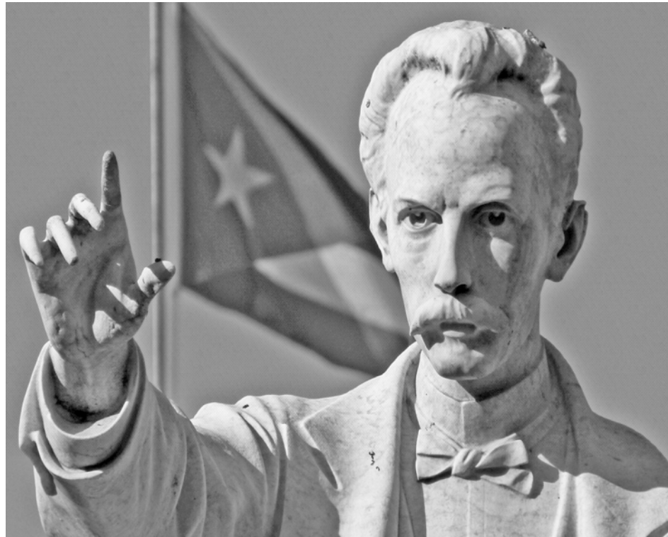
Hace 139 años, cuando apenas tenía 28, el cubano llegó a la capital venezolana

Esta muestra que se abrirá a partir de las 10:00 de la mañana, está formada por dibujos elaborados por niñas, niños, usuarias y usuarios seguidoras y seguidores de las redes sociales de bibliotecas