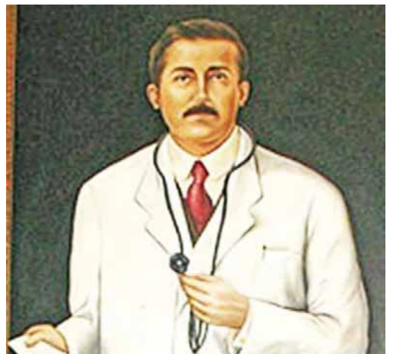
Más de 25 piezas conforman la propuesta plástica

Con 17 años fue admitido en la Universidad Central de Venezuela en la carrera de Medicina. Obtuvo el grado de médico en 1888. Realizó estudios en París (Francia). En el laboratorio de Mathias Duval profundizó en las aéreas de Microbiología, Histología Normal, Patología, Bacteriología, Embriología y Fisiología Experimental y estudió en Berlín Histología y Anatomía Patológica, a la vez