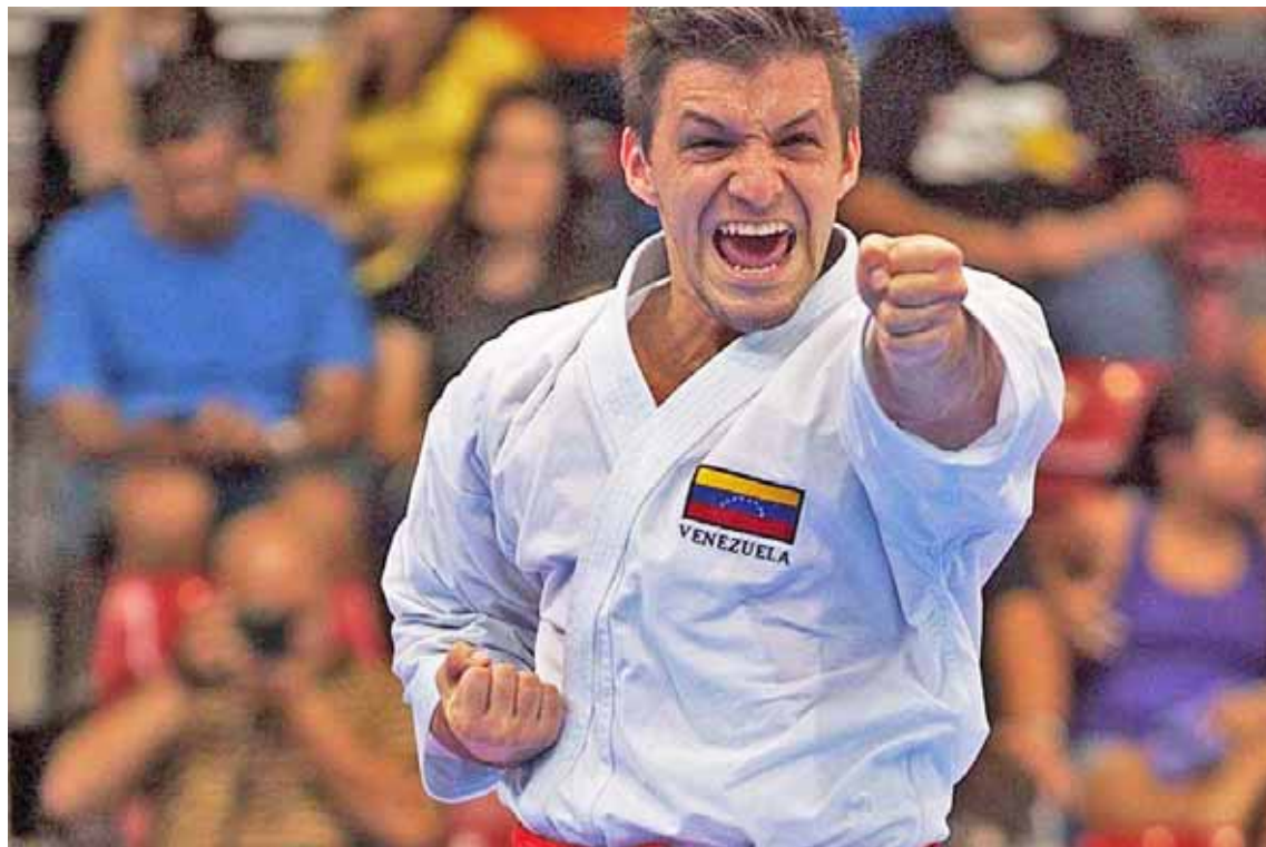
Díaz es una gloria de las artes marciales nacionales

Para conseguir su boleto olímpico Díaz deberá encarar cuatro compromisos, que co-