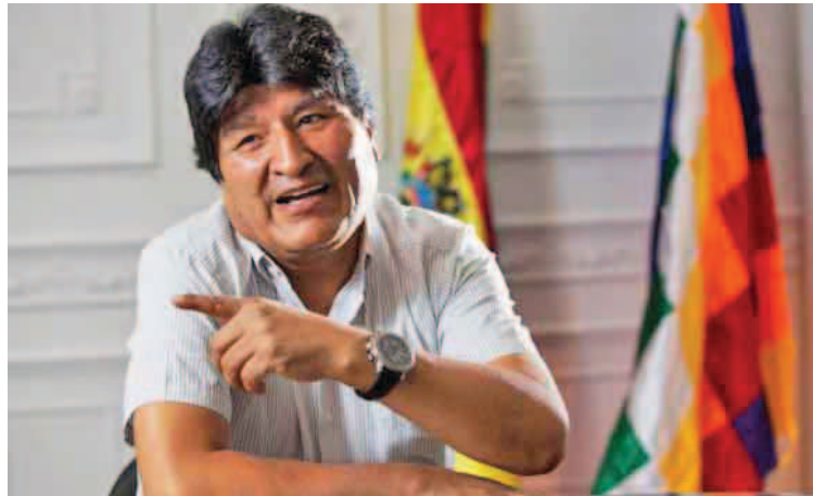
El expresidente Evo Morales no descarta convertirse en diputado o senador

El líder indígena afirmó “primero, los golpistas tuvieron miedo de mi candidatura a la Presidencia, “ahora temen que me postulen como diputado o senador, quieren proscribirme y silenciarme, pero no lo lograrán”, señaló