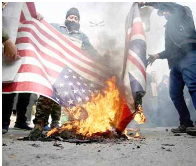
Irán considera de ilegales las medidas anunciadas por el Departamento del Tesoro

T/Redacción CO Teherán