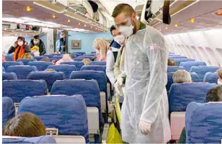
Hasta la fecha se registran 213 fallecidos por la epidemia

T/Redacción CO Beijing