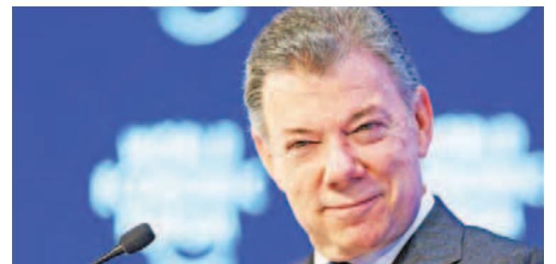
Juan Manuel Santos considera que el diálogo debe ser la razón de ser entre naciones