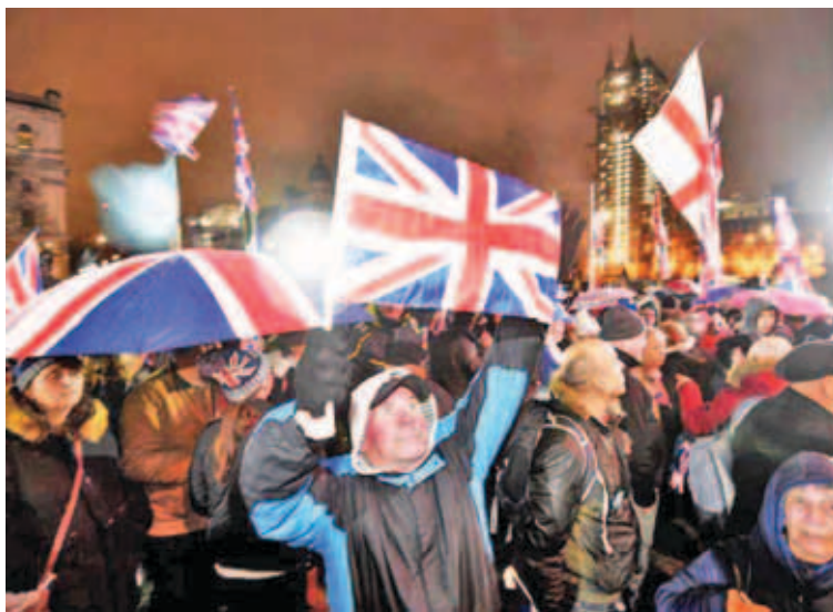
Los británicos celebraron en las calles la separación de la Unión Europea