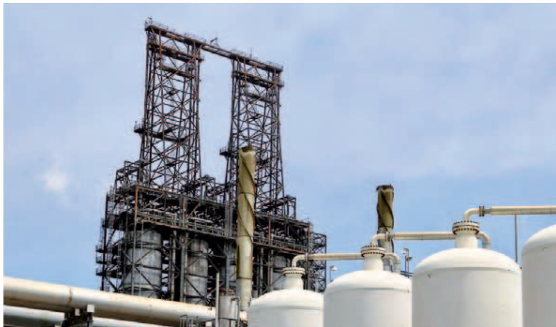
Pdvsa sigue recuperándose

Esta labor de mantenimiento correctivo, implementada desde hace tres años, consiste