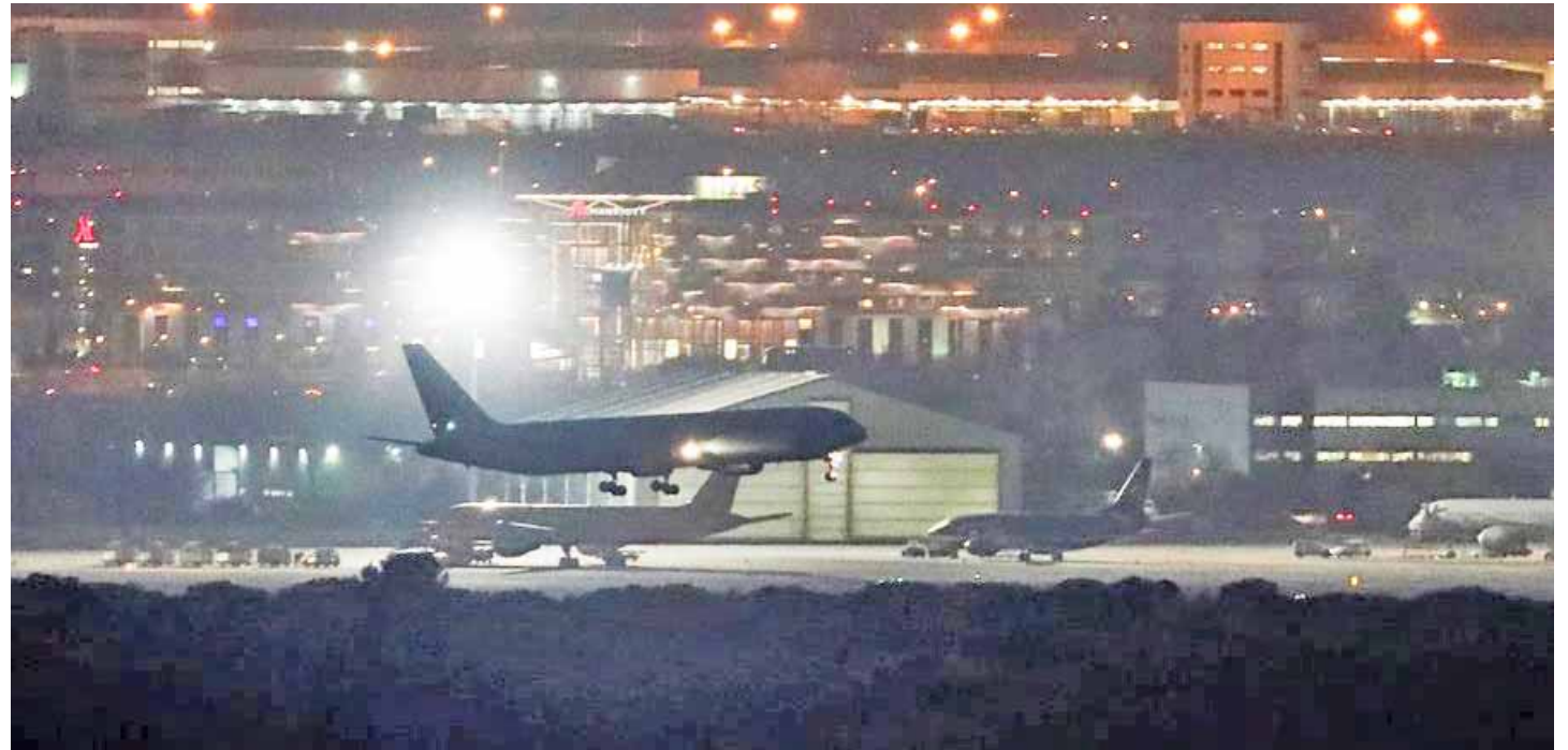
El vuelo se dirigía a Toronto, Canadá

El comandante del vuelo por el altavoz advirtió a los pasajeros: “Hemos tenido un problema en el despegue con una de las ruedas y estamos volviendo al aeropuerto de Madrid. “Les pedimos mucha