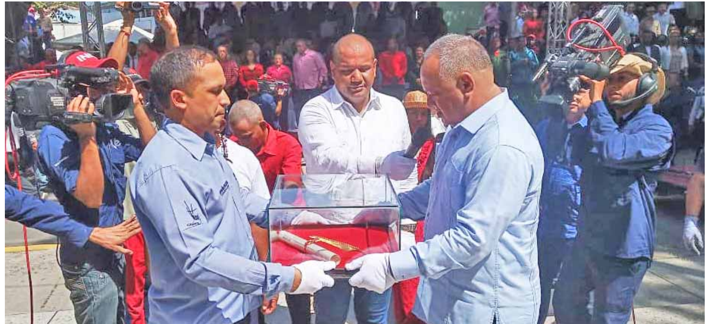
“El pueblo venezolano está consciente de su lucha histórica”, subrayó Cabello

Reiteró que por niños y niñas de la patria “estamos obligados a dar estas luchas todos los días y a no rendirnos en ningún momento. Por nuestros hermanos excluidos de toda la vida, estamos obligados a dar esta batalla. Esta es una