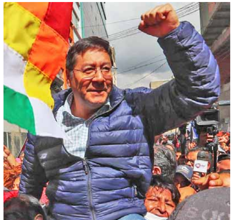
El candidato Luis Arce dijo que las encuestas le dan un 60% de ventaja

Una victoria en las urnas -dijo- serviría para demostrarle a la derecha del país que el pueblo boliviano está unido detrás de una candidatura que defiende sus intereses.