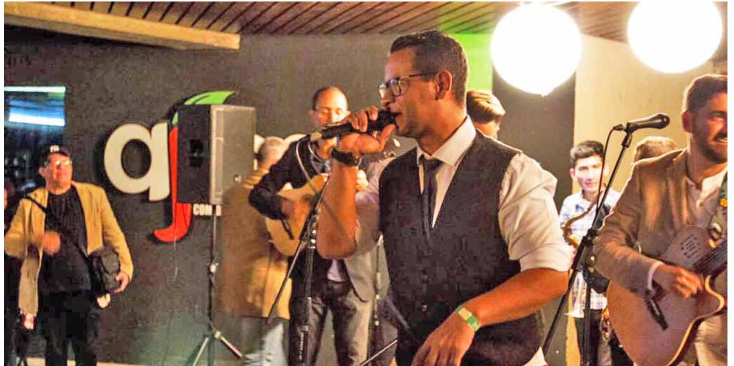
Inicialmente la grilla incluye cerca de 20 bares y unos 22 artistas y agrupaciones

En el recorrido el grupo de parranderos notó que además de cerrar sucesiva-