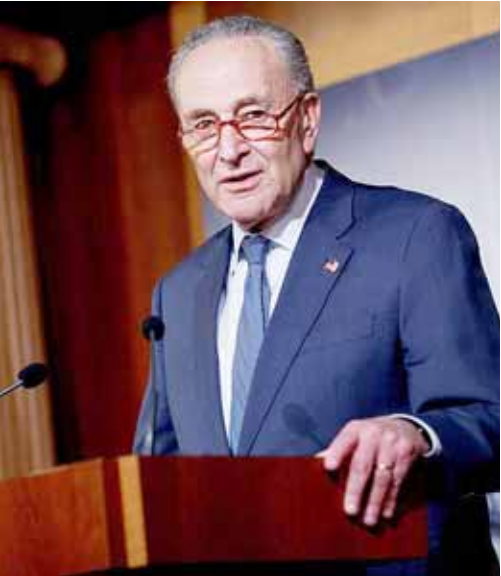
El Schumer, tildó de fracaso política contra Venezuela

violentas amenazas pero, además, fue considerada como una “política de fracaso” por algunos políticos estadounidenses, reseñaron medios digitales.