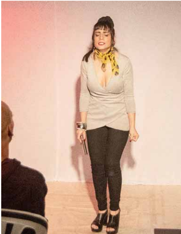
En La diversidad logra un personaje lleno de contradicciones jocosas

-No creo sentirme “mejor” en ninguna de las dos. No hay para mí una fisura entre los géneros aunque, estructuralmente, obvio que exista. Un texto es eso, un texto. Palabra muerta que se hace vida a partir del actor. Así como el director decide por dónde quiere llevar su montaje, dependiendo de qué voz o llamado quiera contestar con su visión, algo similar ocurre