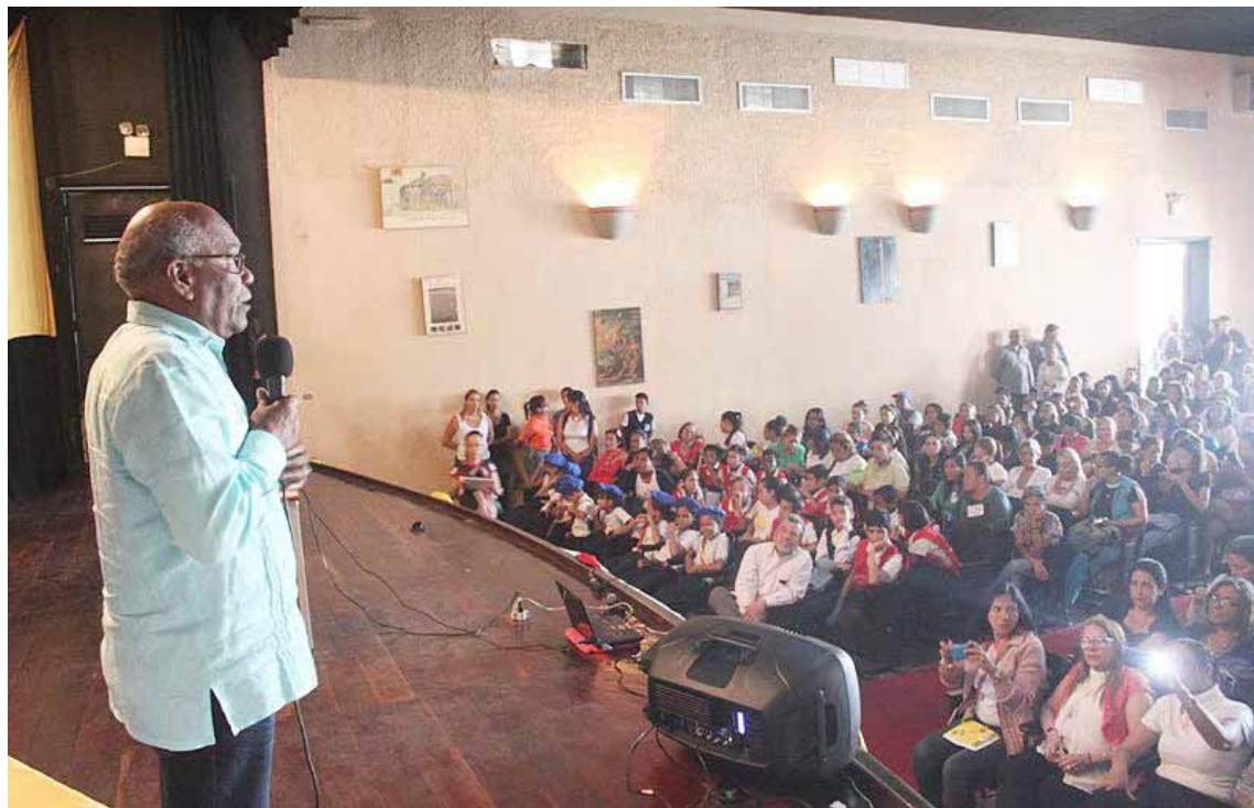
Istúriz propuso realizar un gran congreso pedagógico con las mejores ponencias

Es de fundamental importancia para el fortalecimiento del sistema educativo, reforzar y profundizar los intercambios de las experiencias pedagógicas, así lo aseguró el ministro del Poder Popular para la Educación, Aristóbulo Istúriz.