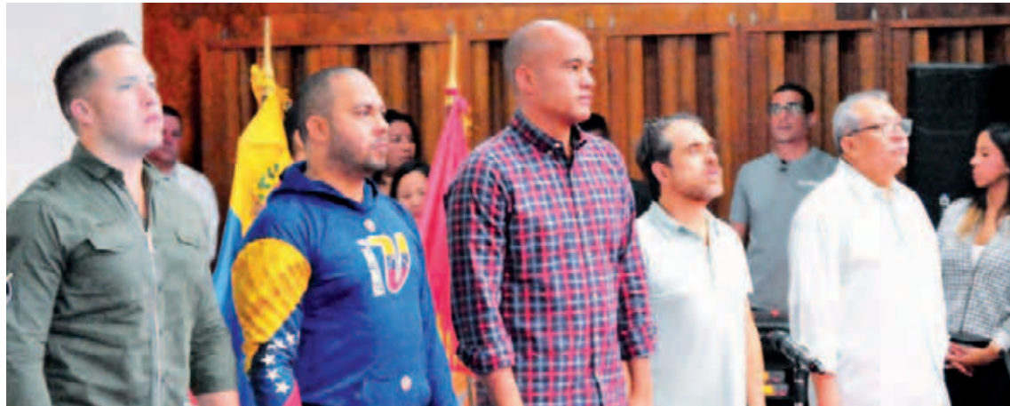
Los participantes ratificaron su lealtad al presidente Nicolás Maduro

Los militantes del Partido Socialista Unido de Venezuela (PSUV) de Carabobo trabajaron el ámbito político ideológico en una nutrida reunión que contó con la participación de Héctor Rodríguez, miembro de la Dirección Nacional de este movimiento, y el gobernador de esta entidad, Rafael Lacava.