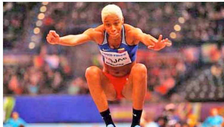
Yulimar tendrá su primera justa en salto triple

Rojas forma parte del grupo de deportistas que por el atletismo venezolano están en ruta clasificatoria olímpica de cara a los venideros Olímpicos de Tokio 2020. Actualmente se encuentra en España donde está cumpliendo con su período de preparación, además de concre-