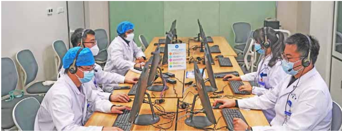
Xi Jinping dijo que China protegerá la salud no solo de su gente, sino de la gente de todo el mundo

Durante una conversación telefónica con su homólogo estadounidense, el Mandatario chino dijo que su país no descarta que Estados Unidos analice la epidemia de manera sosegada y adopte sus medidas de respuesta de forma razonable