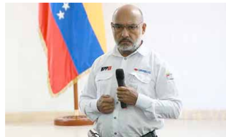
Crean sistema de alertas tempranas ante posibles actos de sabotaje al SEN

Precisó que en total está previsto la entrega de 3.000 lumi-