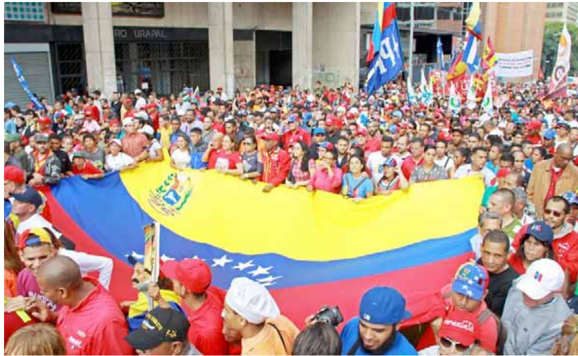
Habrán puntos de agitación en las esquinas El Chorro, La Bolsa y Carmelitas

Al respecto, en la actividad realizada ayer en la Casa Nacional de las Letras Andrés Bello, el jefe de gobierno del