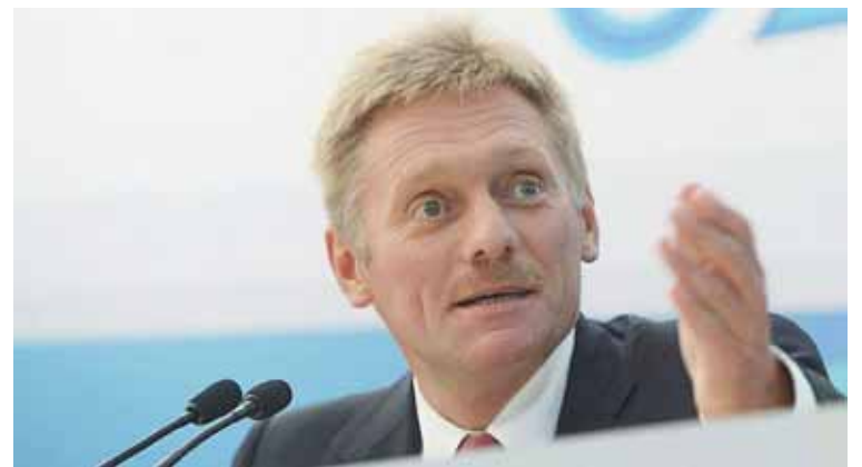
Dmitri Peskov dijo que muchos países sufren las restricciones impuestas por EEUU

Cabe destacar que Rusia ha suscrito con Venezuela cerca de 300 acuerdos de cooperación en materia de petróleo, hidrocarburos, energética, tecnología agrícola, económica, asesoría militar y transporte, entre otras áreas, y ha ratificado su disposición de seguir cooperando con Venezuela en distintos ámbitos.