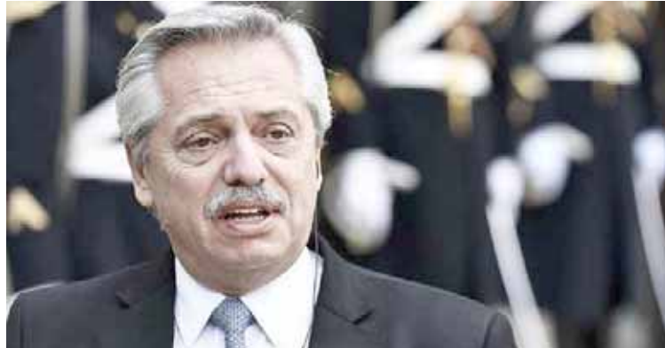
El presidente argentino dijo que fue muy importante la respuesta de apoyo que recibió en Europa

El Mandatario destacó que quisieran destinar el pago de la deuda a la reestructuración de la economía, y “si pagáramos, igual no nos va a alcanzar, pero estaríamos sumiendo a la economía en una postración absoluta”, afirmó Alberto Fernández