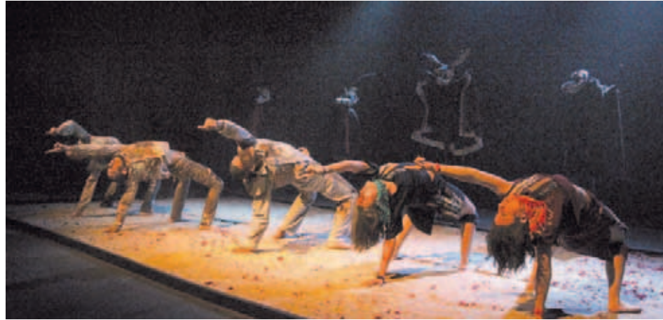
Las últimas funciones serán los días 15 y 16 de este mes

En plena escena, de manera intercalada, estos personajes son exorcizados para dejar salir al actor, al intérprete, igualmente para dejar al descubierto al artista, al histrión intrínseco en la persona que escogió la expresión escénica como modo de vida.