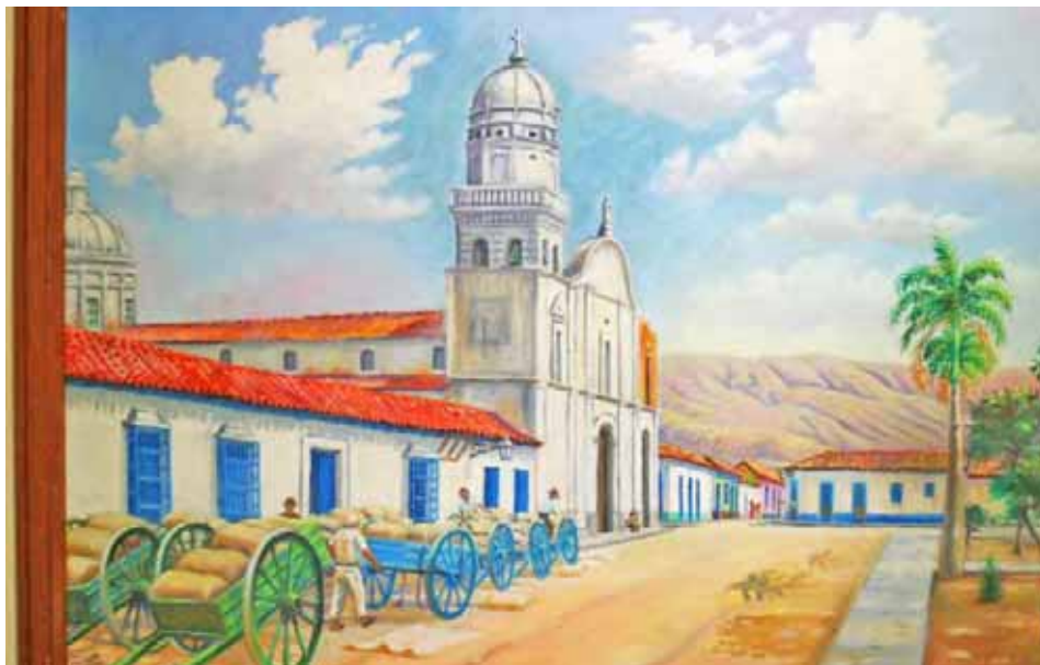
Nirgua en 1925