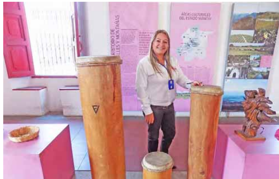
Casa de la Diversidad Cultural

Por el sector oeste de la plaza Bolívar, en las calles adyacentes, se ubican antiguos negocios, bares, y expendios de verduras y granos que surten de víveres, mercancías y utensilios a los campesinos provenientes de las zonas rurales y montañosas. Por allí, por la calle 19 de Abril, se agarra la vía que lleva a los caseríos del cerro El Píchico, donde los conquistadores españoles, para defenderse de los jiraharas y proteger el transporte de oro, se vieron obligados a construir el único