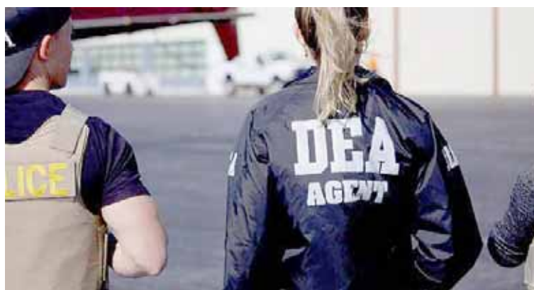
DEA destacó que estos grupos criminales son formados y dirigidos por estadounidenses