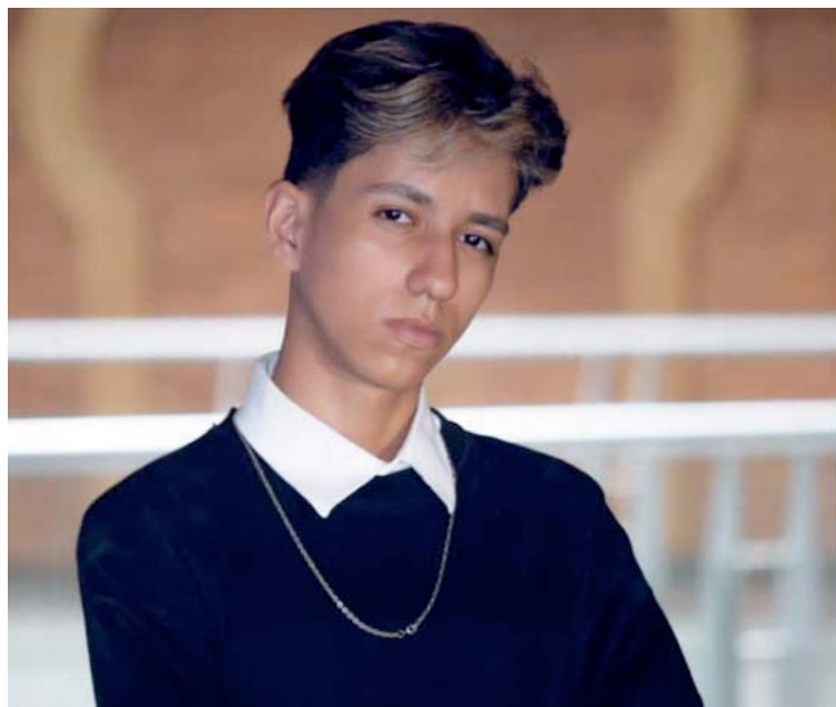
Desde niño está cantando

En la actualidad, el carnaval venezolano sigue recreándose con bailes, música, disfraces, papelillos, sorpresas y juegos, que se replican a lo largo del país, especialmente en entidades como Sucre, Bolívar, Portuguesa, Miranda, La Guaira y Caracas, donde aún se mantienen los desfiles de carrozas, la elección de la reina y el rey de carnaval y la realización de conciertos.