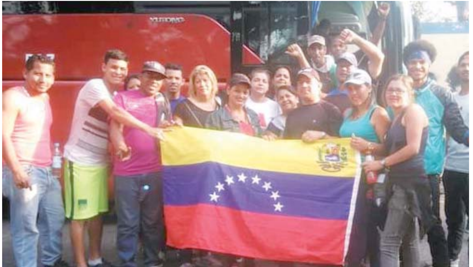
Patriotas de la parroquia La Vega, de la Brigada Robert Serra, de la Jpsuv de Caracas, entre otros, acudieron a defender la frontera

En una muestra de la que luego se revelaría como uno de los rasgos de su retorcida personalidad, mentir con descaro y sin rubor, arrojó cifras hiperbólicas, sin ninguna sustentabili-