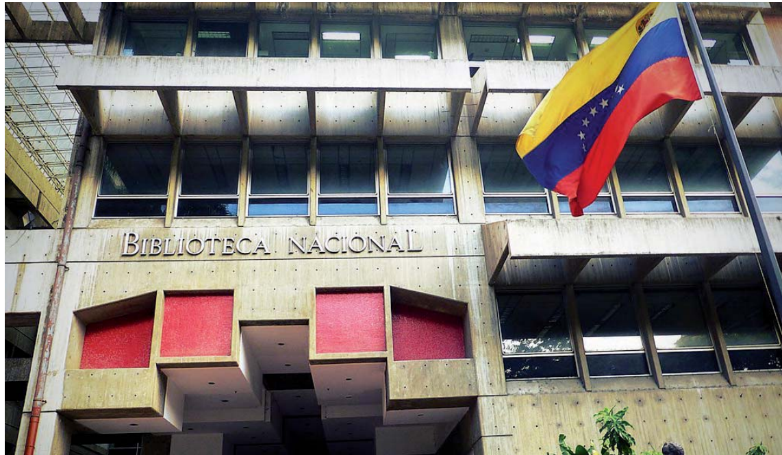
Nuestros carnavales tienen una rica tradición histórica

Junto a estos textos también se muestra una selección de materiales de la colección de Ori-