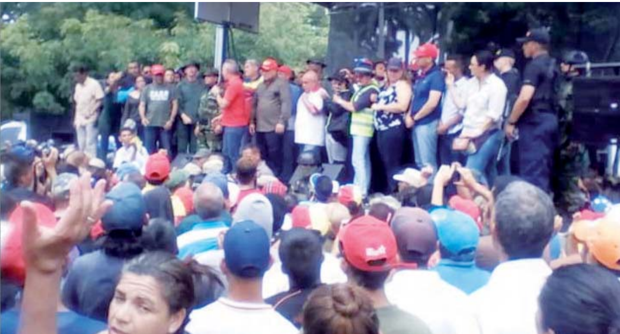
Varios de los dirigentes de la Dirección Nacional de PSUV