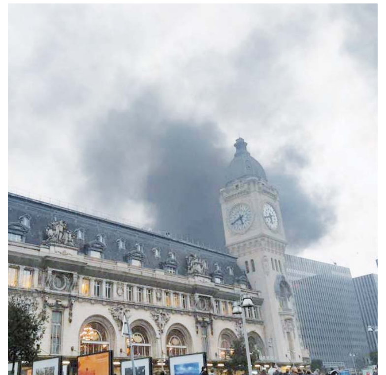
Las autoridades detuvieron a 25 personas por el suceso

Las fuerzas de seguridad del Estado tomaron los alrededores de la sala de conciertos donde Fally Ipupa debía presentar sus últimas novedades musicales.