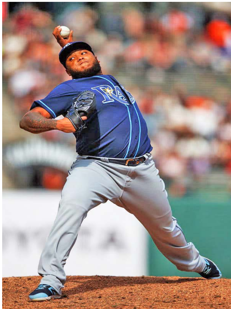
El siniestro debe ser más consistente

“Todavía nadie tiene el rol de cerrador. Aún no me han di-