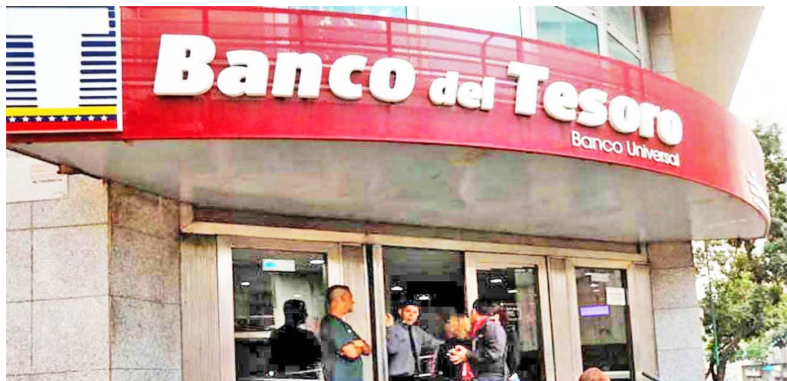
El sector emprendedor siempre es beneficiado por Banco del Tesoro.

La cartera de créditos sociales dispone de cinco tipos de financiamiento, estos son: Tesoro Comunal, CrediSocial Productivo, CrediPatria Pensionados, Soy Joven y Soy Mujer, los dos últimos se gestionan en alianza con los ministerios del Poder Popular para la Juventud y Deportes y para la Mujer e Igualdad de Género.