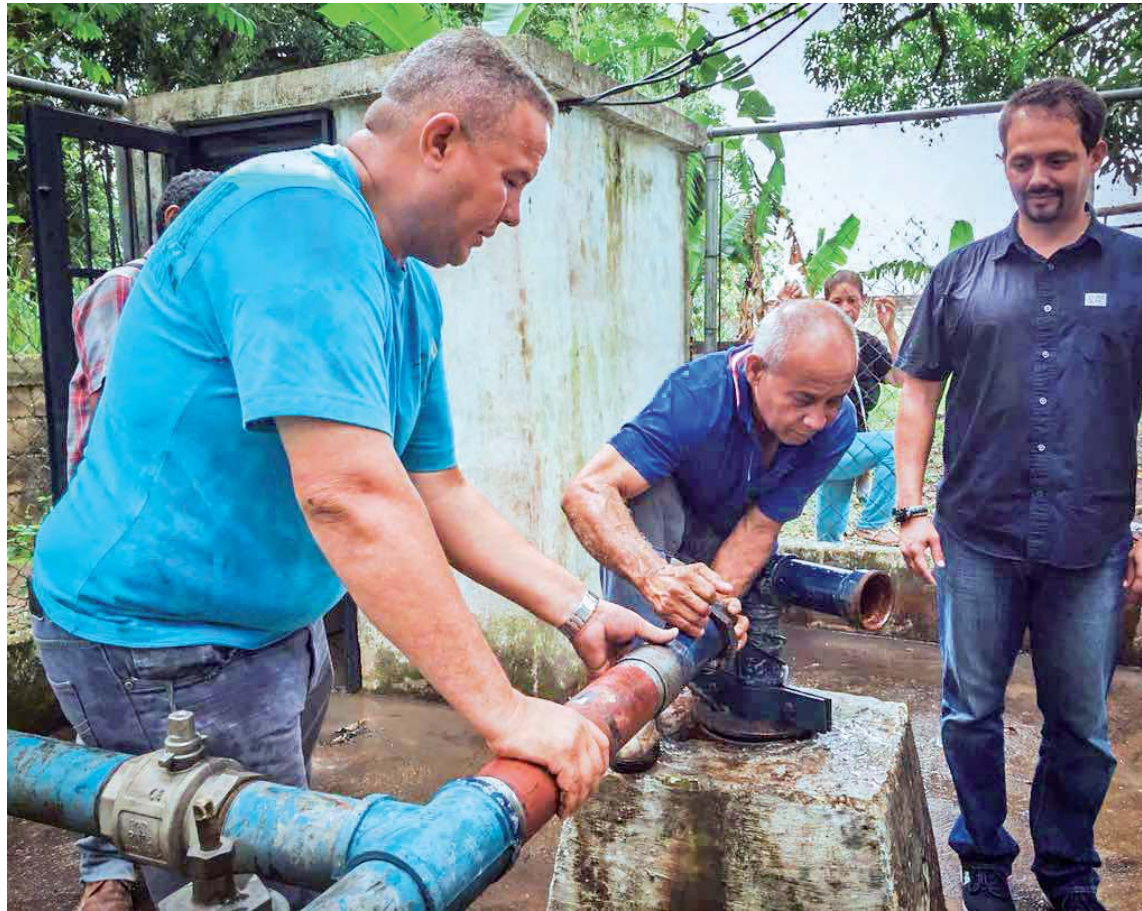
Mientras la red eléctrica mantenga su funcionamiento estable, “será más constante el bombeo”, notificó Perozo

Mediante un video de la Alcaldía de Libertador publicado en las redes sociales, el burgomaestre del Partido Socialista Unido de Venezuela (PSUV) explicó que el 70% del agua que llega a los hogares proviene de pozos profundos y el otro 30% llega por los bombeos de la Hidrológica del Centro (Hidrocentro).