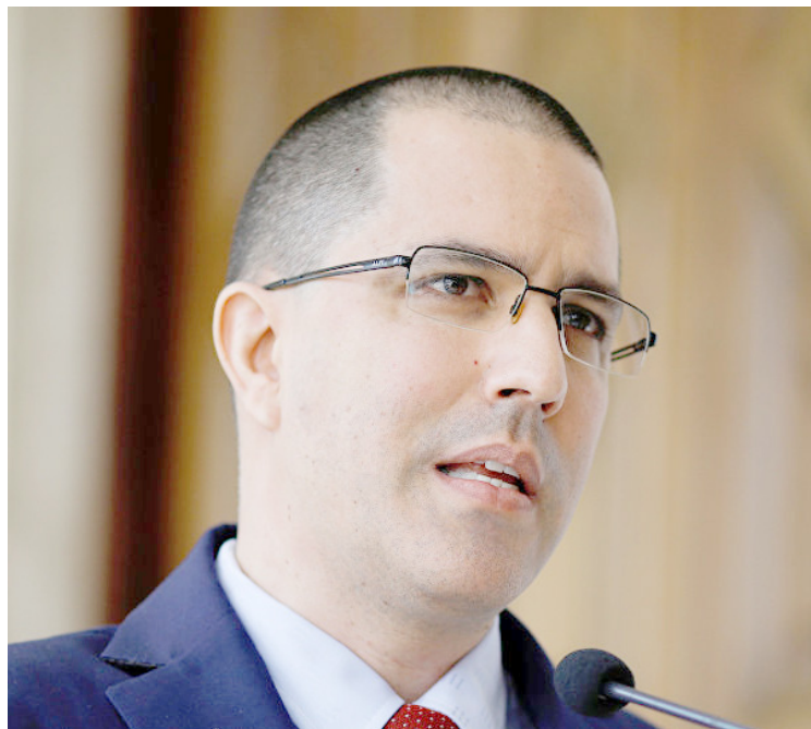
La CPI ordenó con efecto inmediato la reasignación del caso de Venezuela

En un recuento de los hechos, el pasado 13 de febrero, el Gobierno Nacional presentó ante la CPI una denuncia para que se investiguen los