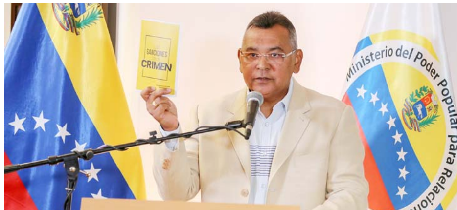
“Se están efectuando algunos allanamientos en todo el país”, informó Reverol

Así lo informó ayer el ministro para Relaciones Interiores, Justicia y Paz, Néstor Luis Reverol, en declaraciones transmitidas por VTV, en las que explicó que el pasado miércoles 4, la Policía Nacional Bolivariana (PNB) en Barinas, en la troncal número 5, detuvo a un ve-