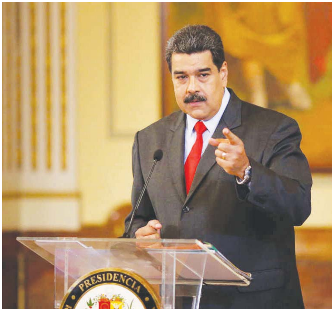
“Estamos en despliegue permanente en defensa de la paz nacional”, aseveró Maduro

Como se recordará el 7 de marzo de 2019 se perpetró un ataque cibernético a la Central Hidroeléctrica Simón Bolívar ubicada en Guri, estado Bolí-