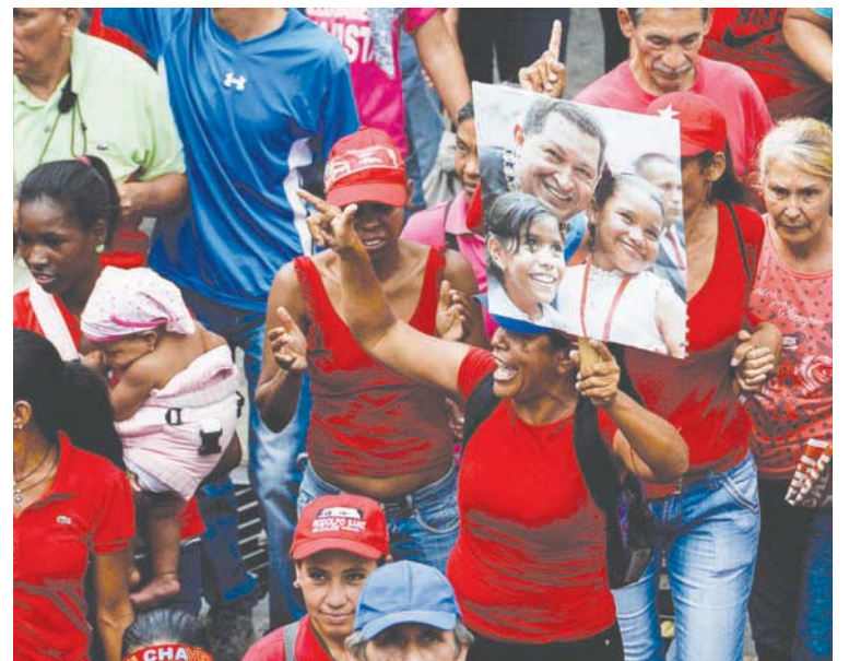
“Somos la vanguardia de la Revolución y de las calles no nos sacan”, aseveró Villegas

Subrayó que las mujeres son las principales víctimas de las medidas coercitivas y unilaterales que aplica el imperio estadounidense contra Venezuela. Ante ese escenario, enfatizó: las mujeres han actuado con valentía para generar condiciones de vida “para nuestros hijos y para nosotras mismas”, acotó.