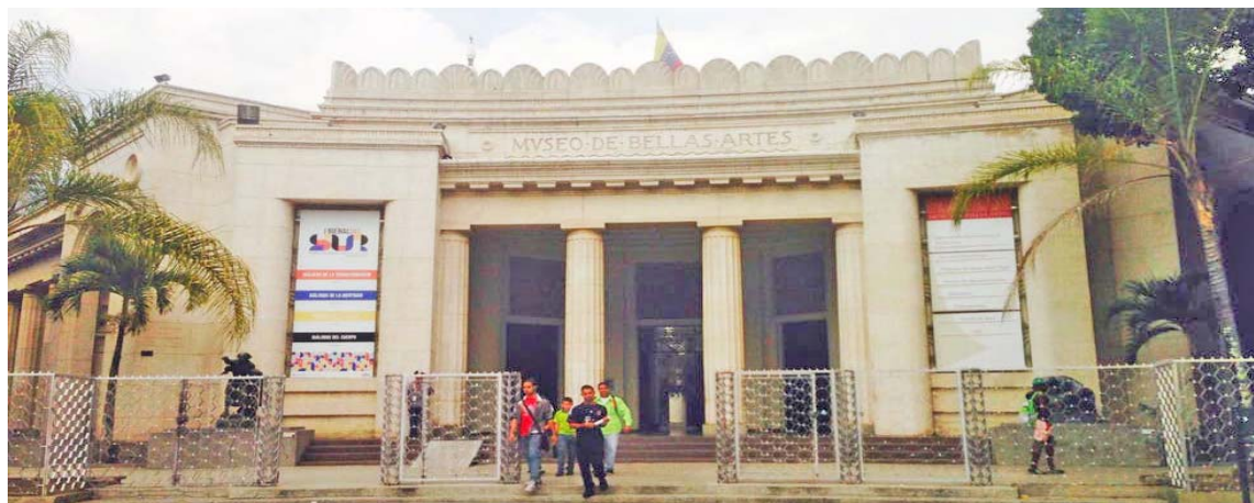
La propuesta incluye emblemáticas piezas de la artista

T/ Redacción CO