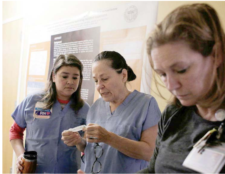
Médicas se preparan para atender a un paciente

Los casos detectados de Covid-19 en Estados Unidos incluyen a tres personas que fueron evacuadas de la ciudad china de Wuhan, epicentro del brote, 14