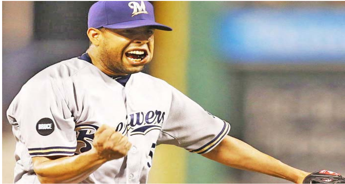
K-Rod vivió buenos años en las mayores que le darían votos para intentar llegar al Salón de la Fama

En su carrera de 16 torneos, tiene el récord de más salvados en un torneo de la MLB con 62, obtenido en 2008 con Anaheim.