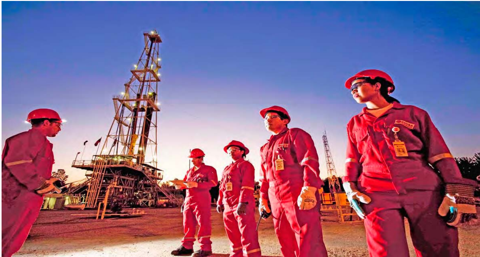
Los trabajadores petroleros trabajan mancomunadamente

La empresa mixta quiere una producción segura en Campo Boscán