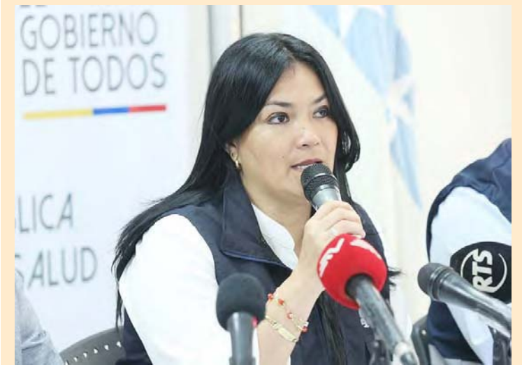
Catalina Andramuño titular del Ministerio de Salud ecuatoriano

De esta cifra, 78.961 casos corresponden a China y 4.691 al resto del mundo. Los nuevos datos suponen que en las últimas 24 horas se han registrado un total de 1.358 casos adicionales, 1.027 de ellos fuera del país asiático, donde el pasado diciembre se originó el brote.