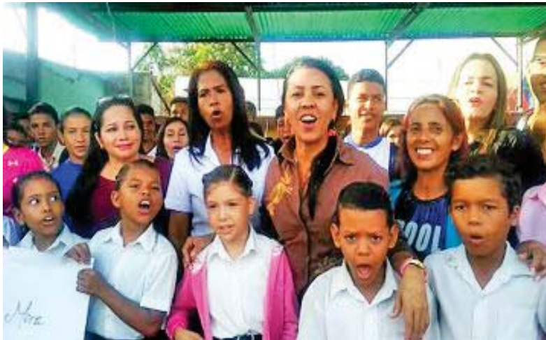
La jornada sirvió para crear conciencia entre los más pequeños

T/ Luis Tovías Baciao F/ @villegassequera Valencia