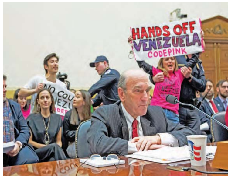
El movimiento rechaza injerencia de EEUU en Venezuela

“Elliott Abrams, un importante arquitecto de la guerra