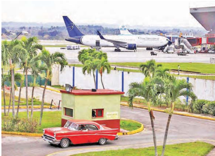
Las nuevas sanciones violan derechos humanos de los cubanos y de estadounidenses

La medida afecta a nueve aeropuertos internacionales EEUU suspende vuelos chárter públicos con Cuba y recrudece bloqueo contra la isla