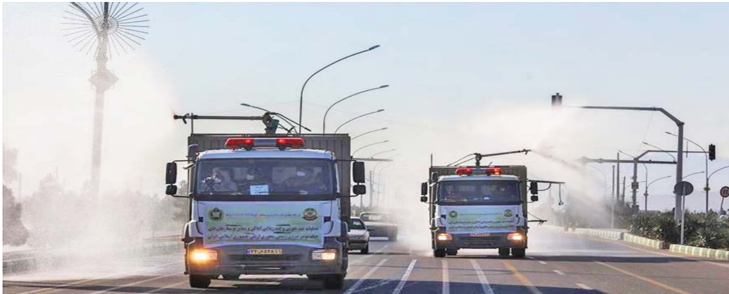
Señalan que existen muchos laboratorios biológicos de EE.UU. cerca de la nación persa

En el contexto de esta práctica se establecerán 300 centros médicos en todo el país para identificar a los pacientes infectados con coronavirus y prevenir la propagación de la enfermedad