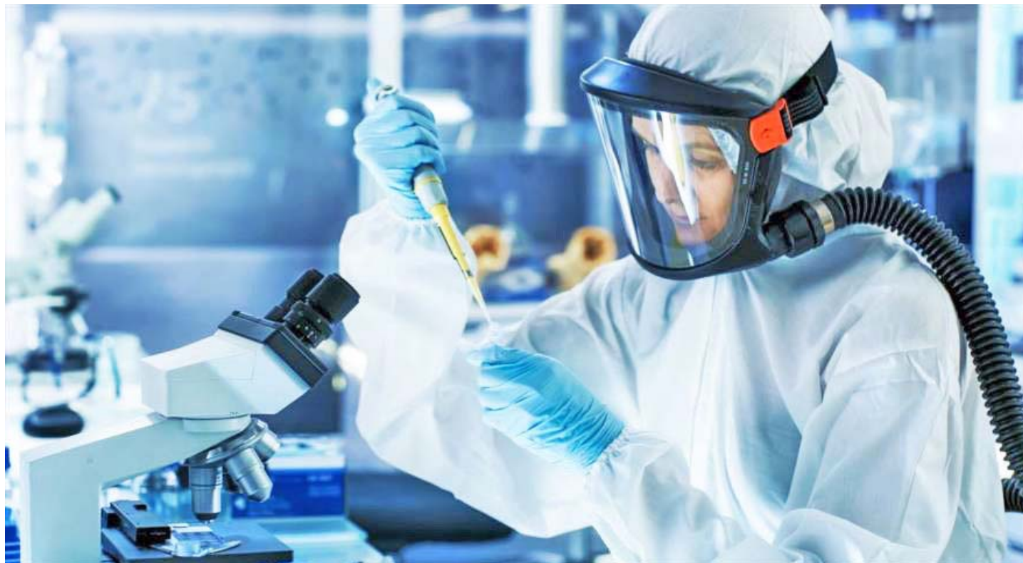
Una investigadora analiza una muestra de ensayo en un laboratorio científico en EEUU

Ante la insistencia de los medios asiáticos al Gobierno estadounidense no le quedó otro remedio que anunciar que los laboratorios gubernamentales de Los Ángeles, San Francisco, Seattle, Chicago y Nueva York evaluarían a las personas con síntomas similares a la gripe común con el objetivo de detectar si han sido infectadas con el nuevo coronavirus