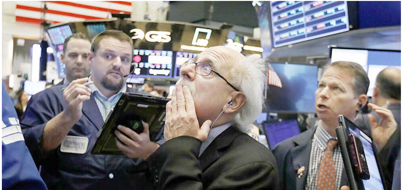
Los eventos sobrevenidos imposibilitan acertar los pronósticos

Mientras tanto, el 7 de marzo el Líbano anunció no haber podido cumplir con su compromiso de reembol-