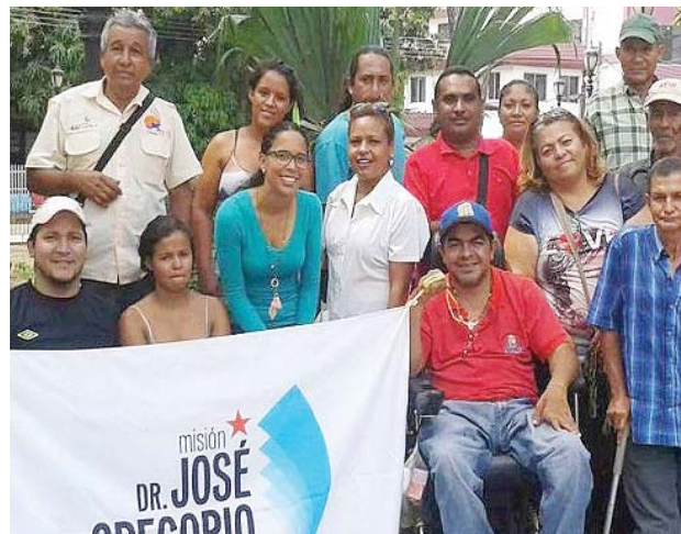
El pueblo siempre es apoyado por el Gobierno revolucionario

El presidente de la República Bolivariana de Venezuela, Nicolás Maduro Moros, saludó a la familia de la Misión Doctor José Gregorio Hernández, que hace realidad el plan humanista que reivindica los derechos de los ciudadanos con alguna discapacidad.