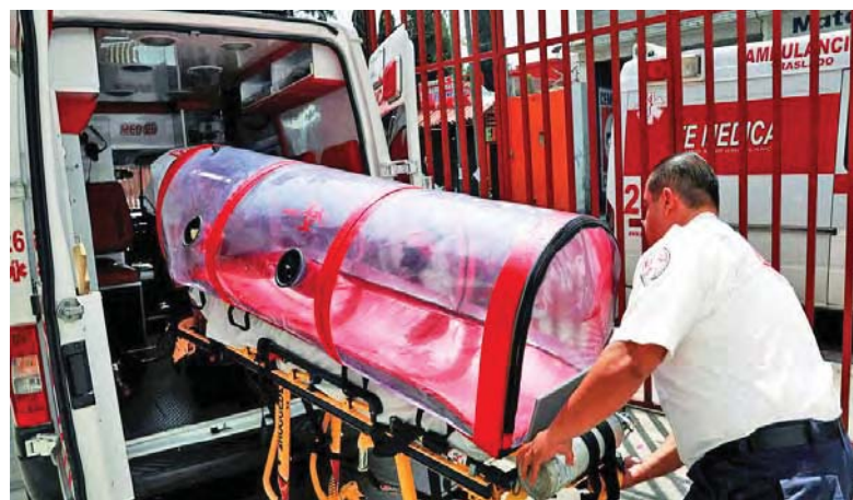
El invento brinda una mayor protección a los trabajadores de la salud

El diseño de la cápsula se inspira en las cámaras neonatales que sirven para proteger a los niños de patógenos externos y crea un ambiente estéril. Sin embargo, esta cápsula funciona siguiendo el principio contrario, ya que el sistema de filtración de aire que mantiene la cápsula inflada evita que los virus o bacterias salgan al exterior.