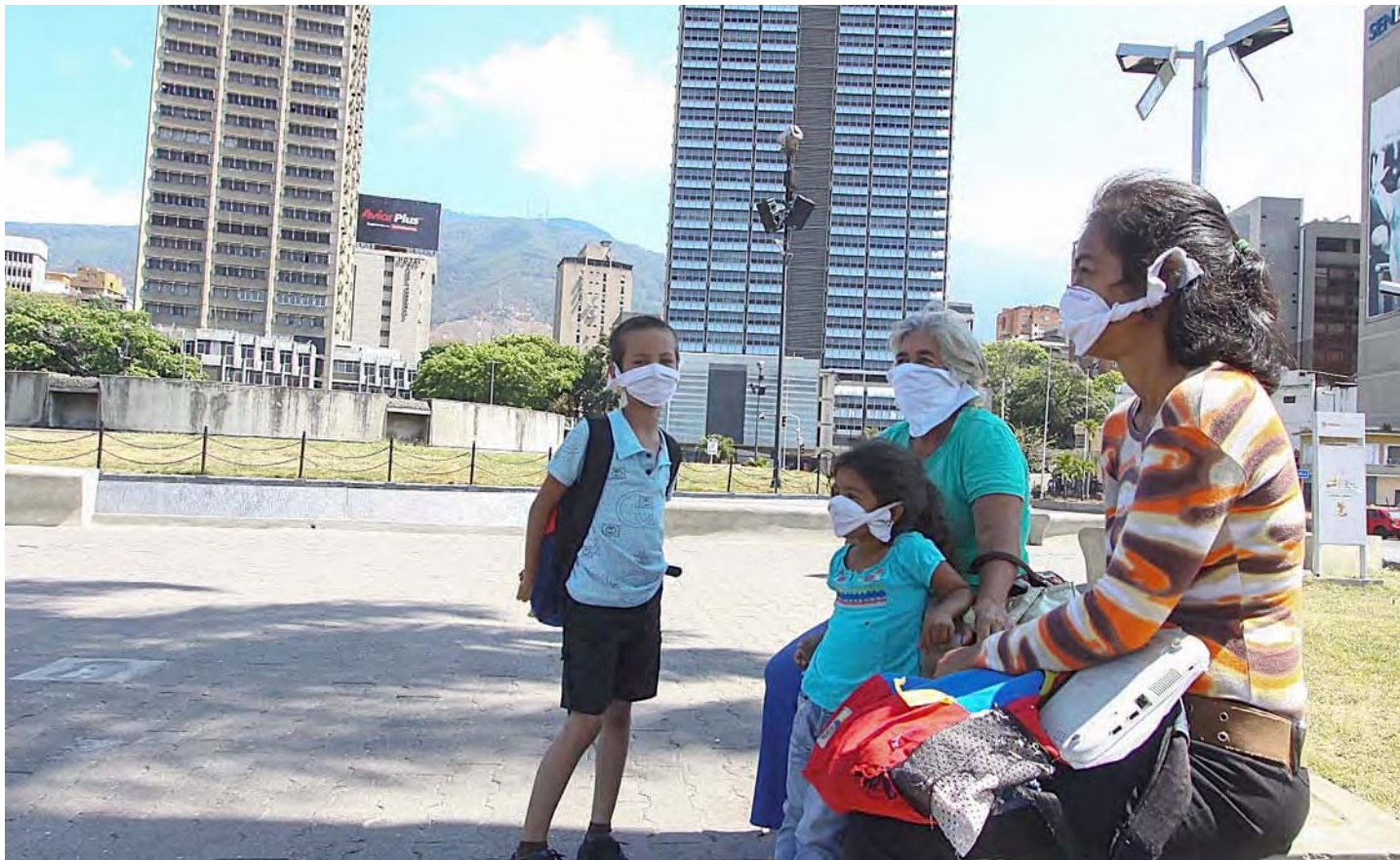
La protección tiene que ser prioridad para los venezolanos