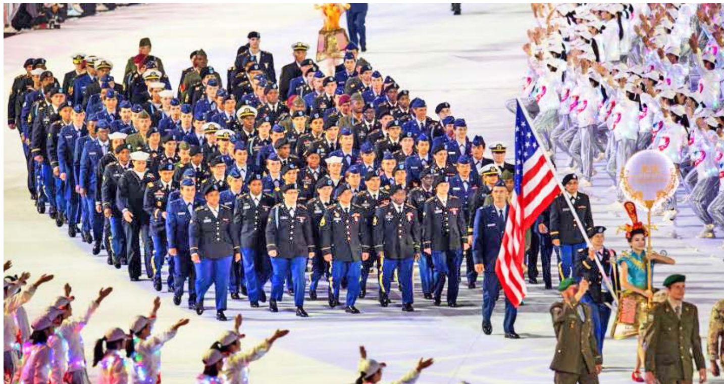
Ejército de EEUU habría llevado coronavirus a China Juegos Mundiales Militares 2019 en Wuhan

ginales transmitieron el virus a los trabajadores y vendedores del mercado de mariscos, y luego estos contagiaron a los compradores de sus productos.