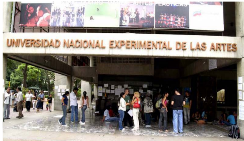
Las áreas vitales para el funcionamiento se mantendrán activas

De acuerdo al comunicado académico, se mantendrán en la institución de educación superior las actividades administrativas vitales para el funcionamiento operativo (vigilancia