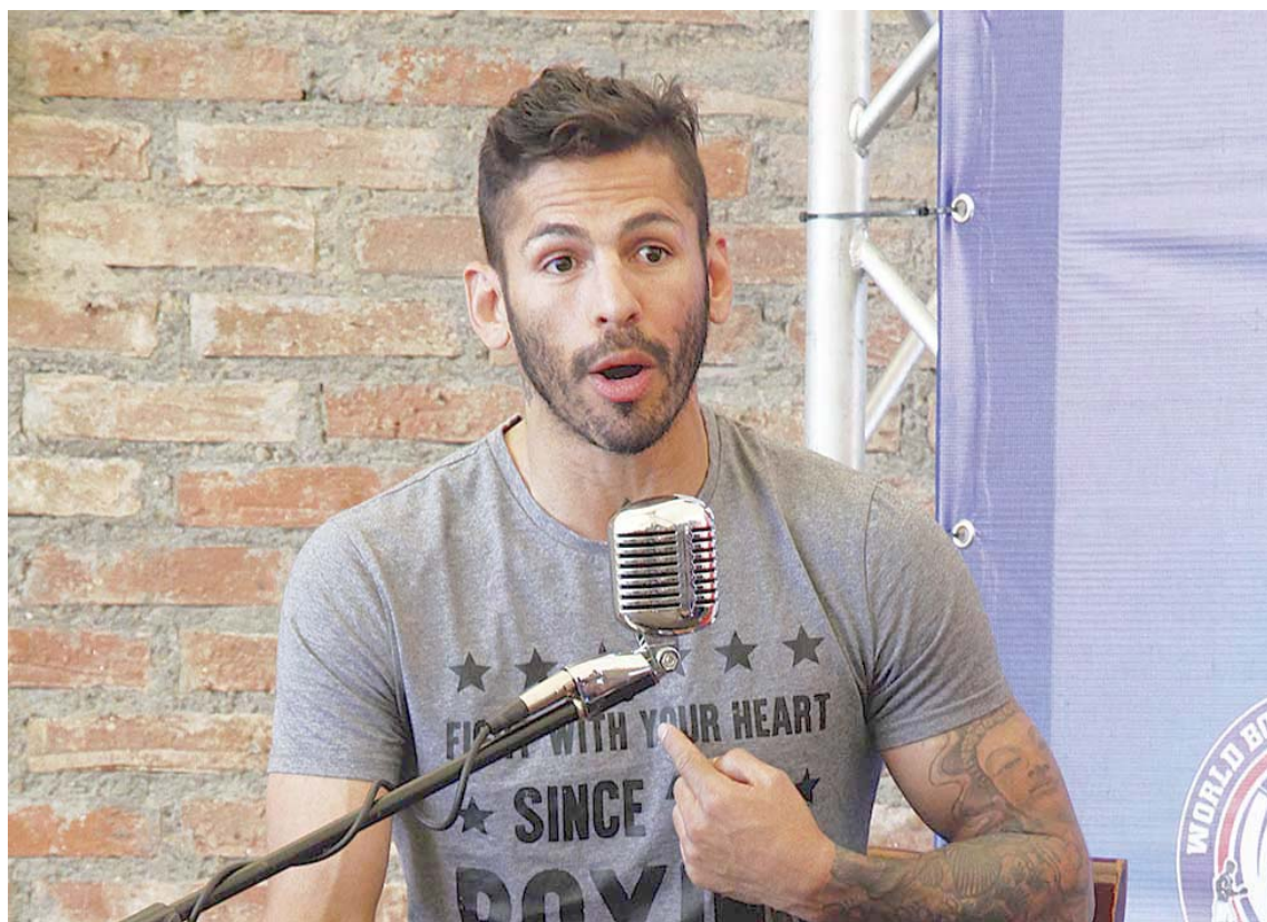
Linares quiere seguir dos o tres años más en los cuadriláteros

Su último careo fue el pasado sábado 15 de febrero en Estados Unidos, cuando venció al mexicano Carlos Morales por nocaut en el cuarto round con un dere-