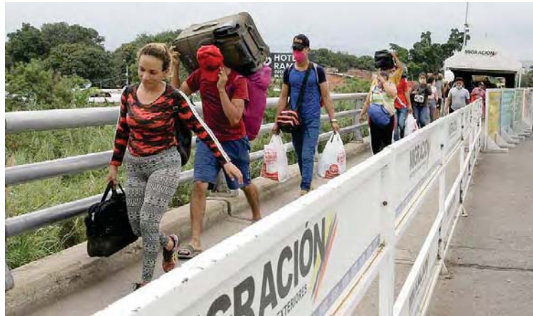
Emprenden plan conjunto después de que Duque aceptó la propuesta de Maduro

Para evitar la propagación del Covid-19 Venezuela y Colombia emprenderán planes conjuntos, que incluirán concretamente monitoreo constante de los pasos fronterizos entre los dos países