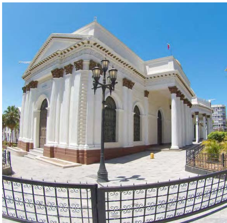
ANC compromete todos sus esfuerzos para derrotar el Covid-19

Por medio de un comunicado el órgano plenipotenciario hizo un llamado al pueblo para que actúe con conciencia y organización, y siga en cada momento las recomendaciones del Gobierno Bolivariano