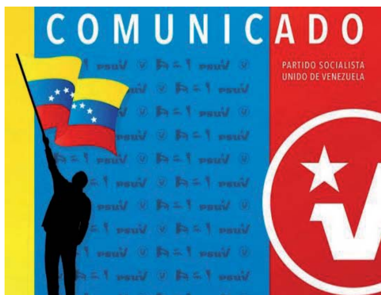
El objetivo es preservar la vida incluso de quienes adversan la Revolución bolivariana

El texto del citado comunicado señala además: “La humanidad enfrenta hoy una situación cuya gravedad supera nuestra memoria, el Covid-19, un virus hoy considerado pandemia. El referido virus nos obliga militantemente a redoblar nuestros esfuerzos en pro de la vida, por ello des-