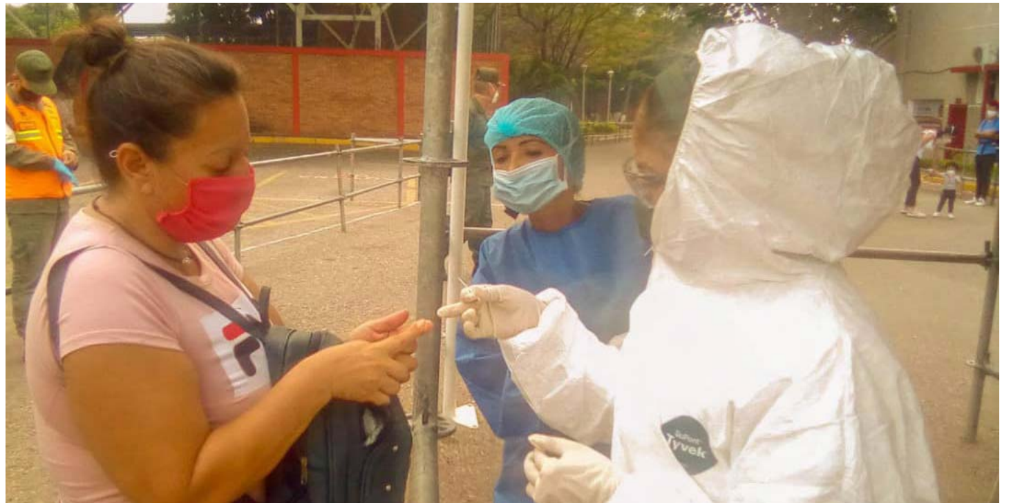
En la frontera detuvieron a 4 integrantes de grupos paramilitares que pretendían infiltrarse

Informó que el pasado lunes fueron detenidos cuatro personas pertenecientes a grupos de mercenarios y paramilitares, quienes pretendían infiltrarse entre los miles de venezolanos que in-