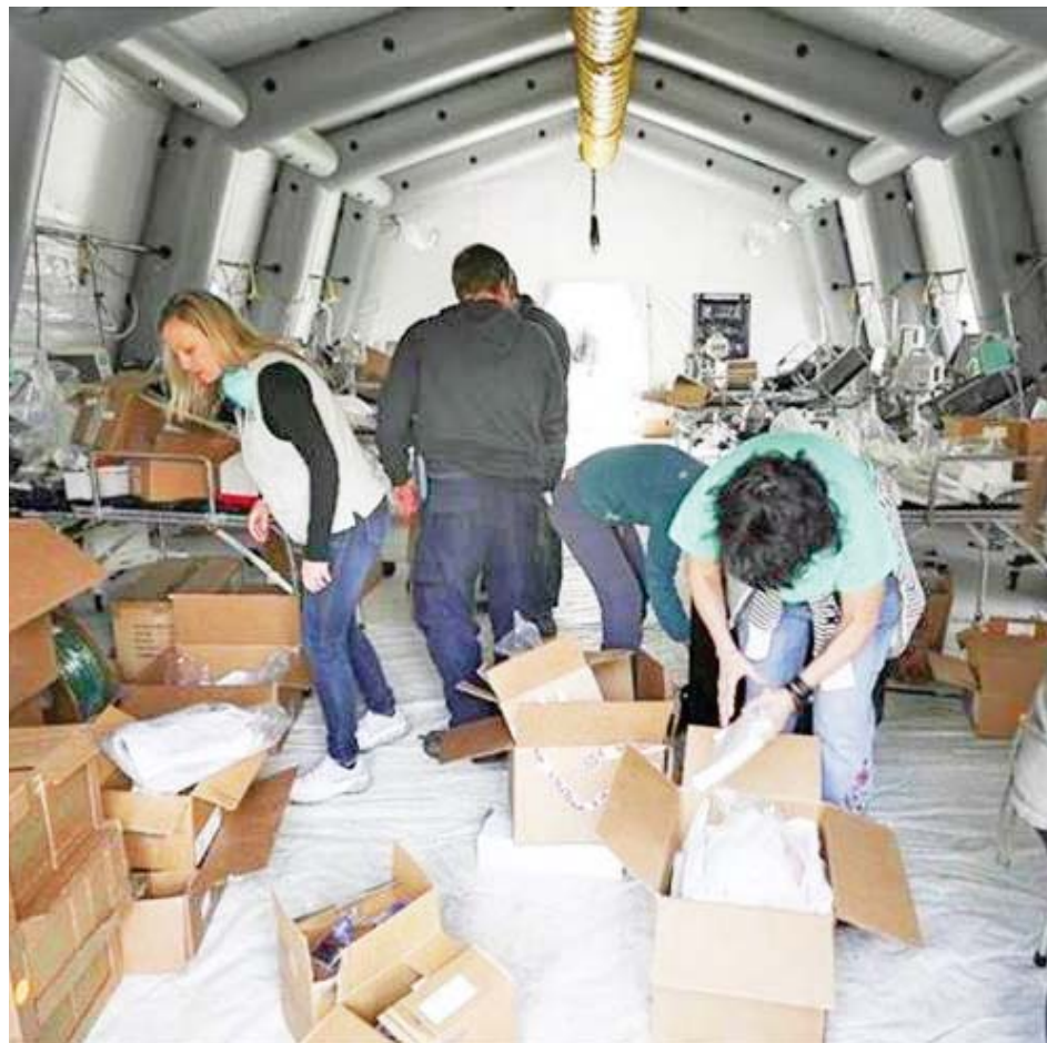
En EEUU el personal sanitario no cuenta con equipos de protección personal

El Gobierno de EEUU alerta de una severa escasez en suministros médi-