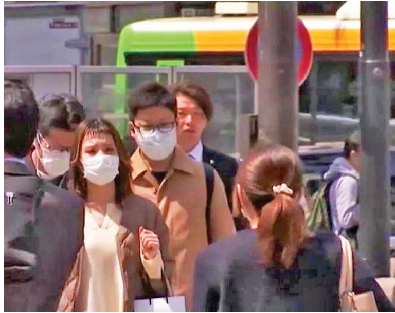
Japón donará a 20 países el medicamento Avigan

La gobernadora de la capital, Koike Yuriko, llamó a los ciudadanos a permanecer en sus hogares y aseguró que solo podrán salir para acudir a hospitales, comprar medicamentos y alimentos