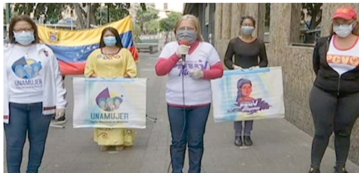
Mujeres de la patria expresan su pleno apoyo al presidente Nicolás Maduro