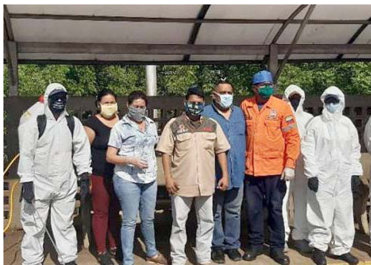
Continuarán la limpieza en comunidades que han sido priorizadas