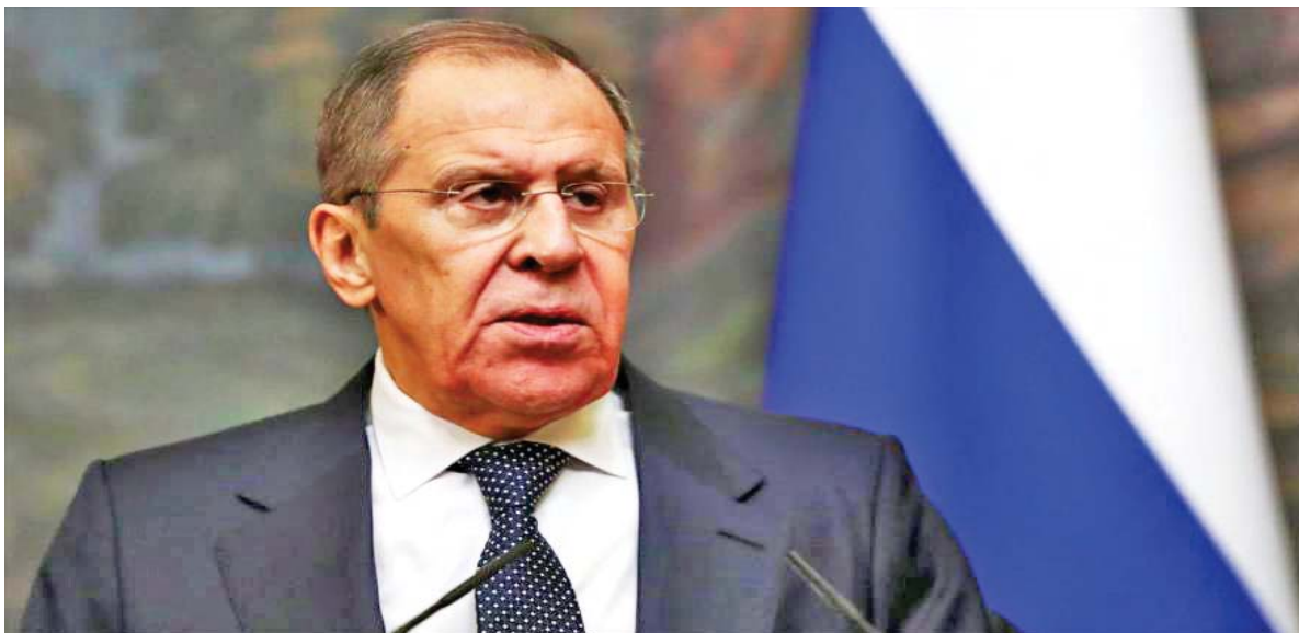
“EEUU impide que entre ayuda humanitaria a Cuba”

El ministro ruso de Asuntos Exteriores, Serguei Lavrov, condenó ayer el bloqueo de Estados Unidos contra Cuba y destacó la solidaridad de sus médicos antes y durante estos momentos en que la pandemia del nuevo coronavirus afecta a la humanidad.