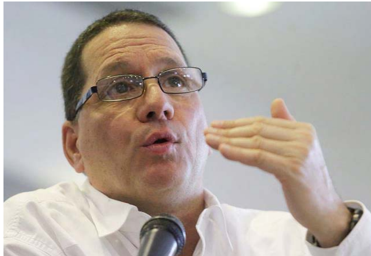
Mal manejo de Covid-19 pone al Gobierno de Trump en una posición incómoda

La situación en tiempos de pandemia revela que el mundo no puede ser dirigido ni administrado con políticas neoliberales, que impiden que el Estado, como gran ente de desarrollo y organización de la nación, esté en capacidad de sustentar social, económica, comunicacional y políticamente al pueblo, enfatizó