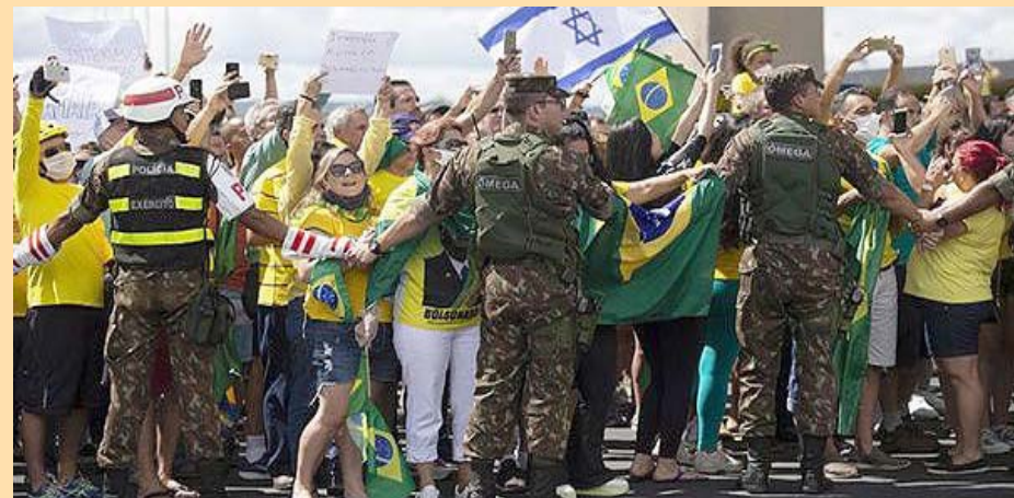
Gobernadores brasileños firmaron una carta en defensa de la democracia