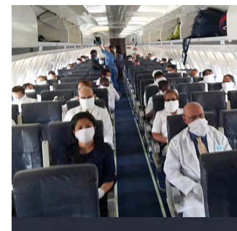
Veinte médicos forman la delegación médica cubana que llegó a Honduras

Junto a los cubanos viajaron 53 galenos de esa nacionalidad, que se incorporarán a la lucha contra el nuevo coronavirus.