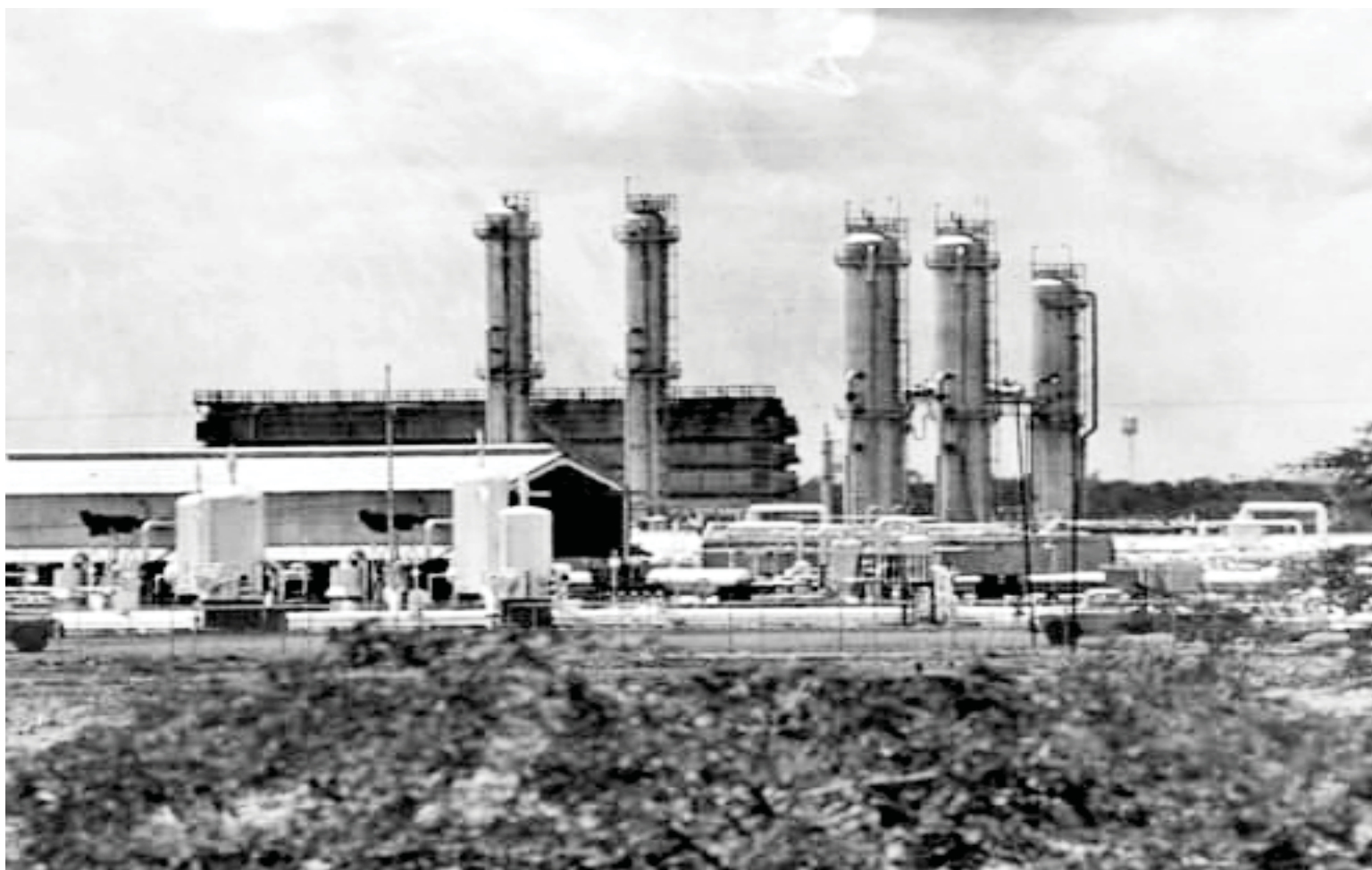
La CVP fue una idea de Juan Pablo Pérez Alfonso

La CVP fue una iniciativa de Juan Pablo Pérez Alfonso (1903-1979), quien dedicó su carrera política y pública a defender la tesis de que Venezuela debía tener