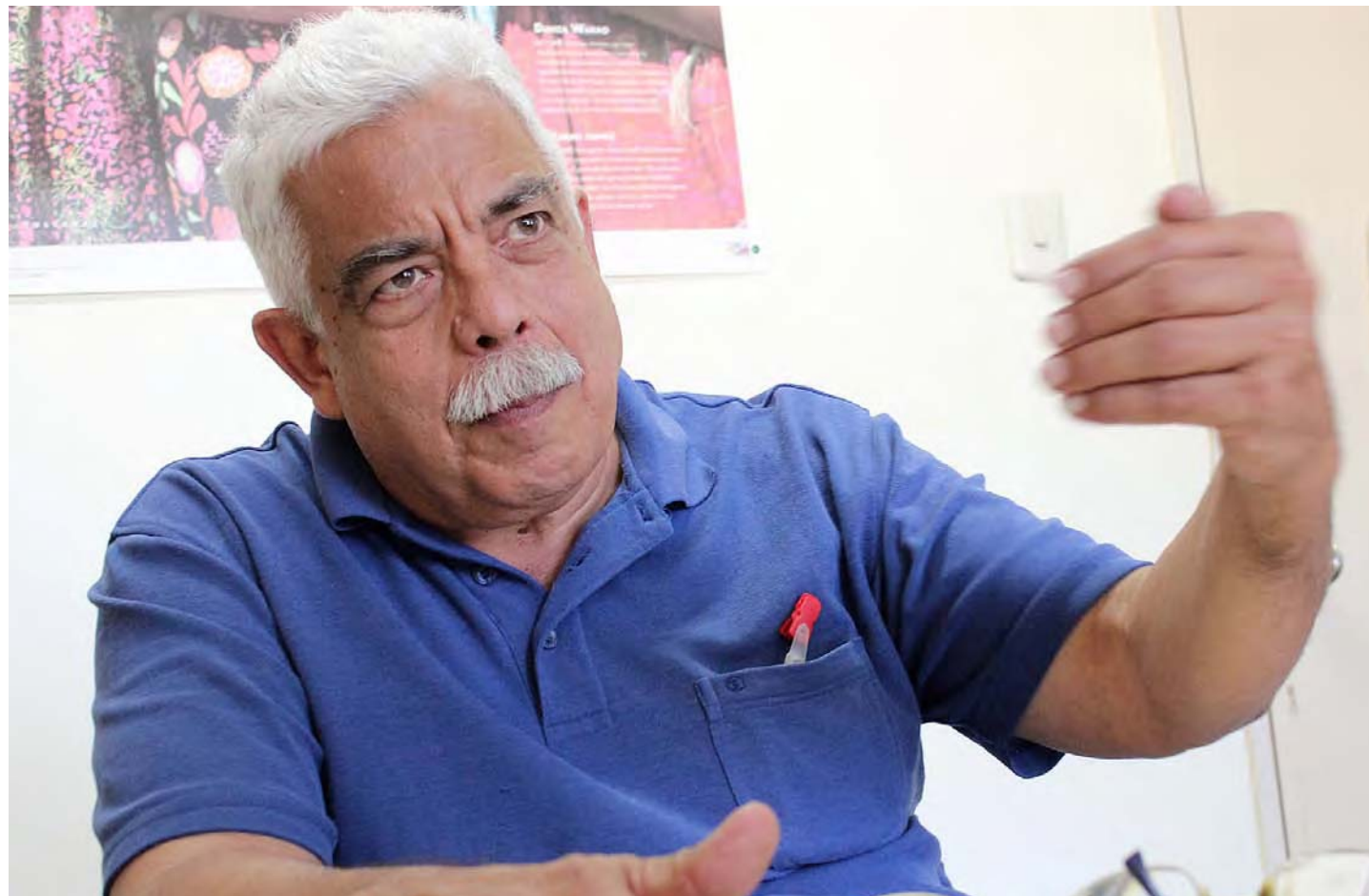
Estados Unidos ha sido destronado en el aspecto energético, asegura Paravisini

Este es el momento histórico para que nuestro país reoriente la economía para que sea autosustentable, sostuvo el constituyente