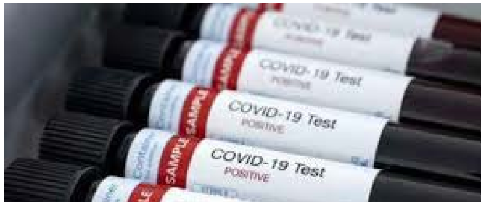
La OMS brinda apoyo técnico para implementar encuestas seroepidemiológicas

“Los primeros datos epidemiológicos señalan que no más de un 2 o 3% de la población ha sido infectada por coronavirus, incluso en las áreas con muchos casos”, dijo el secretario general de la Organización Mundial de la Salud, Tedros Adhanom Ghebreyesus