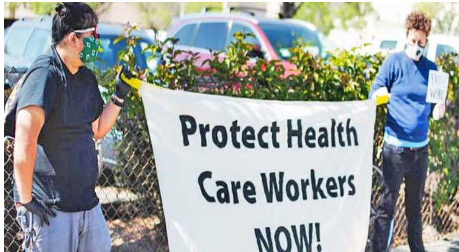
Los trabajadores sanitarios denuncian que están desprotegidos ante el virus

Respetando la medida de distanciamiento social, los trabajadores sanitarios leyeron los nombres de sus colegas fallecidos por el nuevo coronavirus y exigieron que la Adminis-