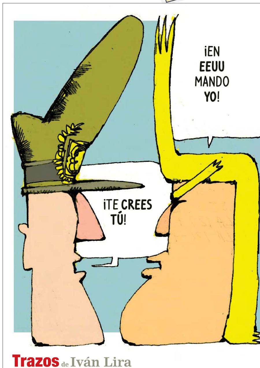
Trazos de Iván Lira