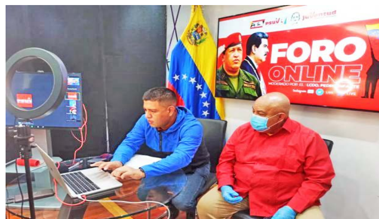
“Hugo Chávez enseñó al pueblo a organizarse”, expresó Vivas