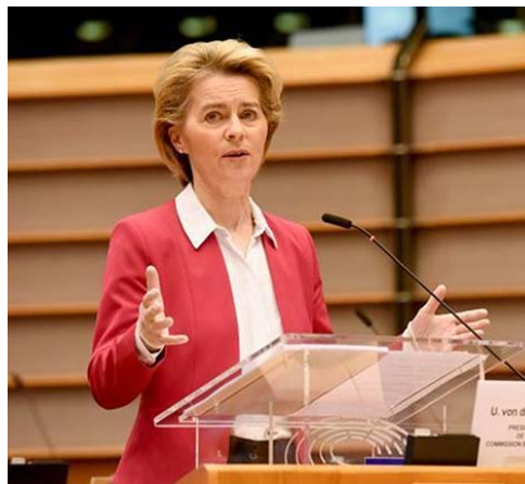
La OPS advierte sobre el riesgo que representa para Suramérica el coronavirus

Precisó que “dos de los tres países con el mayor número de casos reportados se encuentran ahora en las Américas”, dijo Etienne, refiriéndose a Estados Unidos y Brasil, países que registran 1.669.040 y 374.898 casos confirmados de coronavirus, respectivamente.