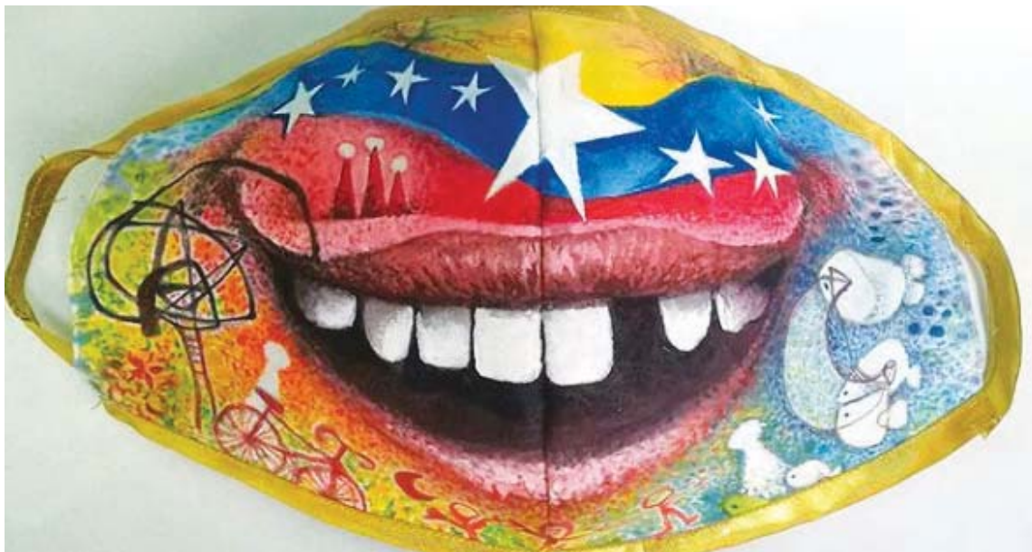
La pieza combina la alegría infantil con elementos alusivos a nuestra bandera

El certamen fue organizado por la FMN para celebrar el Día del Artista Nacional y los jueces fueron usuarios de las redes sociales