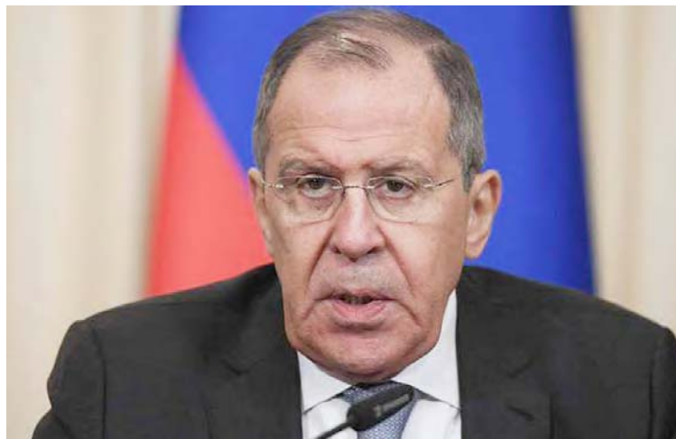
Rusia sostiene un intenso diálogo sobre estos temas con sus aliados, afirmó Serguéi Lavrov

Rusia estudia su respuesta a la retirada de Estados Unidos del Tratado de Cielos Abiertos, afirmó ayer el ministro ruso de Asuntos Exteriores, Serguéi Lavrov.