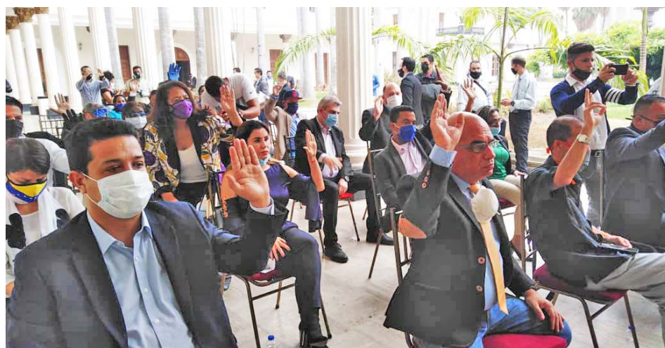
La AN debatió sobre materia electoral y la situación de Citgo

Por su parte, Francisco Torrealba, jefe de la fracción parlamentaria revolucionaria, en su cuenta de Twitter @torrealbaf manifestó que esperaban “obtener un acuerdo unánime para que desde el