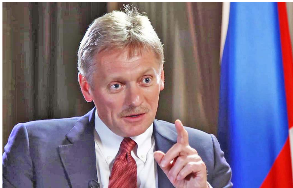
Dmitri Peskov señaló que este acuerdo tiene ciertas perspectivas

El funcionario ruso calificó como exitoso el convenio suscrito el 12 de abril para una nueva reducción de la producción petrolera con el objetivo de estabilizar el mercado