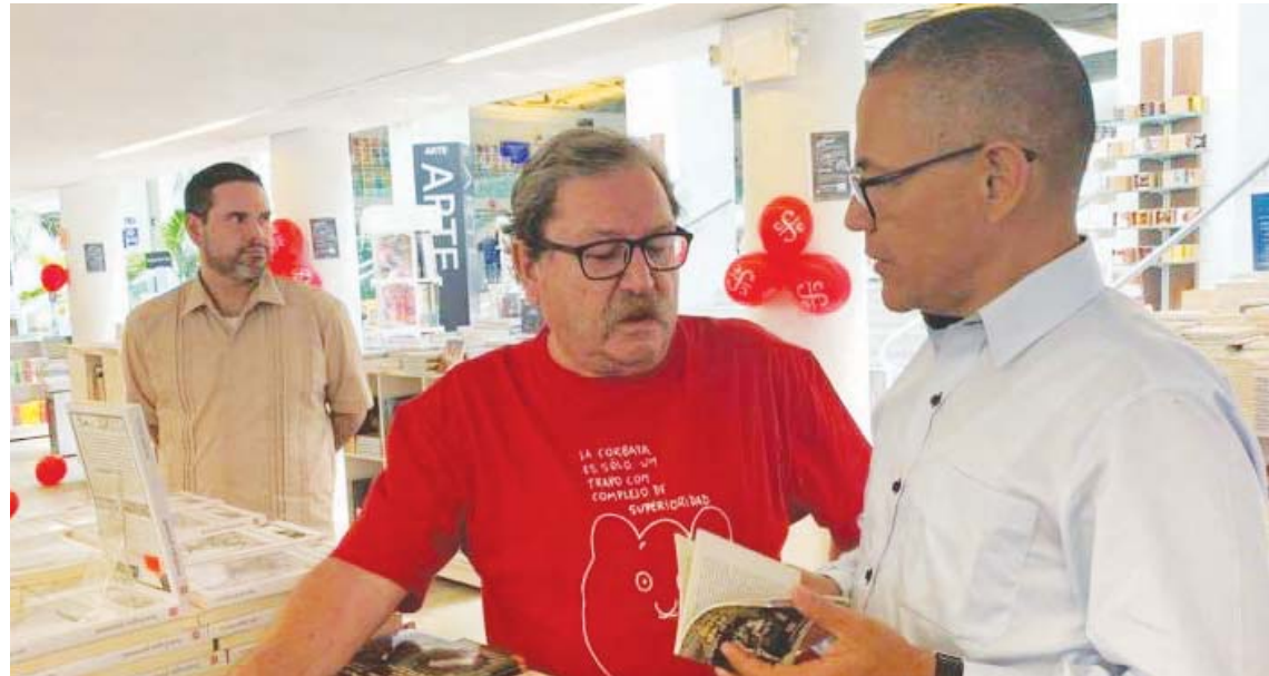
La actividad está programada para noviembre

Villegas, dice la nota, señaló que la confirmación de la participación de México en la fiesta literaria venezolana la citó Paco Ignacio Taibo II, presidente del Fondo de Cultura Económica,