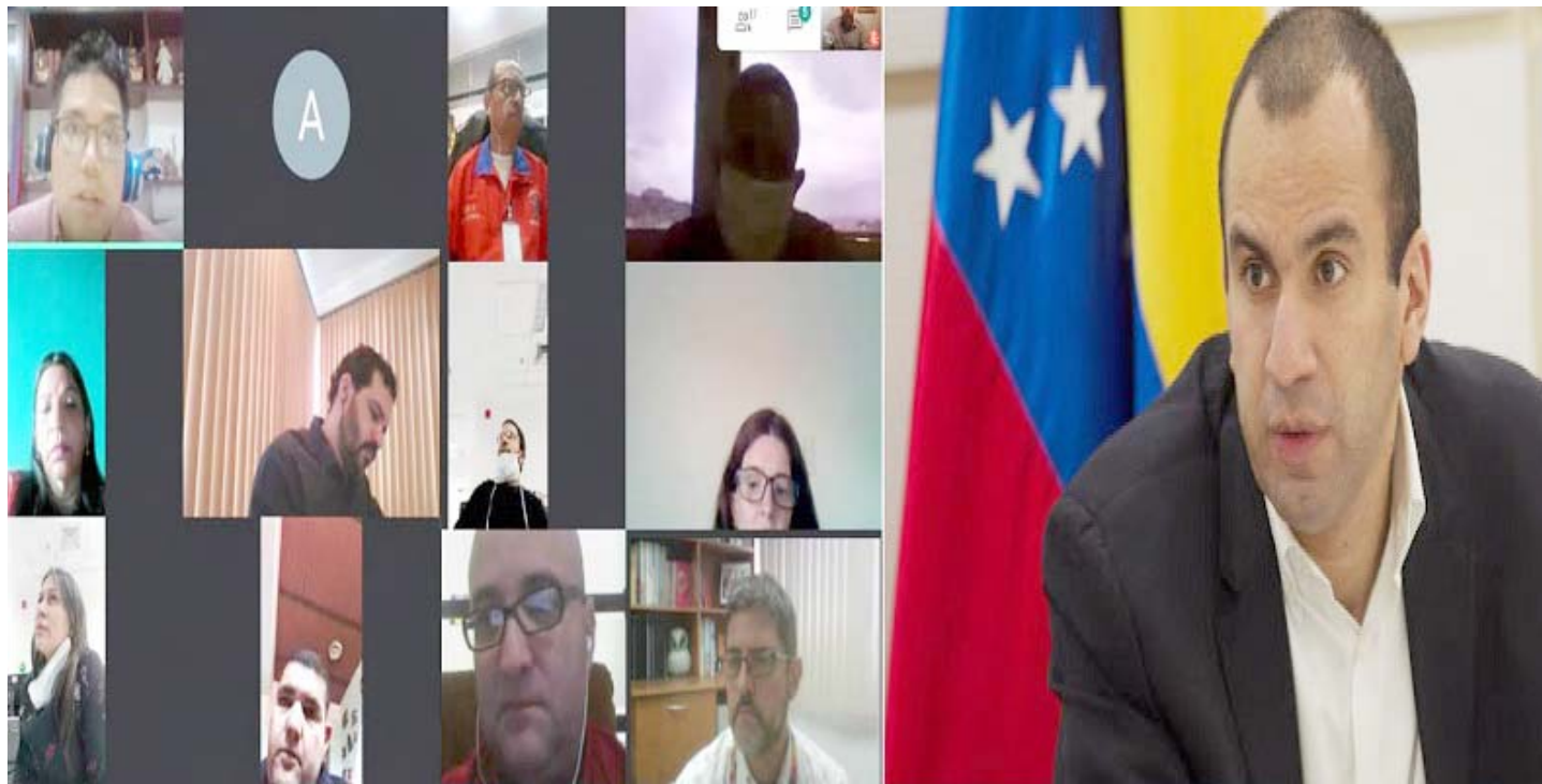
Venezuela explicó las medidas aplicadas para combatir a la Covid-19

En la videoconferencia de la Novena Reunión del Comité Interinstitucional encargado de hacer seguimiento a la cooperación de Venezuela y el órgano adscrito a la ONU, el representante nacional denunció el impacto negativo de las medidas coercitivas unilaterales impuestas por EEUU contra Venezuela