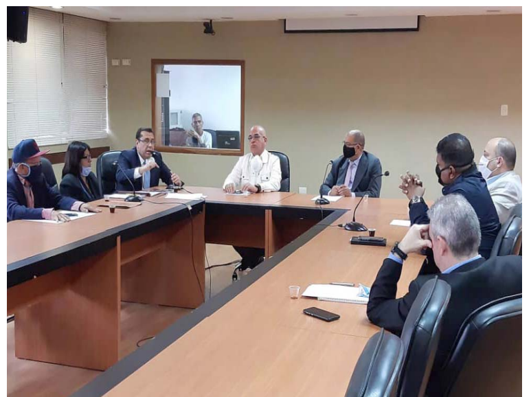
AN también investiga a Juan Guaidó por su contratación de mercenarios

Por otra parte, el Parlamento Nacional también instaló la Comisión de Desarrollo Social Integral, presidida por el diputado opositor José Aparicio, quien durante la reunión de trabajo exhortó a los diputados a reincorporarse a sus curules para discutir soluciones para las diversas situaciones que confronta el país.