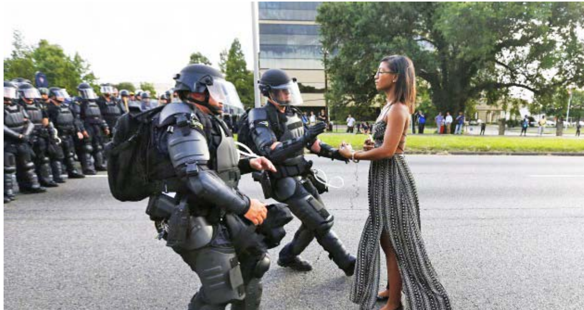
Solicitan implementar cambios urgentes en la policía y la justicia penal

Más de 20 relatores de Naciones Unidas mediante un comunicado condenaron los numerosos asesinatos de afroamericanos que evocan “un régimen de linchamientos”. En el documento denuncian que