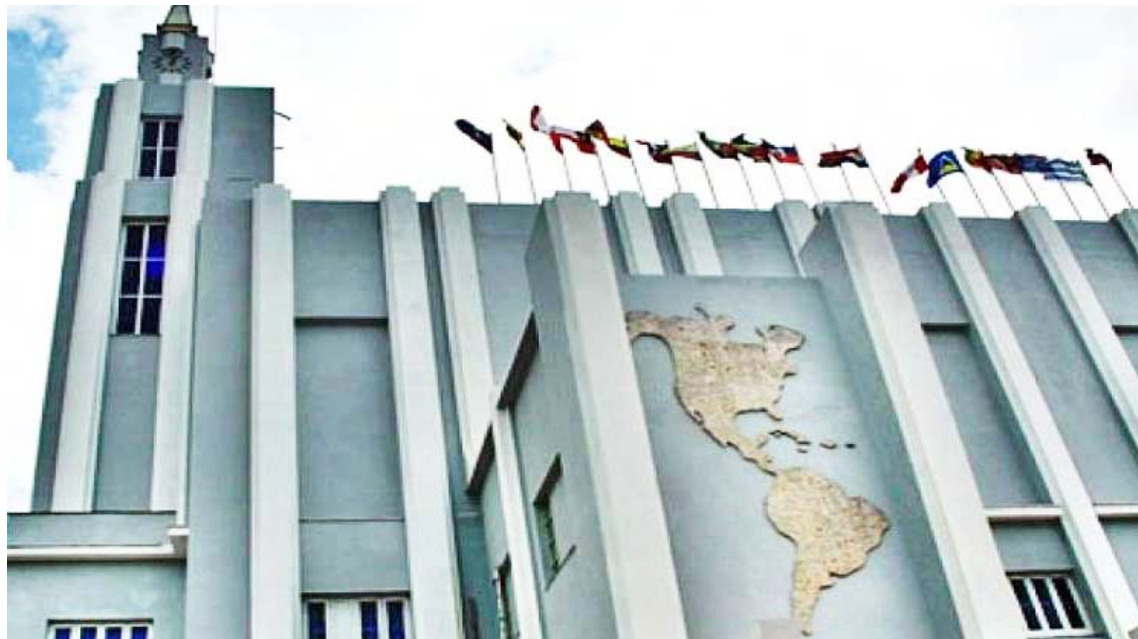
Los ganadores se anunciarán el 7 de mayo de 2021

Los trabajadores de la institución, que laboran a diario para mantener sus vínculos