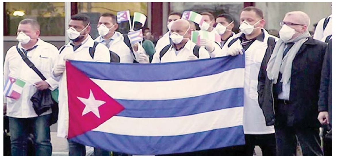
Varias organizaciones y personalidades consideran que las brigadas médicas cubanas merecen al Nobel de la Paz