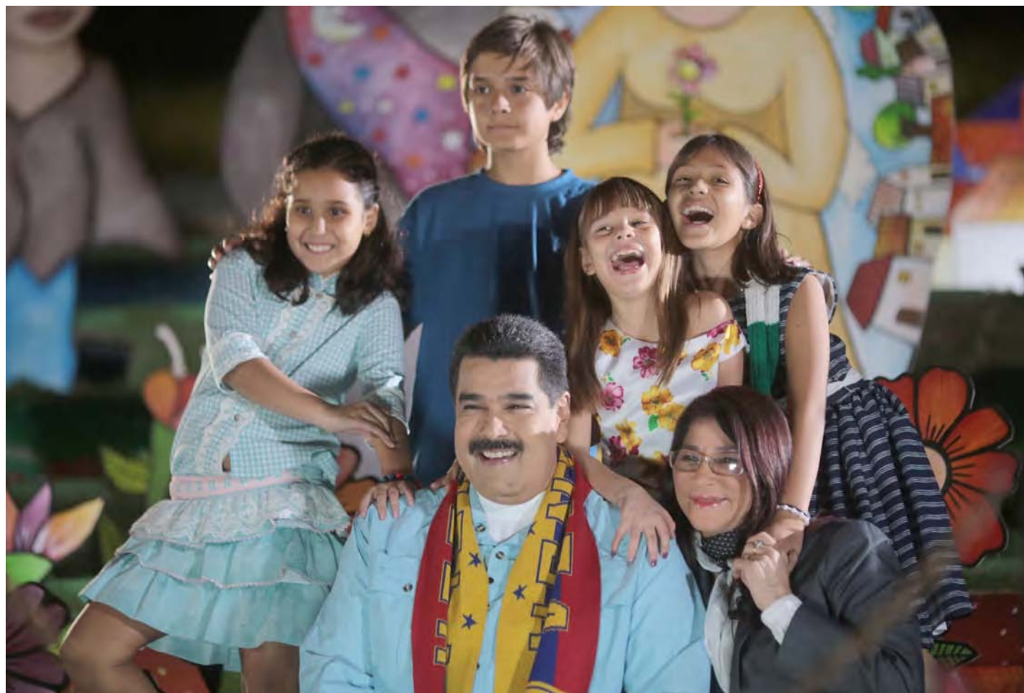
Agradeció la solidaridad internacional

“Venezuela cuenta con verdaderos amigos en el mundo. ¡No estamos solos! Y eso debemos reconocerlo”, detalló el Mandatario Nacional.