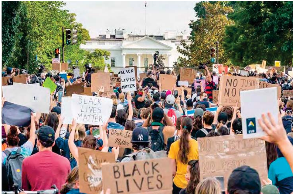
Aun cuando las personas protestaban en forma pacífica fueron agredidas por las fuerzas de seguridad

Las medidas represivas no fueron ordenadas por la Casa Blanca, sino por el fiscal general, William Barr, aseguró el portavoz durante una rueda de prensa