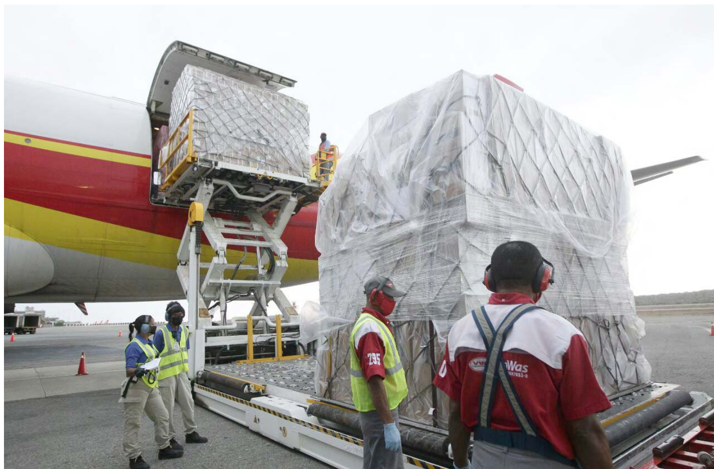
Presidente Maduro exaltó el valor de la familia

Destacó que gracias a la solidaridad de estas naciones, así como de la Organización Mundial de la Salud (OMS) y la Organización de Naciones Unidas (ONU), “llega a nuestro país la verdadera ayuda humanitaria para atender la salud del pueblo”.