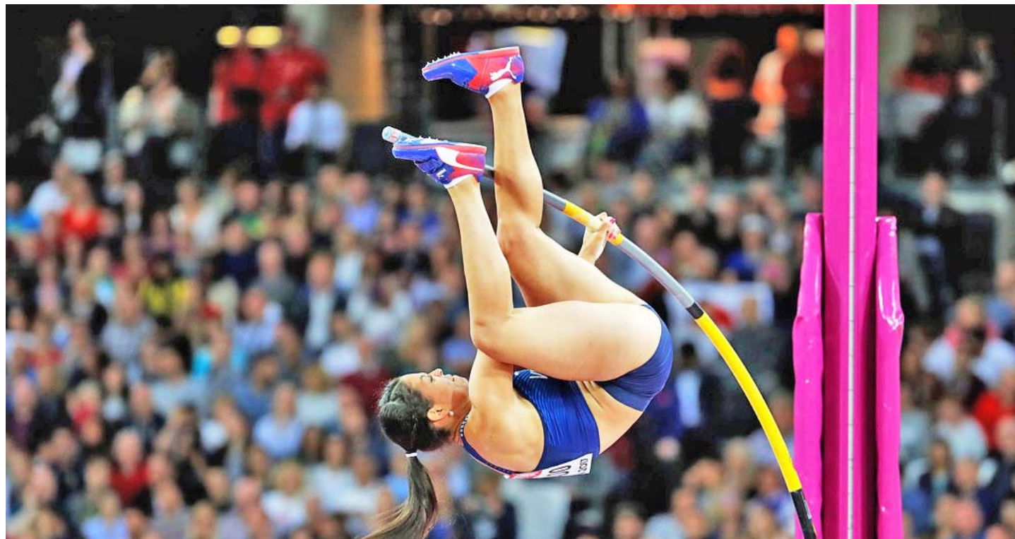
Representantes de los atletas participaron en las discusiones

1.- Control médico sistemático: cumplir con las normas preventivas, hacer de despistajes seriados, brindar atención médica y nutricional al atleta, apoyo psicológico vía online, recibir a los atletas en aeropuertos y terminales, dar aseso-