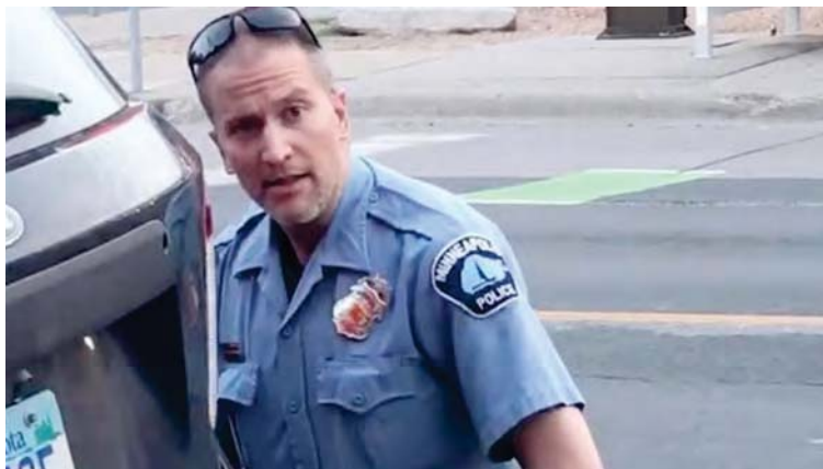
El policía Derek Chauvin, es procesado por asesinato en segundo grado