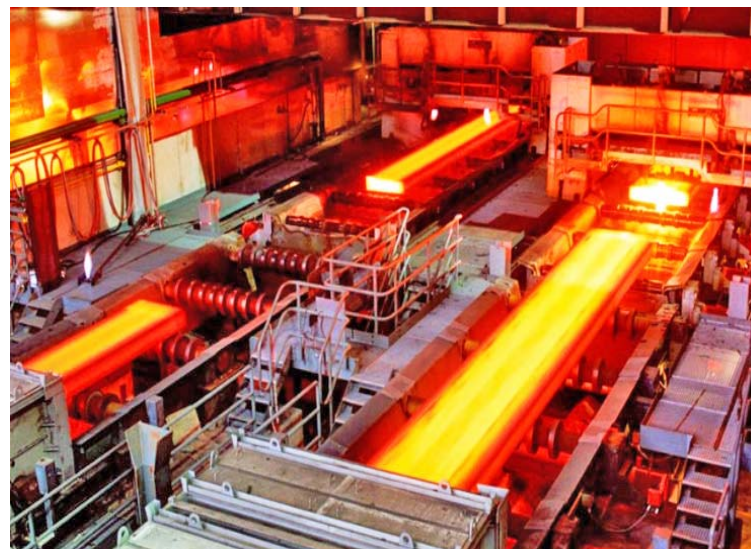
Sidor trabaja con todo en esta época de crisis

En una nota de prensa del Ministerio de Industrias y Producción Nacional, se destaca que también se reactivó el horno de recalentamiento de palanquillas y bastidores para la laminación de alambón, como parte del Plan de Recuperación Productiva de la Corporación Venezolana de Guayana (CVG).