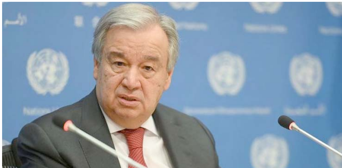
António Guterres afirmó que la ONU tiene un orgulloso historial de lucha antirracista

El secretario general de la Organización de las Naciones Unidas (ONU), António Guterres, ratificó que el racismo viola la Carta de las Naciones Unidas y menoscaba valores fundamentales, refiere Prensa Latina .