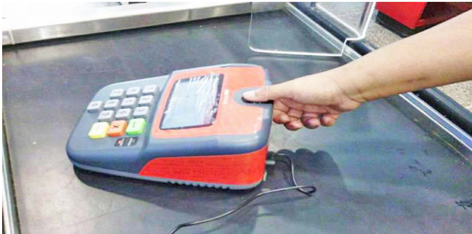
El biopago es una gran alternativa para consumidores y comerciantes

El sistema de pago móvil Interbancario (P2P), que permite hacer pagos de bienes y servicios desde el teléfono celular, durante el mes de mayo registró un promedio de 38 millones de operaciones, con un incremen-