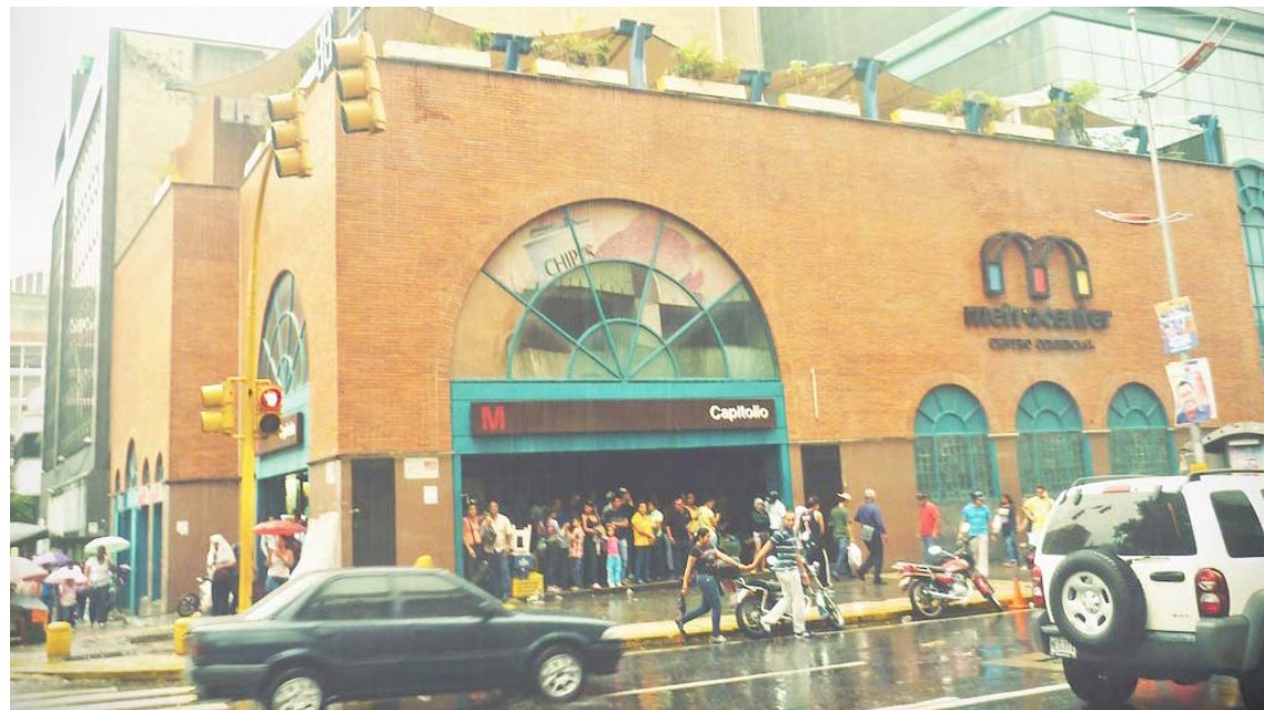
Los grandes enjambres del comercio deben cumplir con lo ordenado

En este sentido, la titular de Comercio Nacional aprovechó