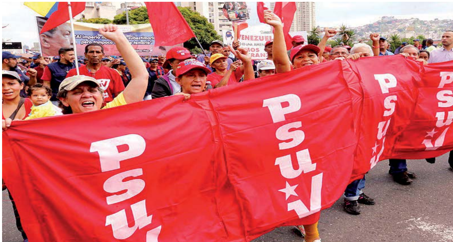
“Hay elegir a una nueva Asamblea Nacional al servicio de las mayorías”, expresó Maduro

Y agregó: “Tenemos una batalla electoral con todas las medidas y protocolos de seguridad por la pandemia del coronavirus. Venezuela se dirige a un proceso electoral obligatorio, mandado por esta Constitución,