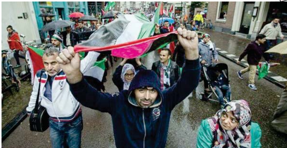
En Palestina consideran que los próximos días serán decisivos para afrontar el plan de anexión

“No sufriremos solos”, advierte Al-Fatah