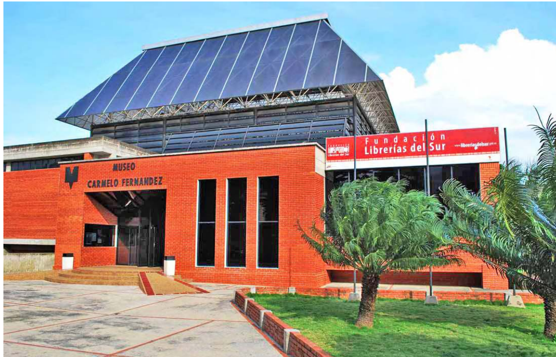
Los museos en Venezuela siguen activos vía online durante la cuarentena