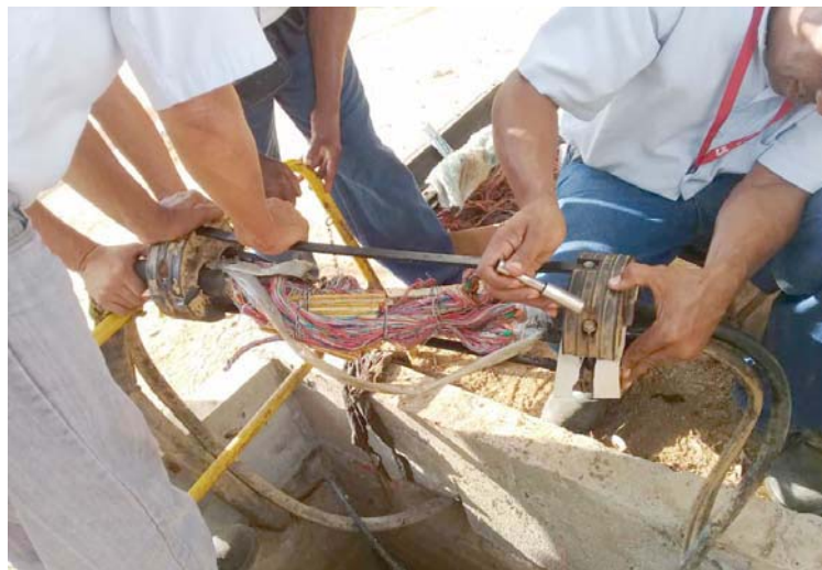
Cantv intenta mejorar los servicios

T/ Redacción CO F/ Cortesía Cantv Caracas