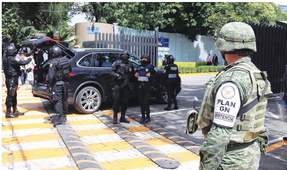
Sujetos con armas largas dispararon al vehículo en el que se desplazaba el secretario de seguridad, quien resultó herido

T/ Redacción CO-HispanTV