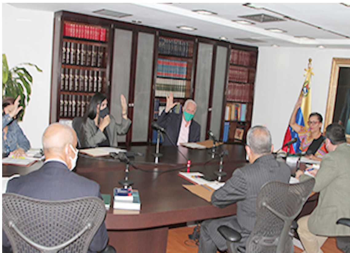
Poder Electoral inicia su preparación para los comicios parlamentarios

En nota de prensa del órgano electoral se señala que la decisión del cuerpo colegiado del CNE se ajusta a lo establecido en el artículo número 7 de las normas sobre el régimen de sesiones y deliberaciones del organismo comicial, y a lo dispuesto en la sentencia 068, de fecha 5 de junio de 2020, dictada por la Sala Constitucional del Tribunal de Supremo de Justicia (TSJ), en la cual se