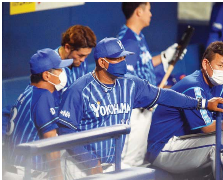
Ramírez también cumple con las medidas sanitarias

Quiere ganar el cetro, pero primero hay rivales a vencer: “El de este año, como casi todos los años, serán los Hanshin Tigers, que es un equipo al que no le hemos podido ganar en los últimos cuatro años. Ellos están mentalmente preparados para vencernos y tenemos esa espinita. Va a ser un reto este año y si jugamos por encima de .500 contra ellos podríamos estar cerca de ganar el título de la Liga Central, porque contra los otros equipos tenemos buen récord. Claro, Hiroshima Carp y Yomiuri Giants son otros equipos