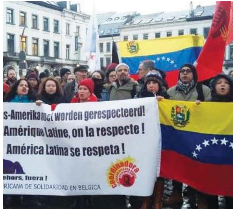
“Hasta que no estemos todos a salvo, nadie está a salvo”

“Observamos que una amplia gama de voces a nivel internacional –incluyendo Su Santidad, Francisco I, además del secretario general de la ONU, el Movimiento de Países No Alineados (Mnoal), ALBA-TCP-Unasur, António Guterres, la Unión Europea (Josep Borrell, ministro de Relaciones Exteriores de la Unión Europea ha llamado a esto públicamente tres veces), senadores de Estados Unidos, numerosos gobiernos de América Latina y el Caribe, el Caricom, la Comisión Económica para América Latina y el Caribe (Cepal), la Confederación Sindical de trabajadores y trabajadoras de las Américas (CSA) y la Confederación Sindi-