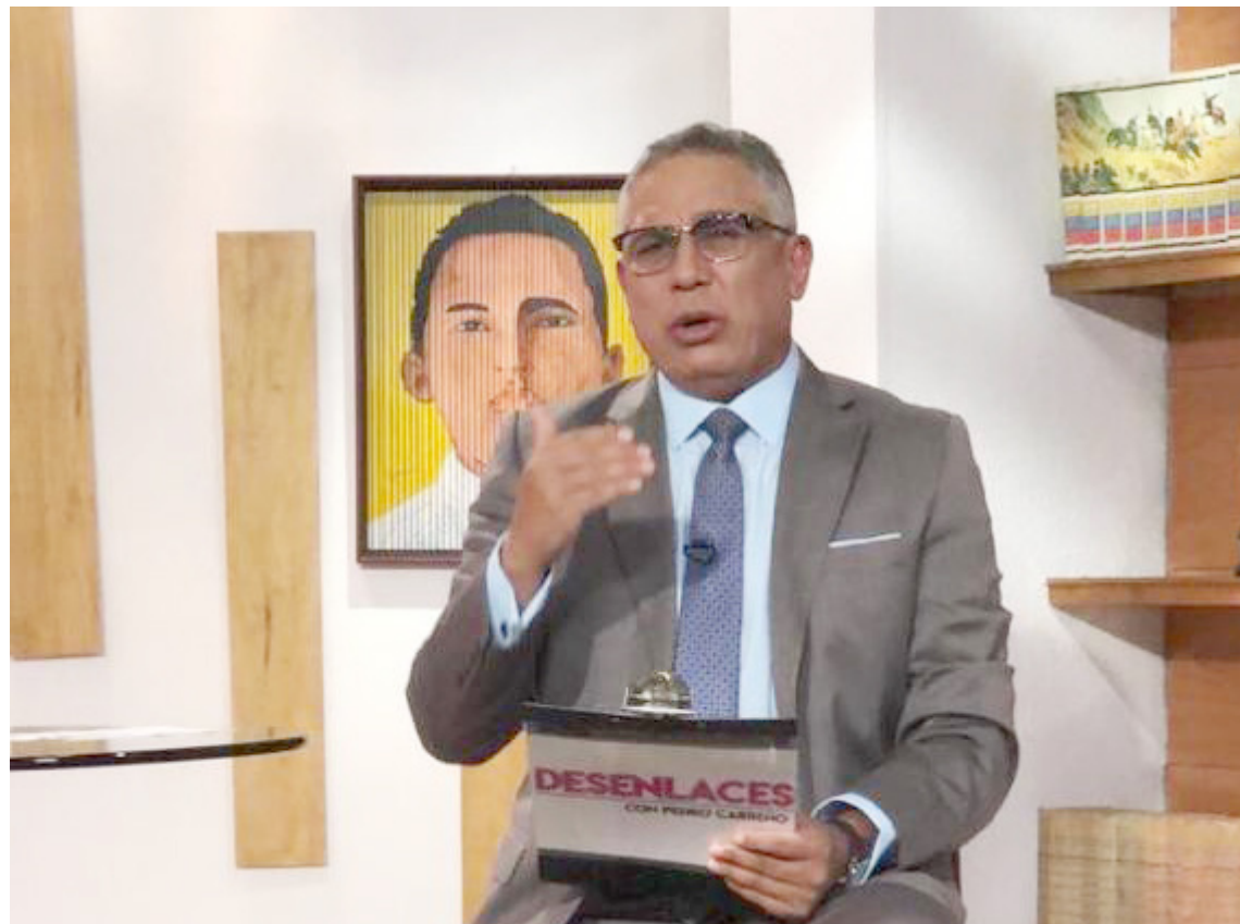
Todas las tarjetas nacionales y regionales estarán habilitadas cuando lo determine el CNE, aseguró Carreño

Aseveró que ante las acusaciones de la oposición es necesario dejar claro que “todas las tarjetas nacionales y regionales