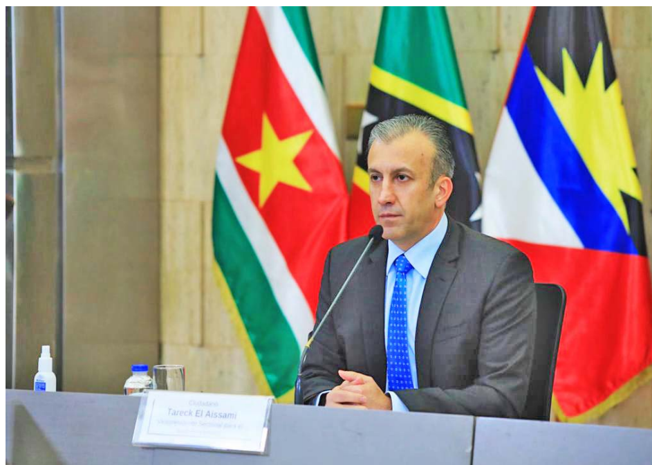
La industria petrolera mundial no se duerme

En declaraciones transmitidas por Venezolana de Televisión, El Aissami señaló que están sentando las bases del nuevo comienzo post-Covid-19 que permita la construcción de una economía productiva real y concreta, que favorezca a los pueblos más afectados por la situación sanitaria actual, por lo que Venezuela avanza hacia una