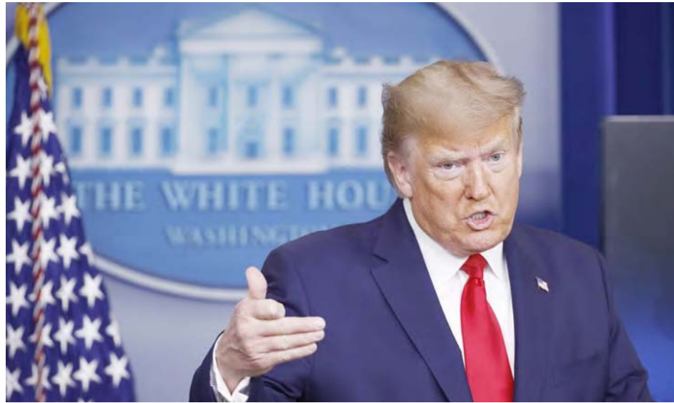
Por los delitos de asesinato y terrorismo Irán solicitó a Interpol arrestar al presidente Donald Trump

T/ Redacción CO-AVN