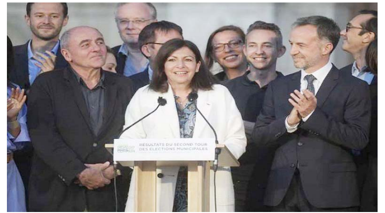
El triunfo de los ecologistas representa la llegada de la ola verde a Francia

Por su parte, el 20 de junio el Senado de Colombia aprobó por unanimidad la cadena perpetua para los violadores de niños, medida que ha sido aplaudida por varios sectores del país debido a las constantes denuncias que se hacen en la nación neogranadina en referencia a este crimen.