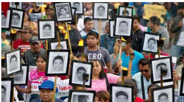
El detenido es integrante del cartel Guerreros Unidos

T/ AVN