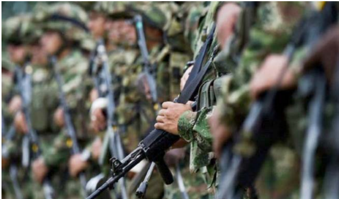
Los militares y el Ejército sabían del caso y la Fiscalía de Guaviare no hizo las investigaciones.

El hecho contra la menor, de la comunidad Nukak Makú, y quien presuntamente fue secuestrada y abusada sexualmente, ocurrió en septiembre de 2019, y según el periodista Ariel Ávila se trata de un caso de esclavitud sexual, dado el relato de la niña