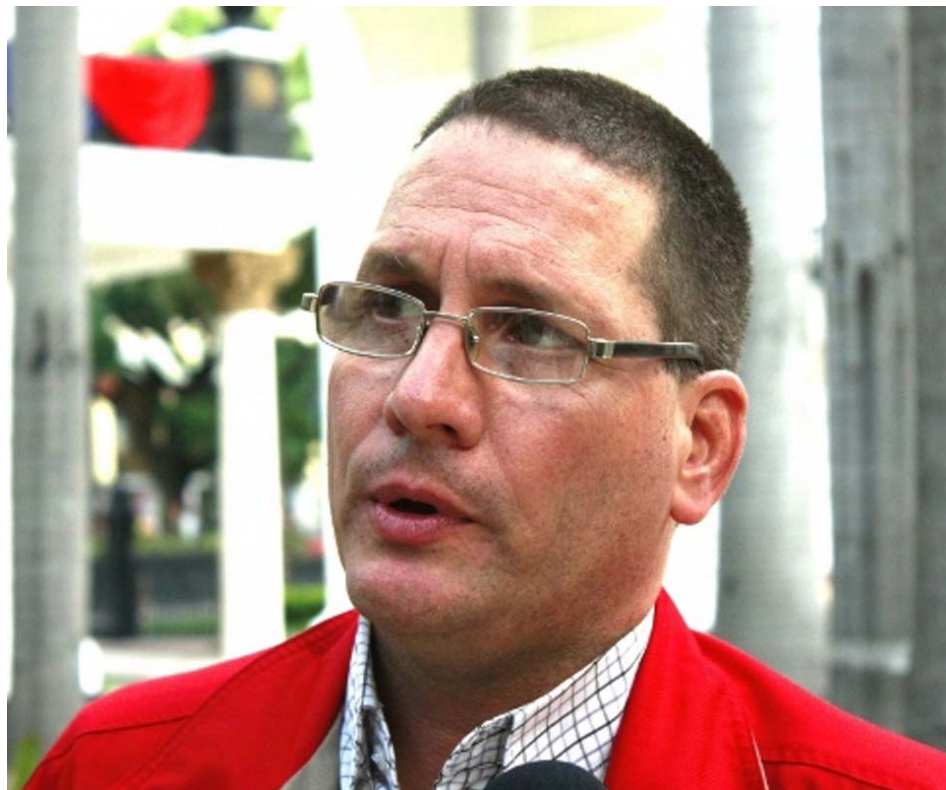
Había una distorsión en la política de subsidios de la gasolina, expresó Faría

Aseveró que los más beneficiados con el asunto de la gasolina eran los de mayores ingresos, y por esa razón había una distorsión en la política de subsidios.