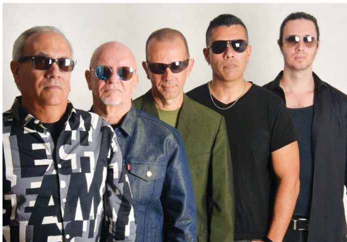
El audiovisual ya se puede ver en las redes sociales

La grabación y producción del videoclip, se realizó en los estudios de La Discoteca, estudios en los que Aditus grabó “Posición adelantada” en 1983. La gente del grupo considera que este es un canto nostálgico