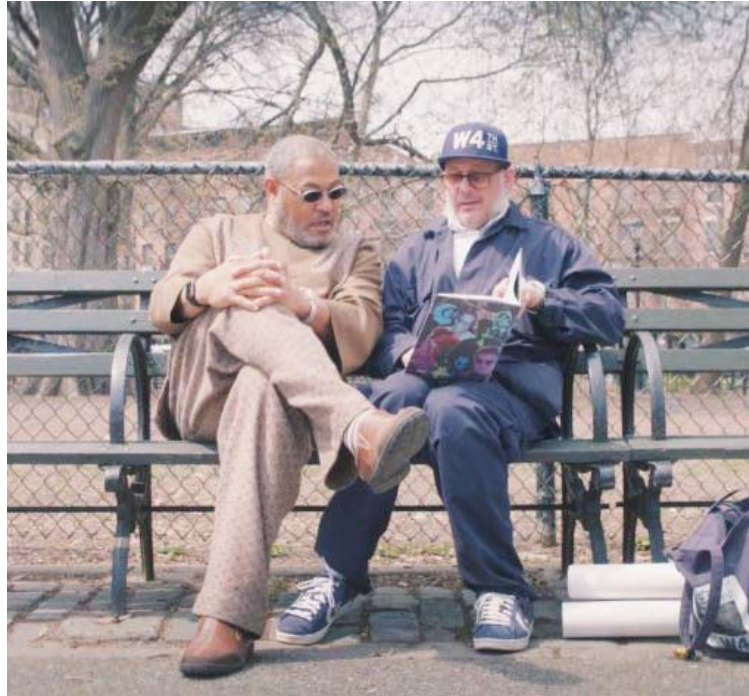
El documental Ricky Powell: The Individualis es uno de los trabajos presentados

Proyecciones de largometrajes, cortometrajes, documentales, música, monólogos