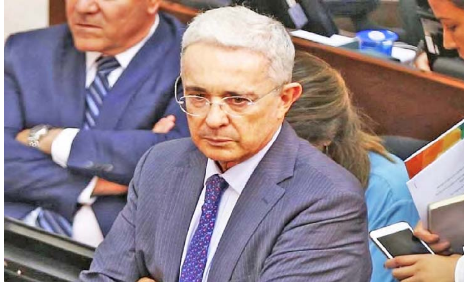
Álvaro Uribe tiene dos investigaciones en su contra por el escándalo de espionaje

El proceso de investigación tiene como base un escrito anónimo, que ya ha dado