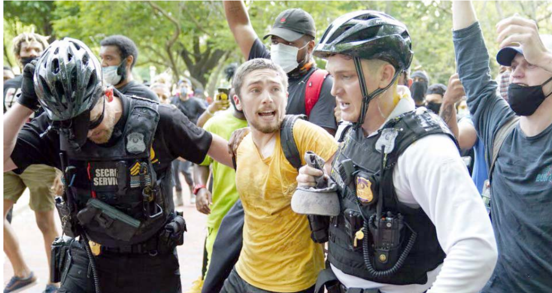
El organismo insta a los sectores democráticos a trabajar a favor de la justicia y contra el racismo

Mediante un comunicado difundido en su portal web, el Grupo de Puebla señala: “Este tipo de acciones recuerdan los oscuros tiempos de las dictaduras y autocracias en nuestro hemisferio, que atentan contra los valores de la comunidad internacional”.