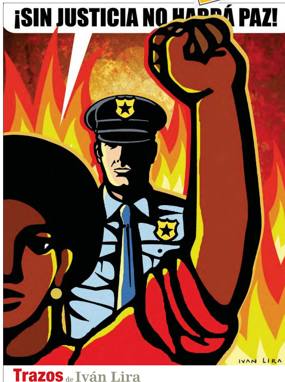
Trazos de Iván Lira