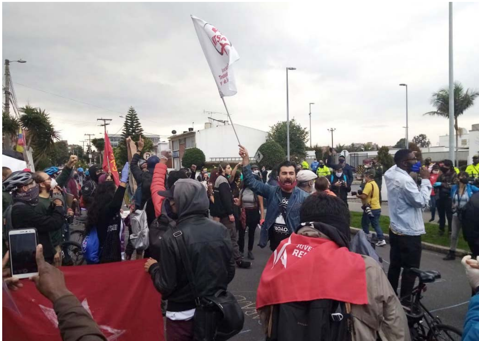
Ciento de manifestantes protestaron frente a la Embajada de EEUU en Colombia por la llegada de militares gringos

Estas acciones son rechazadas por el pueblo y las organizaciones populares de Colombia.