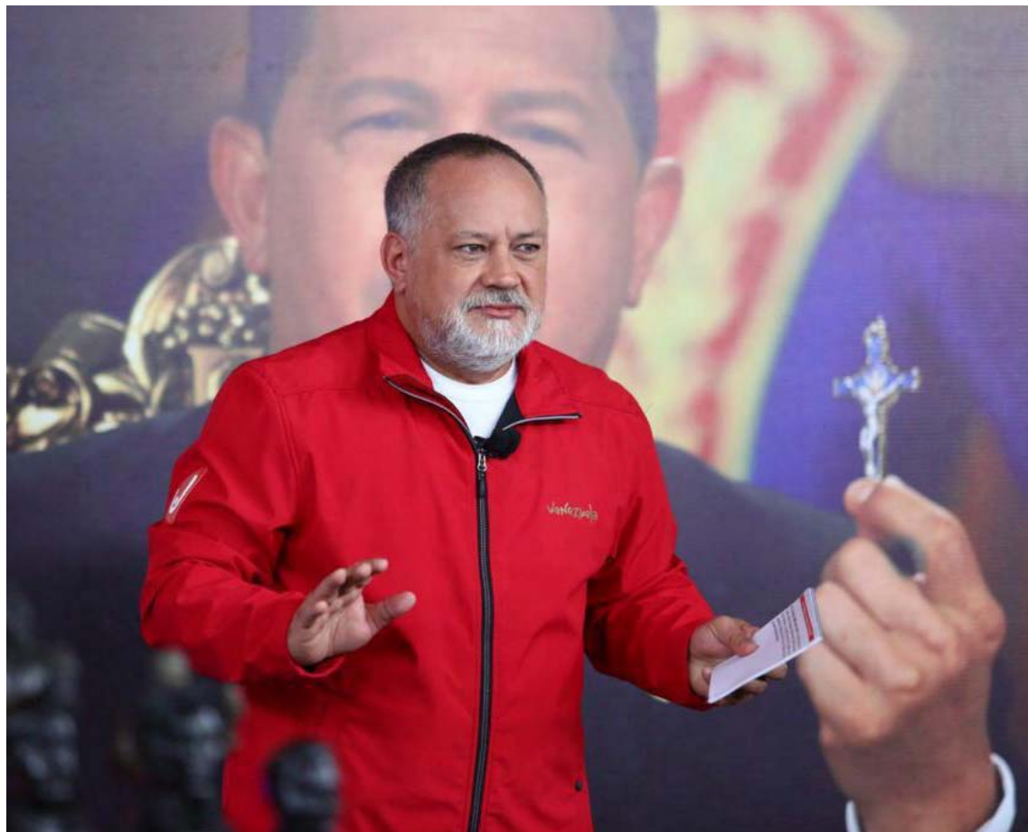
Hugo Chávez terminó con la discriminación y las persecuciones en Venezuela, enfatizó Cabello

Sostuvo que en Venezuela la Revolución Bolivariana terminó con la discriminación y las persecuciones, “las acabó Hugo Chávez. Pueden decir lo que quieran los detractores, los habladores de paja, pero fue