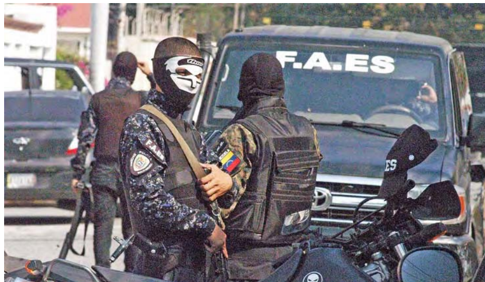
Los cuerpos de seguridad no pueden andar por ahí como gatillos alegres

Para adelantar las investigaciones se comisionó a los fiscales 49º nacional con competencia plena y 81º del Área Metro-