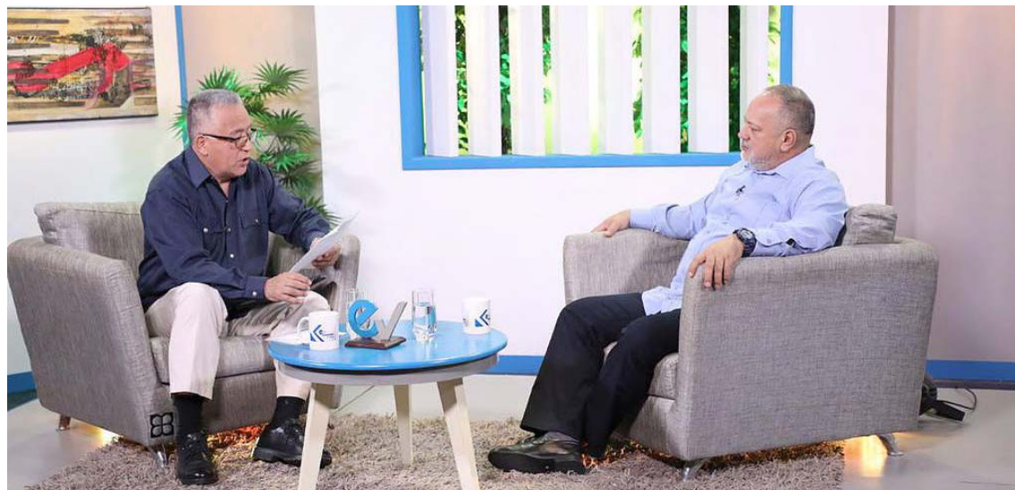
El sistema capitalista no entiende de solidaridad, afirmó Cabello

Indicó a los jóvenes del PSUV que los grupos le hacen un intenso daño a la Revolución y por eso no deben permitirse actuar así. “Esos grupos le