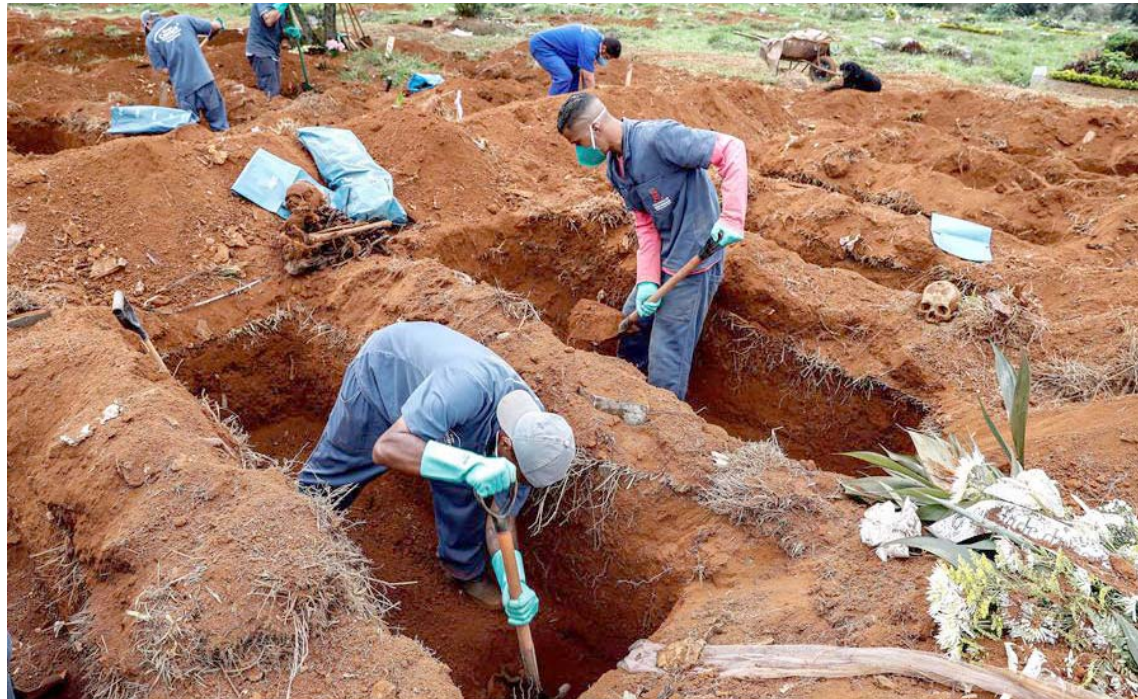
El segundo país más afectado es Perú, le sigue México, Chile y Ecuador.

Brasil superó a Reino Unido como el segundo país del mundo con más víctimas mortales por la Covid-19 y desde hace dos semanas ocupa el segundo lugar en cantidad de contagios,