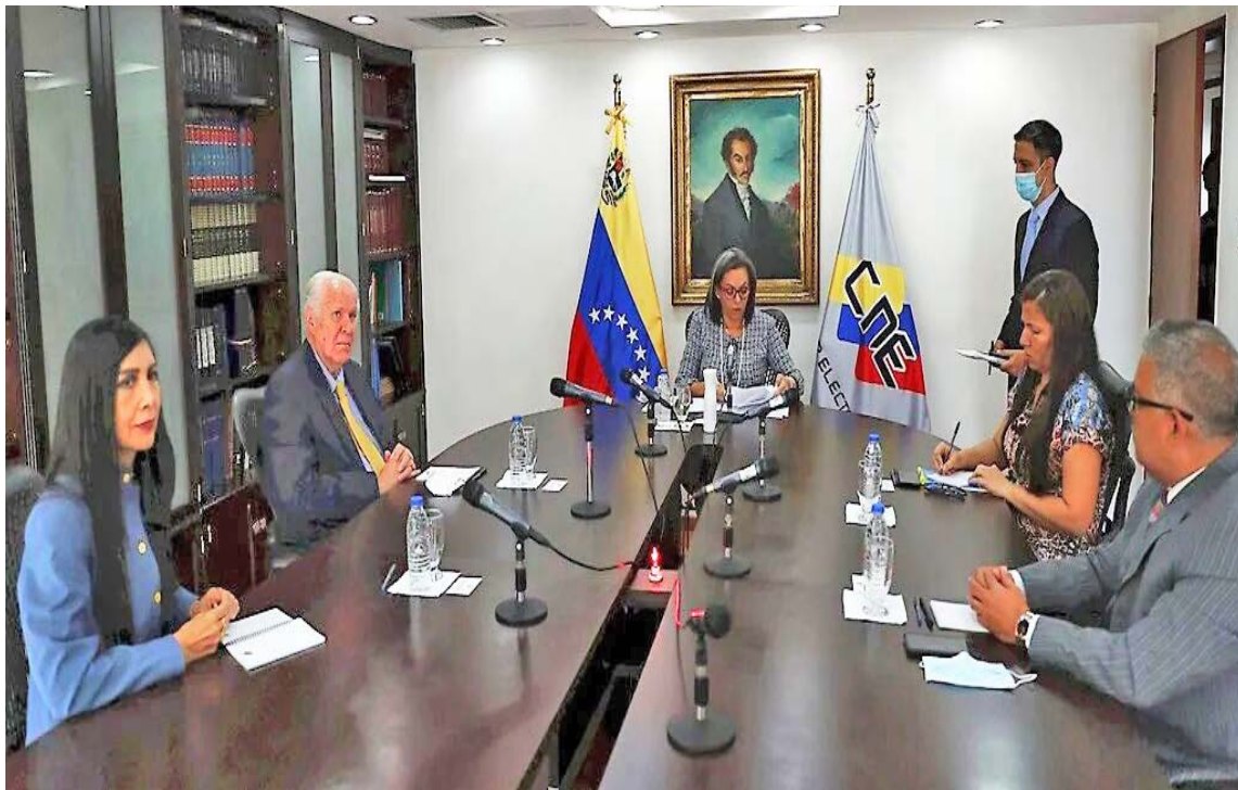
Primera reunión de trabajo de las nuevas autoridades del CNE

La Sala Constitucional del TSJ designó a la nueva directiva del organismo electoral