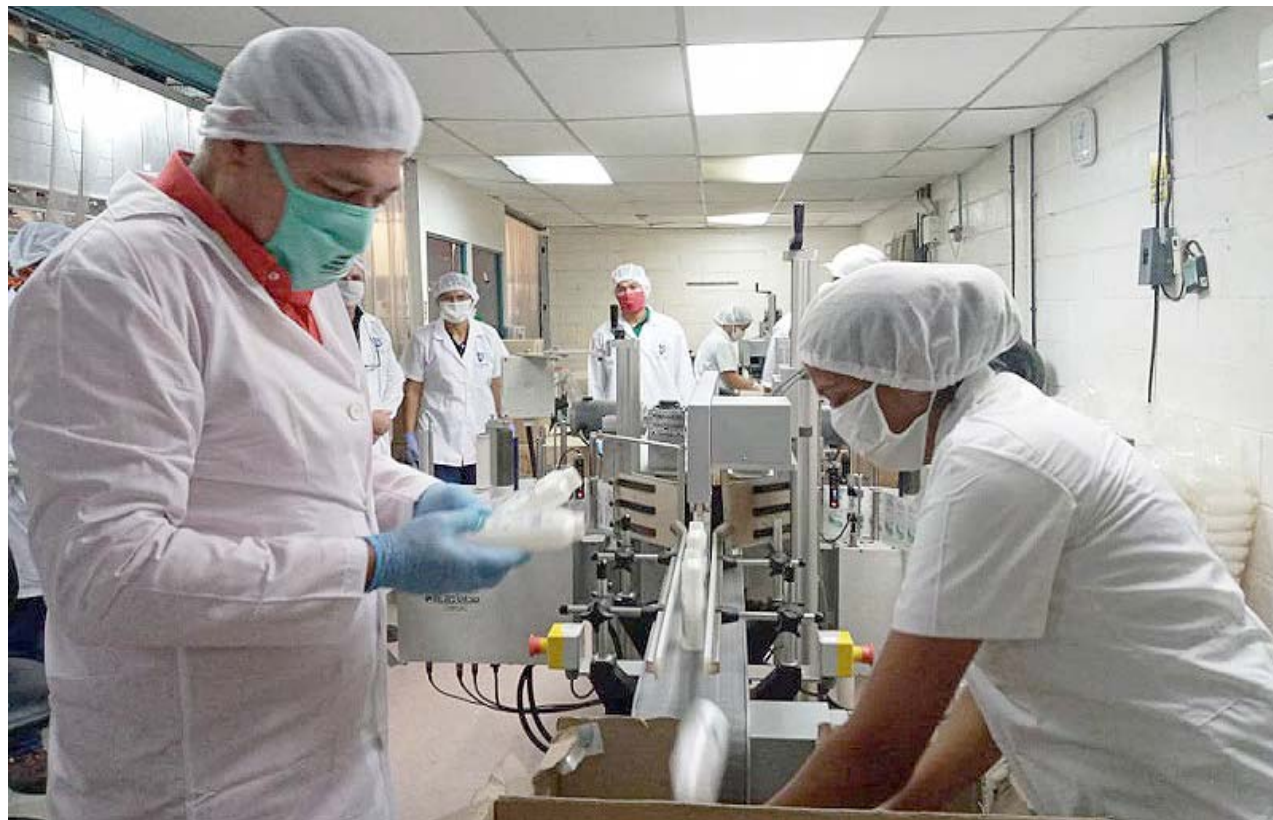
Nuevos sectores productivos se han incorporado con éxito al programa 7+7

Señaló que los trabajadores se han adaptado al proceso de flexibilización 7+7 con el cumplimiento riguroso de los horarios y los protocolos de bioseguridad establecidos