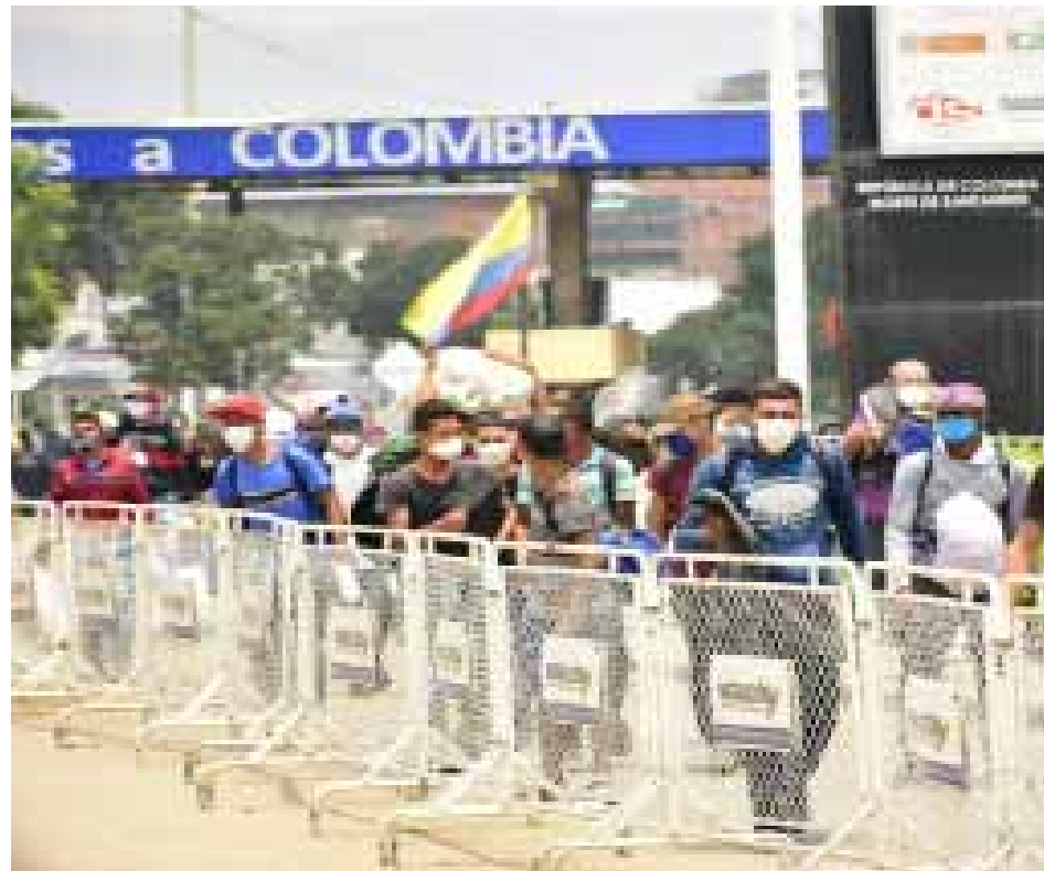
La mayoría de casos de Covid-19 vienen del exterior

Nuestros enemigos más visibles están bien identificados. Uno es el verdadero dueño del circo, el gobierno de Trump, y