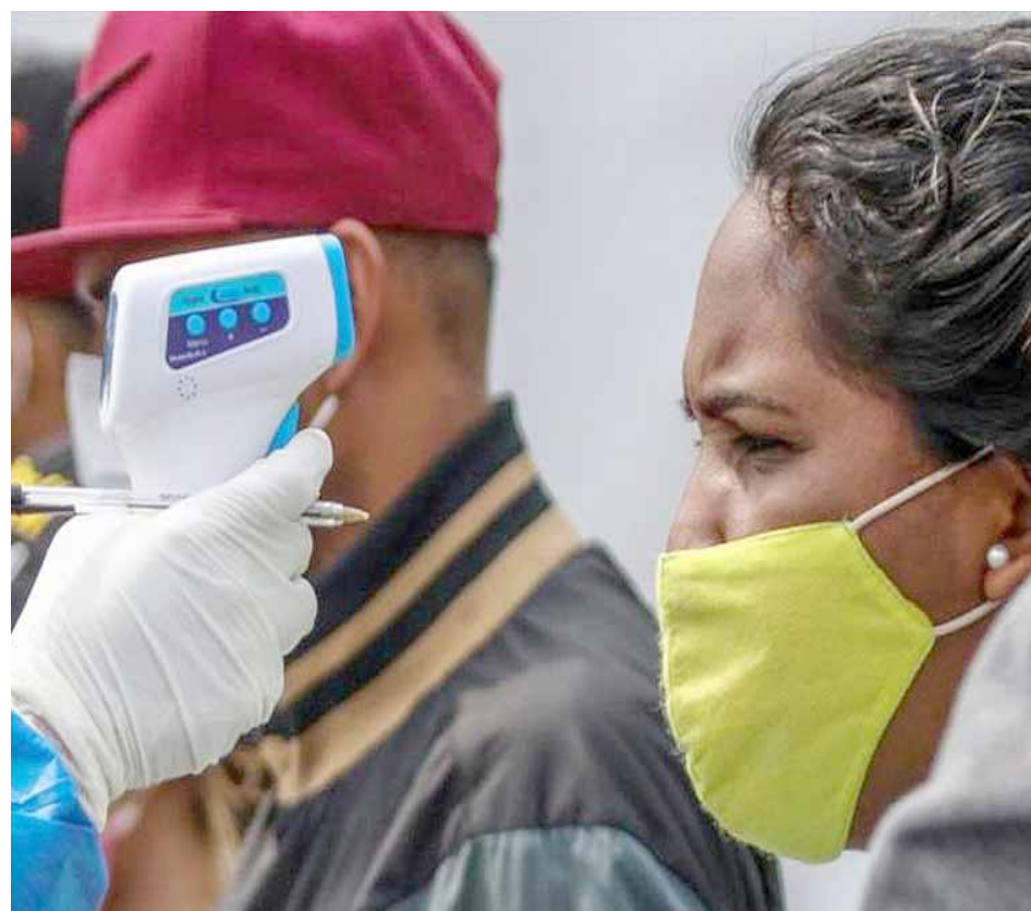
En Venezuela se ha mantenido baja la letalidad por Covid-19

el otro, el que ha prestado su territorio para armar la agresión contra nuestro país, el gobierno de Iván Duque.