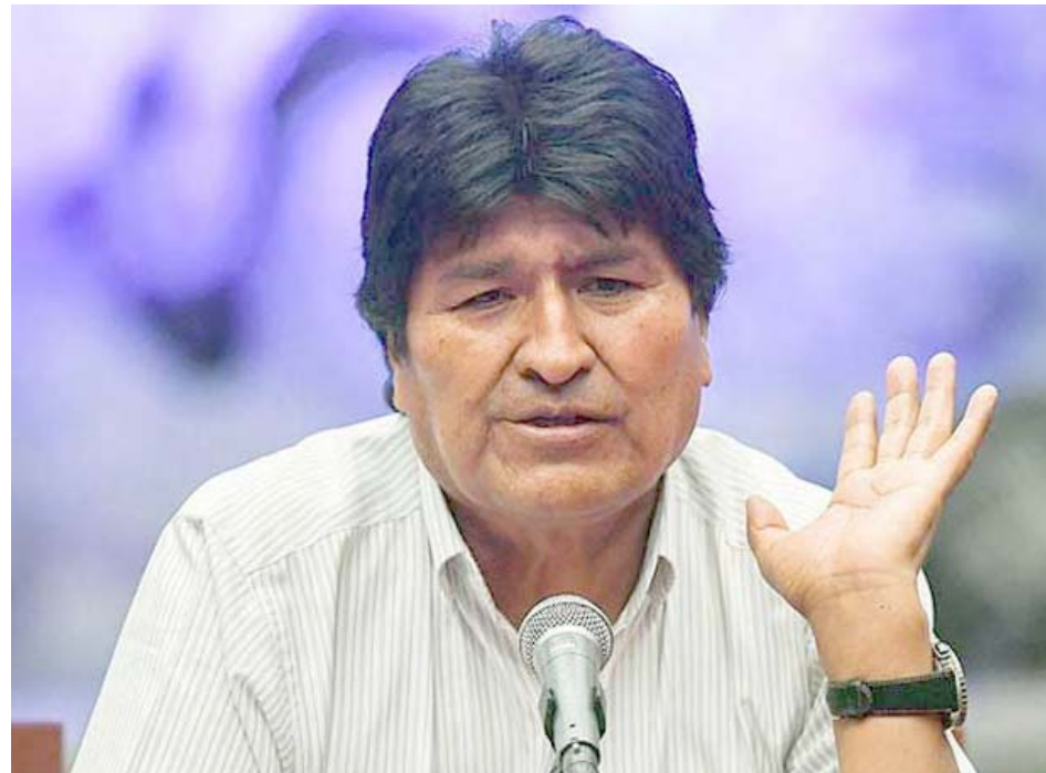
"El aplazamiento de las elecciones perjudicará al pueblo por la ingobernabilidad que se observa", dijo Evo

Ayer, el presidente del Tribunal Supremo Electoral, Salvador Romero de manera oficial anunció que las elecciones generales previstas para el 6 de septiembre se llevarán a cabo el 18 de octubre, y precisó que de ser necesaria la segunda