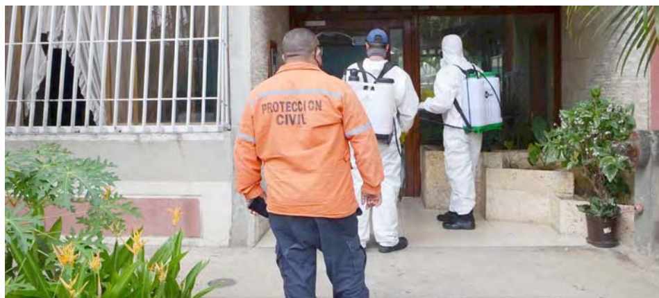
Todas las semanas se desarrollan jornadas de desinfección en el municipio, aseguró Gutiérrez