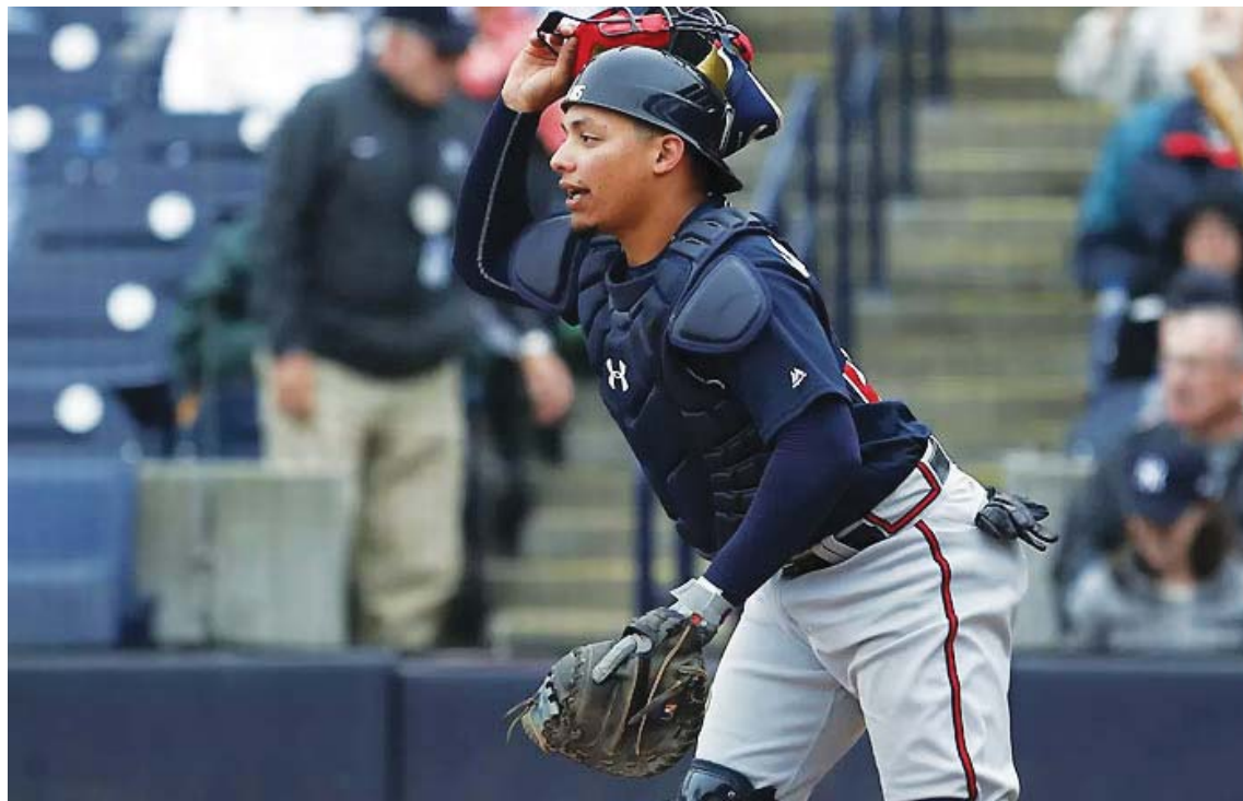
El hermano menor de los Contreras es considerado un prospecto

Por segundo año consecutivo, los metropolitanos inician la temporada con uno de sus principales talentos de ligas menores en el roster. El año pasado lo hicieron con el inicialista Pete