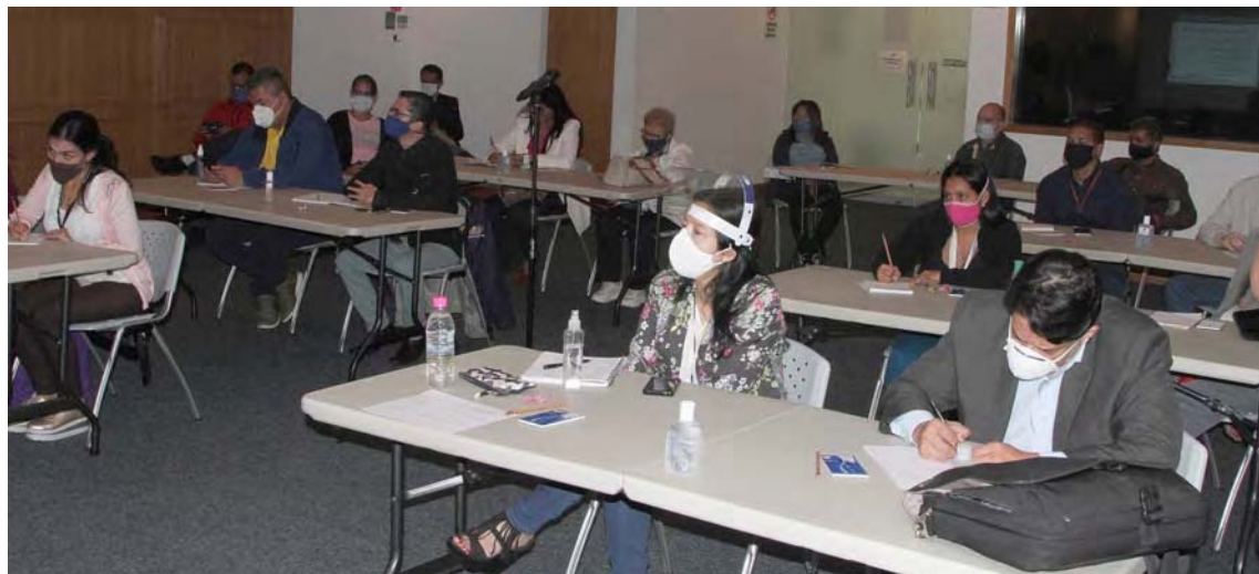
En la jornada se habló sobre cómo minimizar los factores de riesgo

En la actividad participaron representantes del Ministerio del Poder Popular para la Salud (Mpps), de la Dirección Nacional de Protección Civil y Administración de Desastres y de las