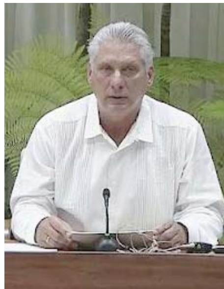
Los mandatarios abogaron por una América libre con naciones soberanas

El mandatario cubano, Miguel Díaz-Canel, rechazó las medidas unilaterales y coercitivas impuestas por el Gobierno de EEUU, y su par nicaragüense, Daniel Ortega, instó a la unión latinoamericana frente al intervencionismo