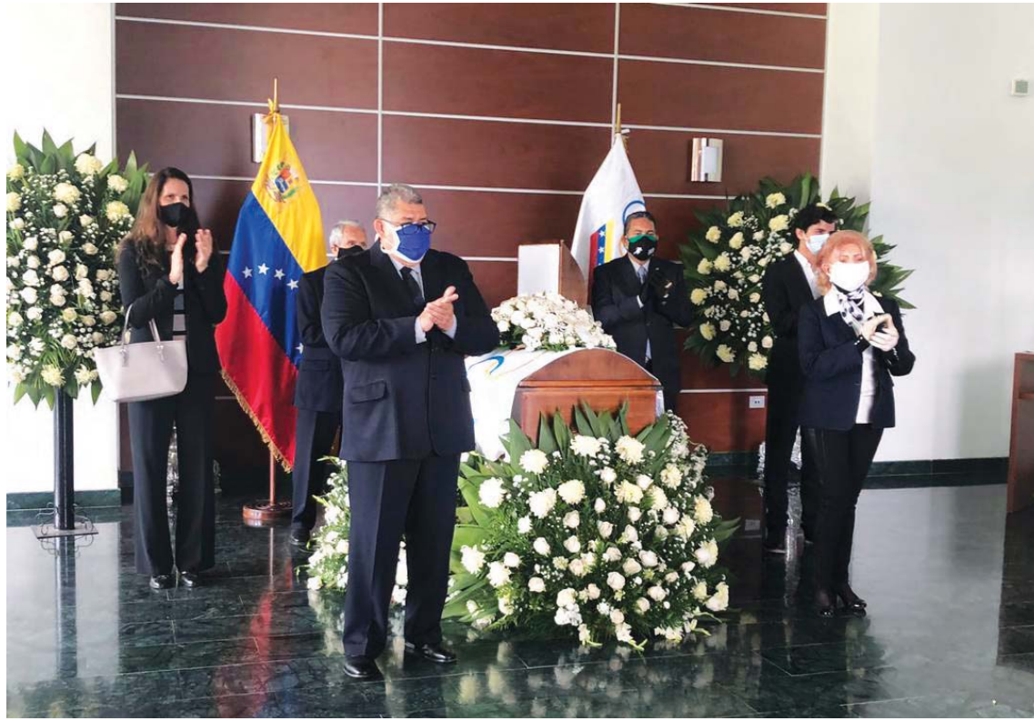
El Comité Olímpico Venezolano (COV) le rindió honores en su velorio

Fue campeona nacional en ecuestre y tenis, y ganó la medalla de plata en este último deporte en los Juegos Centroamericanos y del Caribe de Barranquilla, Colombia, en 1946. Logró clasificar para las