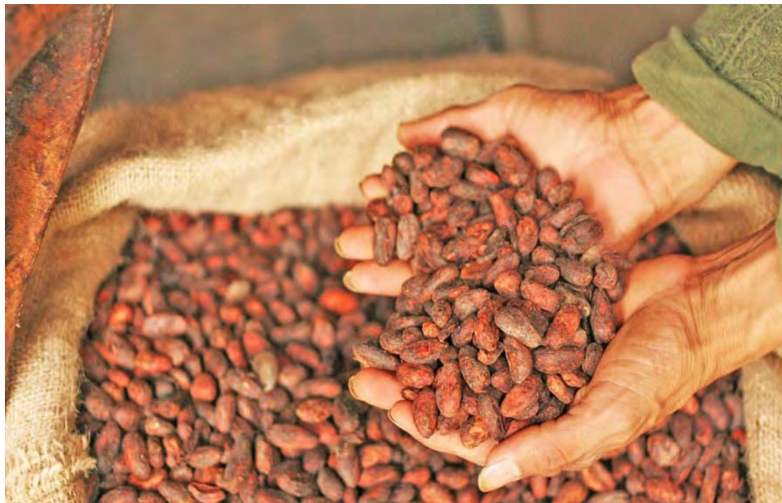
Para obtener mejores cosechas se deben crear condiciones óptimas

“La idea es que nuestro cacao siga siendo el mejor del mundo, libre de cadmio, un metal pesado perjudicial para la salud. Queremos incorporar la ciencia