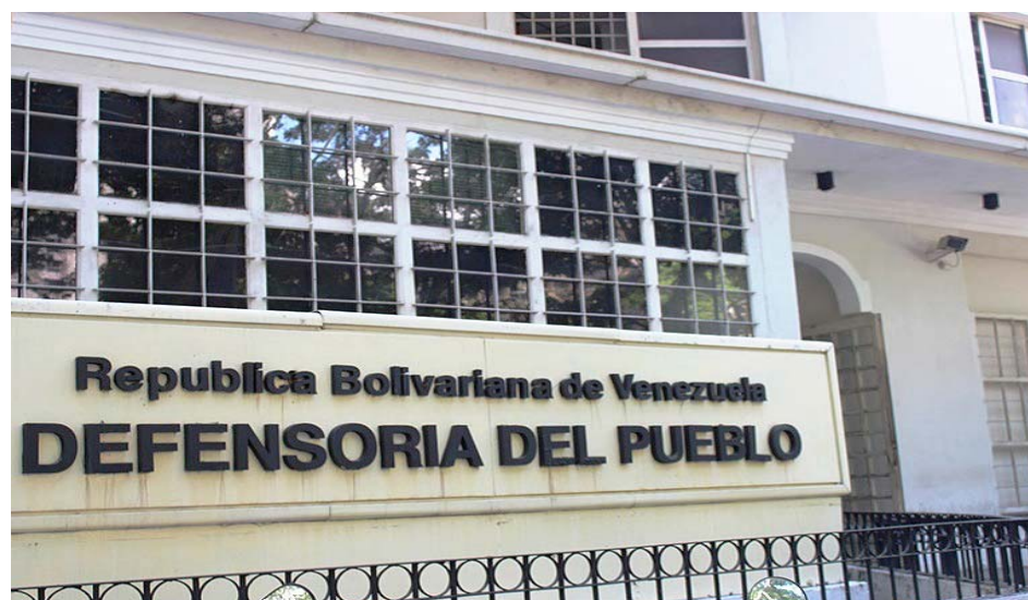
Las medidas deben aplicarse en todas las áreas de la vida de las personas con discapacidad

Destacó que esto incluye implementar medidas que faciliten todas las áreas de la vida de las personas con discapacidad, como el acceso al sistema de salud sin discriminación, al bienestar general y a la prevención de enfermedades infecciosas. También la protección contra actitudes negativas, el aislamiento y la estigmatización, que pueden surgir en medio de la crisis provocada por esta pandemia.