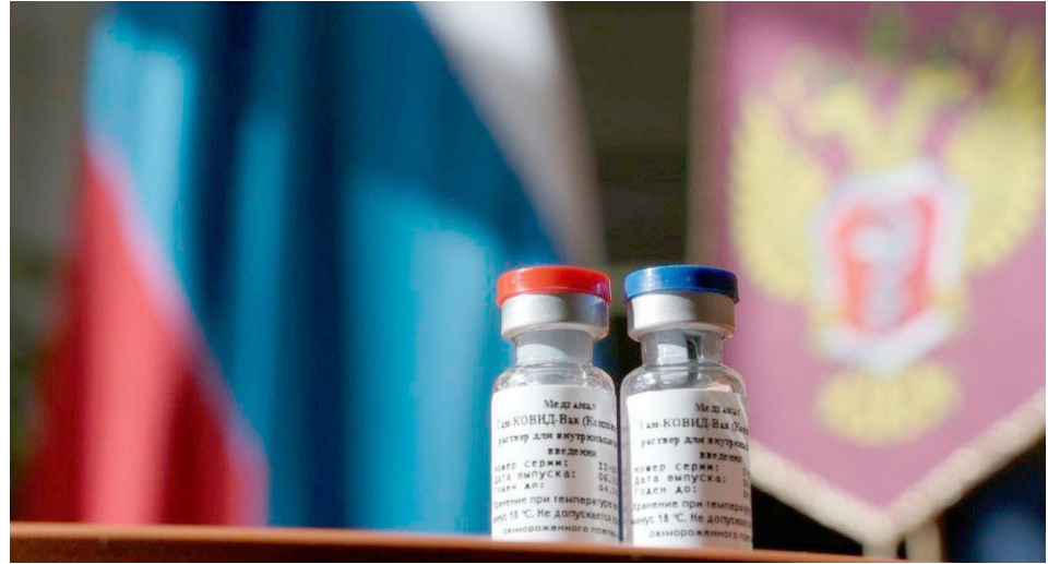
Con la vacuna Sputnik V Rusia ha logrado un gran avance en el ámbito científico