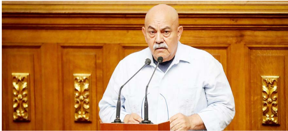
Vivas dedicó su vida a la patria y a la Revolución Bolivariana con absoluta lealtad, destaca el comunicado

El comunicado precisa que durante su gestión como par-