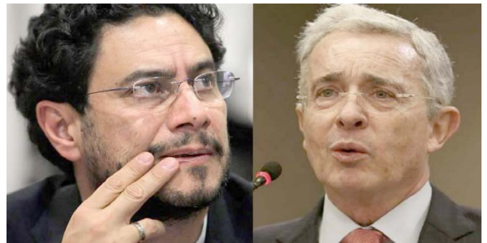
Iván Cepeda dijo que Álvaro Uribe no soporta haber perdido acciones en su contra

“Denunciaré a Uribe por injuria y calumnia”, aseguró Cepeda, quien dijo: “Uribe afirmó que he actuado en complicidad con magistrados de