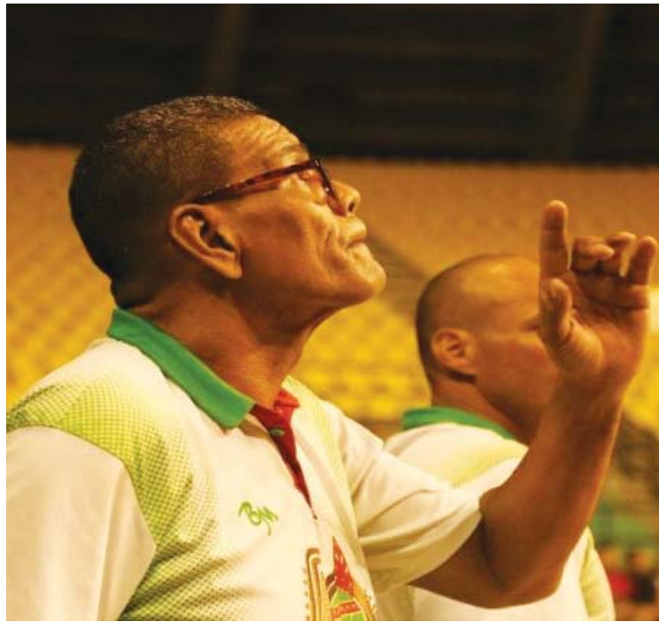
Sosa marcó una era en nuestro basquet rentado

“Yo entendí mi rol dentro del equipo. ‘Estamos plagados de estrellas. De gente que va a hacer los puntos y tenemos un sistema de juego establecido.