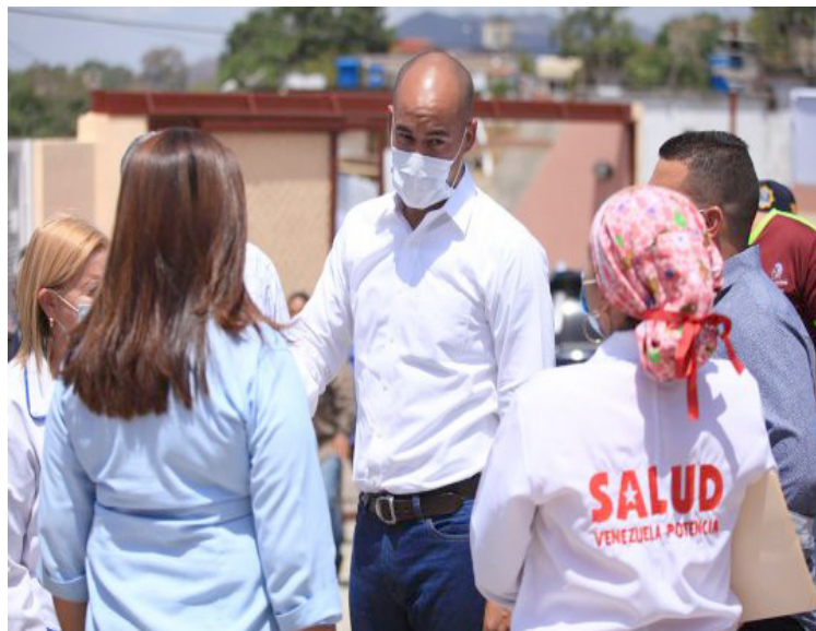
Rodríguez, “Tenemos suficientes pruebas para seguir con las jornadas de despistaje”

En nota de prensa, el gobernador de Miranda, Héctor Rodríguez, explicó que las acciones se concentrarán en garantizar el despistaje focalizado de acuerdo con los estudios de comportamiento del virus, no detener los despistajes aleatorios para evitar el surgimiento de nuevos focos y hacer seguimiento al cumplimiento de los criterios