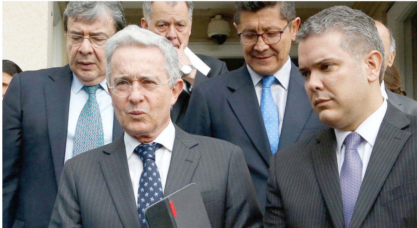
El uribismo echó por tierra el acuerdo de paz en Colombia

El goteo de asesinatos que persistió durante el Gobierno de Santos se incre-