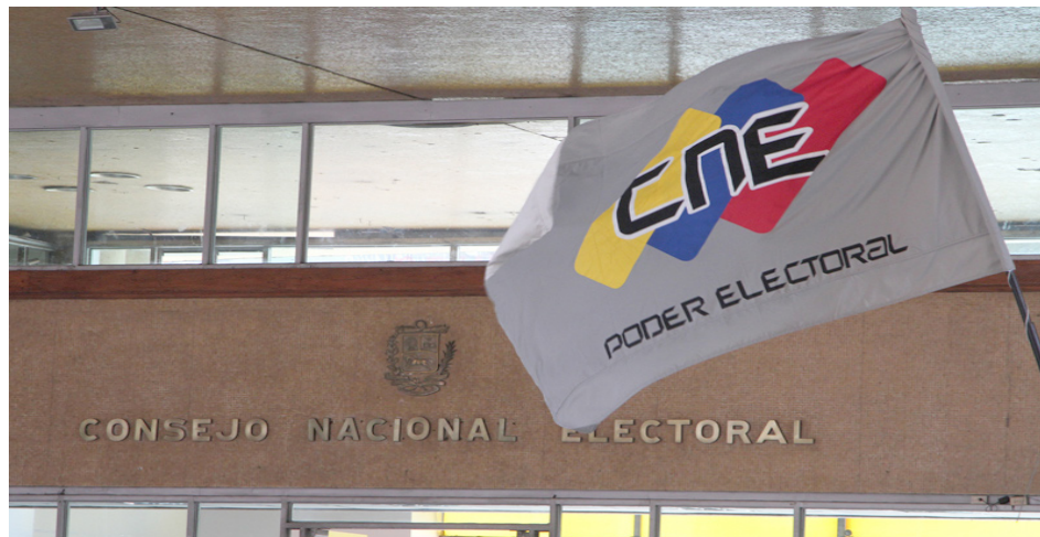
La prórroga no afectará el desarrollo del cronograma electoral

T/ Leida Medina Ferrer