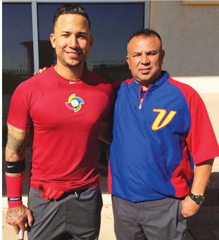
Penzo y “CarGo” mantienen una gran amistad desde hace más de una década

“Estoy siempre atento a cualquier requerimiento físico, de masajes para recuperación y relajación, así como cualquier cosa necesaria para su acondicionamiento”, subrayó el kinesiólogo y técnico en Fisio-