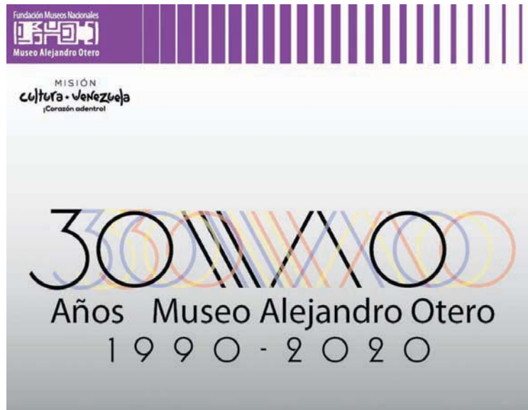
Bautizaron un blog y un catálogo

“Esa historia se va a contar a través de la colección con piezas que aún pertenecen al Instituto Nacional de Hipódromos y que son custodiadas por el MAO, también se va a hacer énfasis en