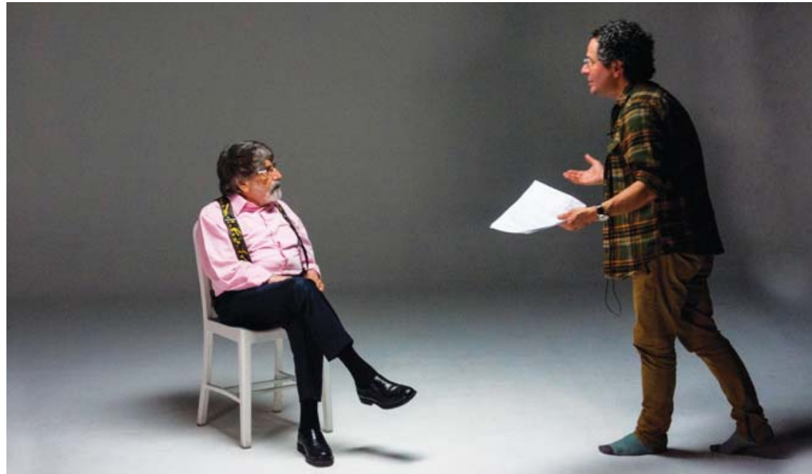
El filme se exhibirá fuera de competencia

Dice la nota que el documental, según su director, es un viaje visual a las entrañas del color, donde este se encuentre. Arvelo reveló que fue un reto cinematográfico registrar para la pantalla grande los desafíos estéticos y tecnológicos de los conceptos del maestro presto a iniciar “el más atrevido proyecto de su creativa vida en sus años crepusculares”.