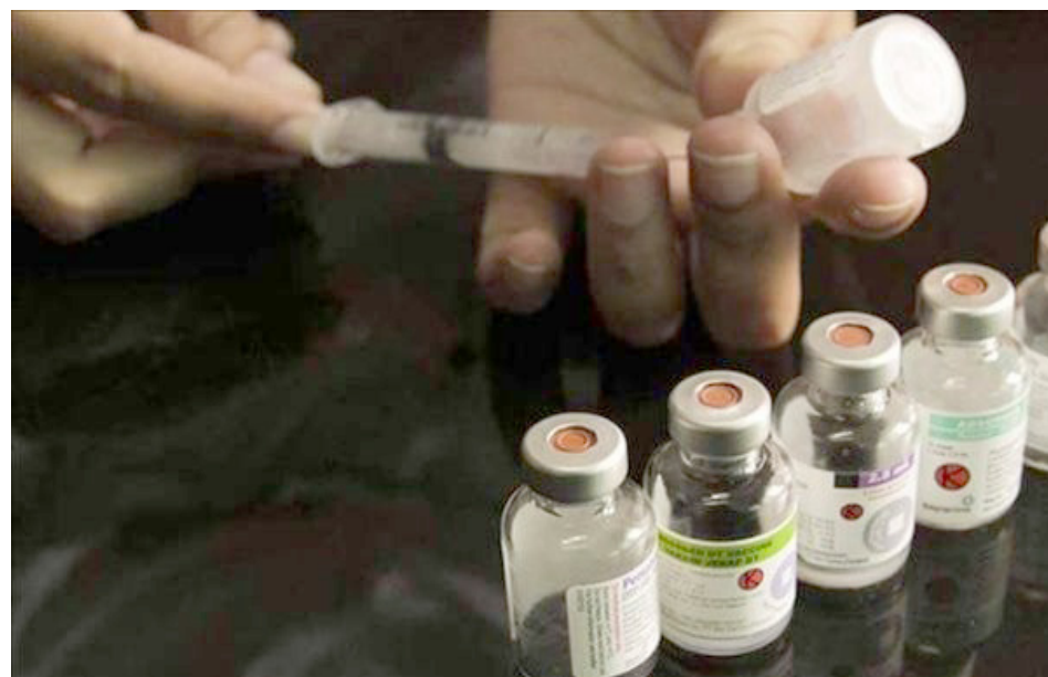
Los resultados del estudio clínico podrían estar listos el 1 de febrero del próximo año