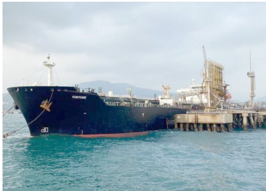
El Gobierno estadounidense continúa sus planes de sanciones contra Venezuela

Indica el medio que las sanciones podrían referirse a “los intercambios de crudo con empresas europeas y asiáticas”. Al respecto, señala que Washington ha debatido las medidas durante al menos cinco meses,