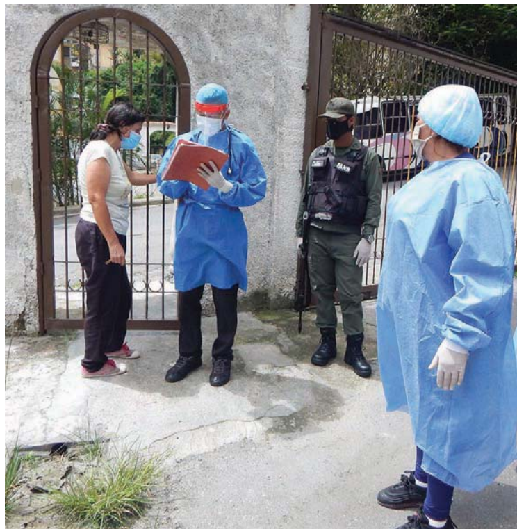
El abordaje casa por casa es preventivo

El funcionario público hizo un llamado a la población a que tomen las medidas pertinentes, a que respeten la cuarentena y denunciar cualquier llegada irregular de connacionales, así como posibles casos sospechosos, recordando que Guaicaipuro ocupa actualmente el segundo municipio con mayor cantidad de casos positivos en el estado Miranda.