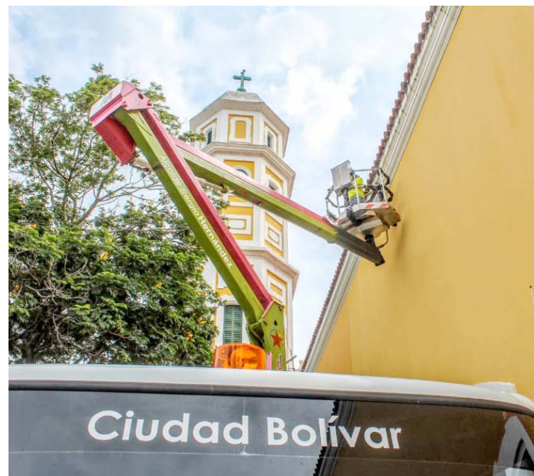
Se trabaja fuerte en Ciudad Bolívar