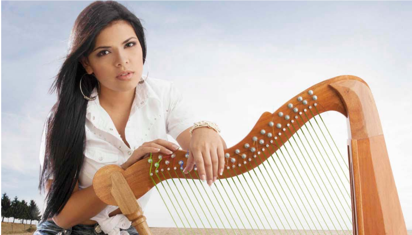
Yane también es comunicadora social y tiene su programa de televisión.

La también periodista viene de pegar “La horma de tu zapato”