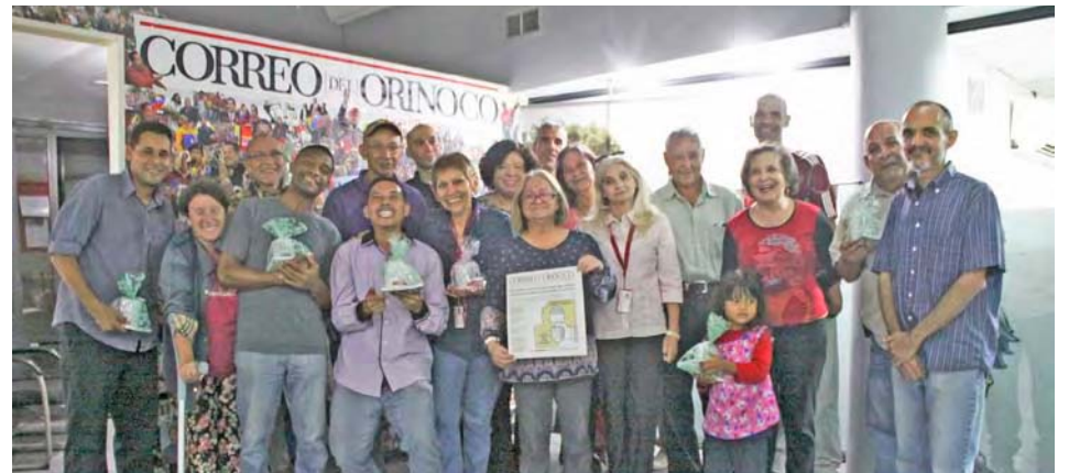
Muchos han sido los profesionales que han transitado por el Correo del Orinoco

“Creo que eso fue lo que motivó al presidente Chávez”, señala. “Lo hizo con mucha claridad política e ideológica y conceptual, escribiendo en el editorial que se publicó ese día 30 de agosto de 2009, de modo que se recogiera la verdad de la Revolución y que se enfrentara la canalla mediática, que ha sido el ingrediente más perturbador de la Revolución Bolivariana desde sus