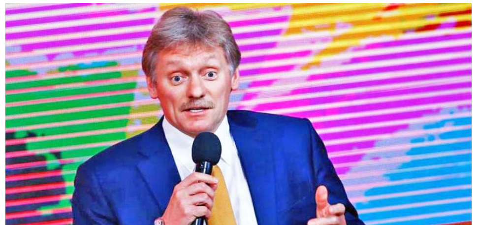
Como un “disparate total” calificó Dmitri Peskov las acusaciones de EEUU contra cinco empresas rusas

Bajo el argumento de que cinco empresas de investigación de Rusia “están vinculadas con el programa químico ruso y el terreno de pruebas de armas químicas y biológicas”, Estados Unidos incluyó el pasado miércoles en