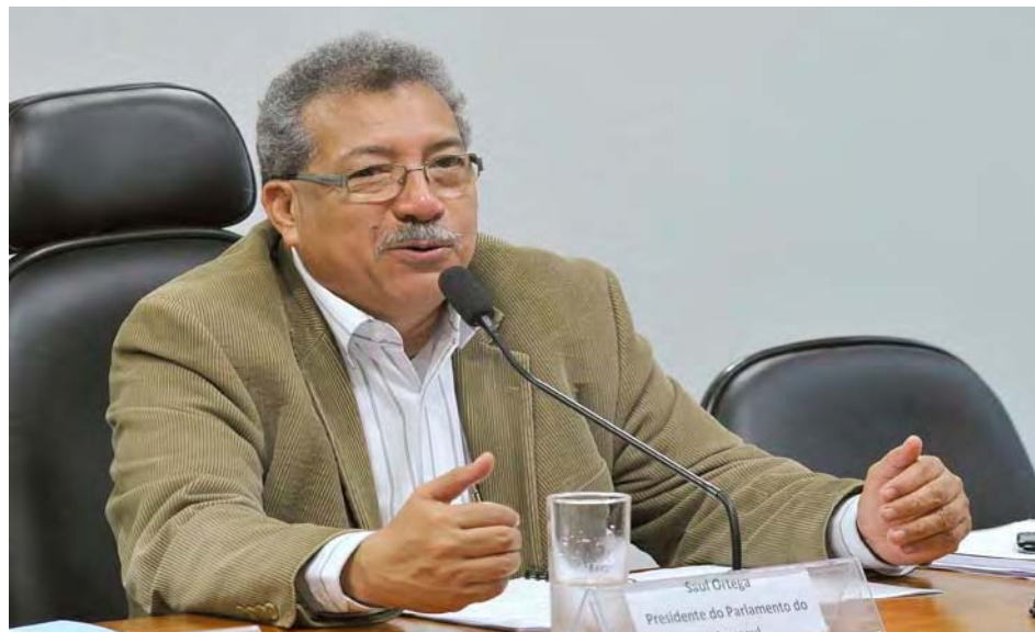
El cronograma electoral está ajustado en el mandato constitucional, sostuvo Ortega

Destacó que Venezuela en su constante lucha contra los asedios y ataques de países que quieren desestabilizar la paz de los venezolanos, demostrará una vez más en las próximas elecciones parlamentarias del 6 de diciembre su soberanía y sobre todo su libertad.