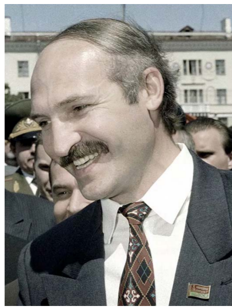
En 1994 se inició la conspiración de Washington

Han fracasado una y otra vez tratando de instaurar la llamada “revolución de colores”, mediante la cual se impuso en Ucrania un modelo de gobierno fascistoide. Lo han intentado también copiando