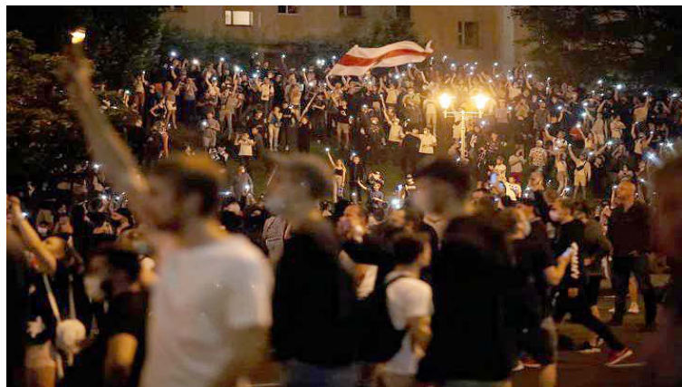
Manifestantes intentaron tomar sedes de organismos públicos

T/ Redacción Sputnik-EFE