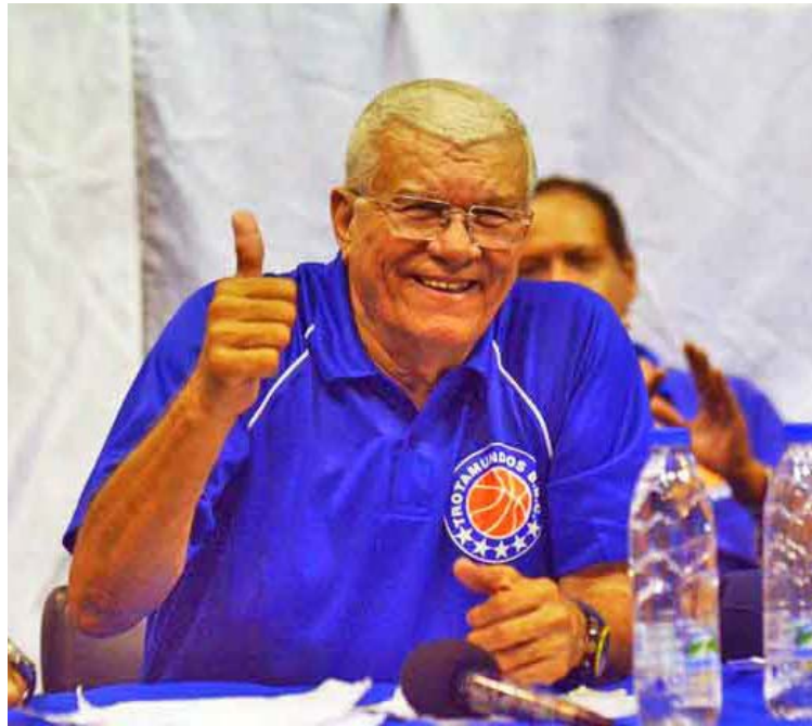
Como gerente también ha marcado historia en nuestro básquet rentado