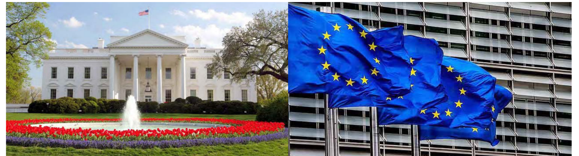
Las élites de poder de Washington y la Unión Europea pretenden socavar la democracia de Bielorrusia

“Es decir, Lukashenko estando a la cabeza de la vertical del poder, a la cabeza del Estado, debería entregarles el poder de modo voluntario teniendo 80% de votos, las órdenes llegan del extranjero», aseveró el Mandatario.