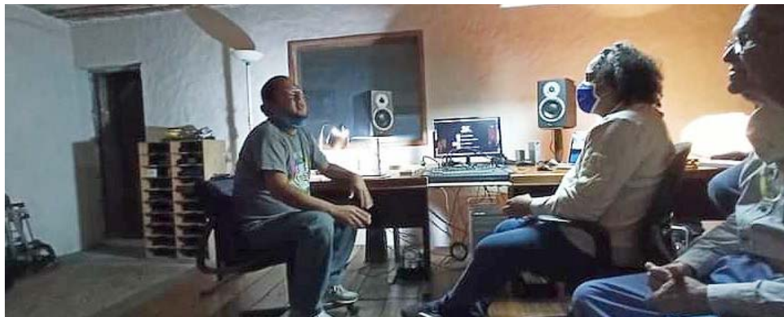
Los productos se distribuirán por medio del Sibci y medios alternativos

El Centro Nacional del Disco (Cendis) y la Autoridad Única de Cultura del estado Mérida tuvieron un encuentro para acordar políticas orientadas a reimpulsar el estudio de grabación que está en la localidad de Lomas de Los Ángeles, en consonancia con la necesidad