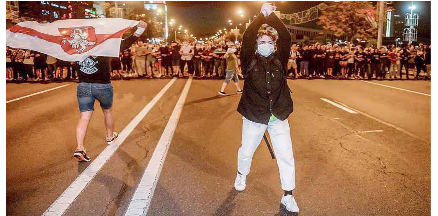
El imperialismo busca la insurrección del pueblo mediante la llamada “revolución de colores”

Washington y sus satélites creyeron que esta era la oportunidad de aplastar el modelo bielorruso. Veintiséis años