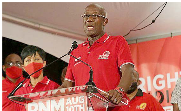
Reelecto primer ministro, Keith Rowley

La República Bolivariana de Venezuela reafirma su compromiso de continuar estrechando los vínculos de amistad y trabajo conjunto que comparte con Trinidad y Tobago, para garantizar el mantenimiento y la consolidación de América Latina y el Caribe como zona de paz.