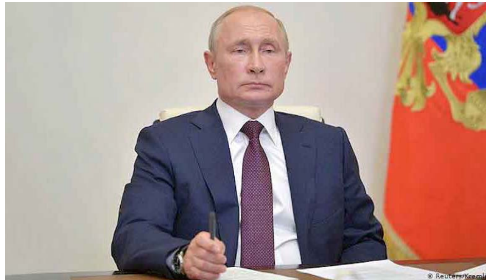
Vladimir Putin dijo que “la vacuna trabaja con efectividad y crea inmunidad de forma estable”

Putin informó que una de sus dos hijas fue una de las primeras personas en recibir la vacuna. “Después de la inoculación presenté fiebre alta durante dos días, luego desarrollé inmunidad, y las pruebas recientes encontraron un alto nivel de anticuerpos contra el virus”, aseveró.