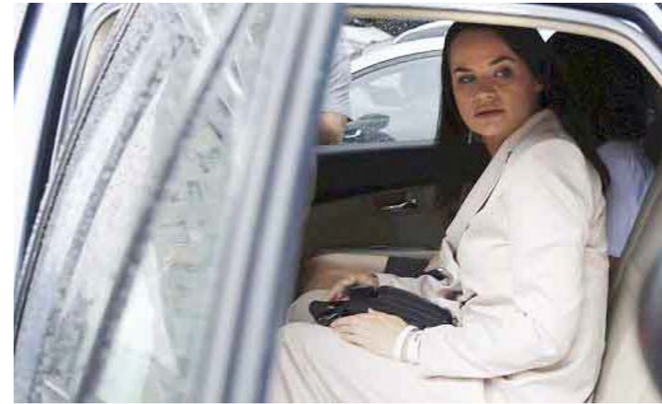
Tikhonouskaya, con solo 10 por ciento de los votos, se proclama ganadora y huye del país

en el Gobierno generan un lógico desgaste, además este proceso electoral coincidía con los efectos de la pandemia de Covid-19, tanto en lo sanitario como en lo económico. Por primera vez en varios años el país tendrá un año de contracción económica que posiblemente continuará en 2021.