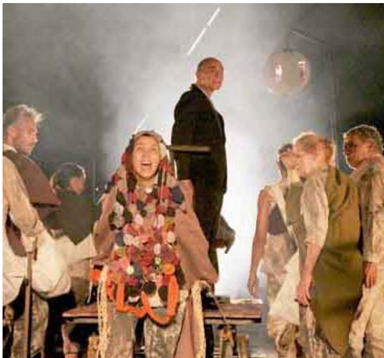
El evento gratuito está abierto para estudiantes, docentes y público general