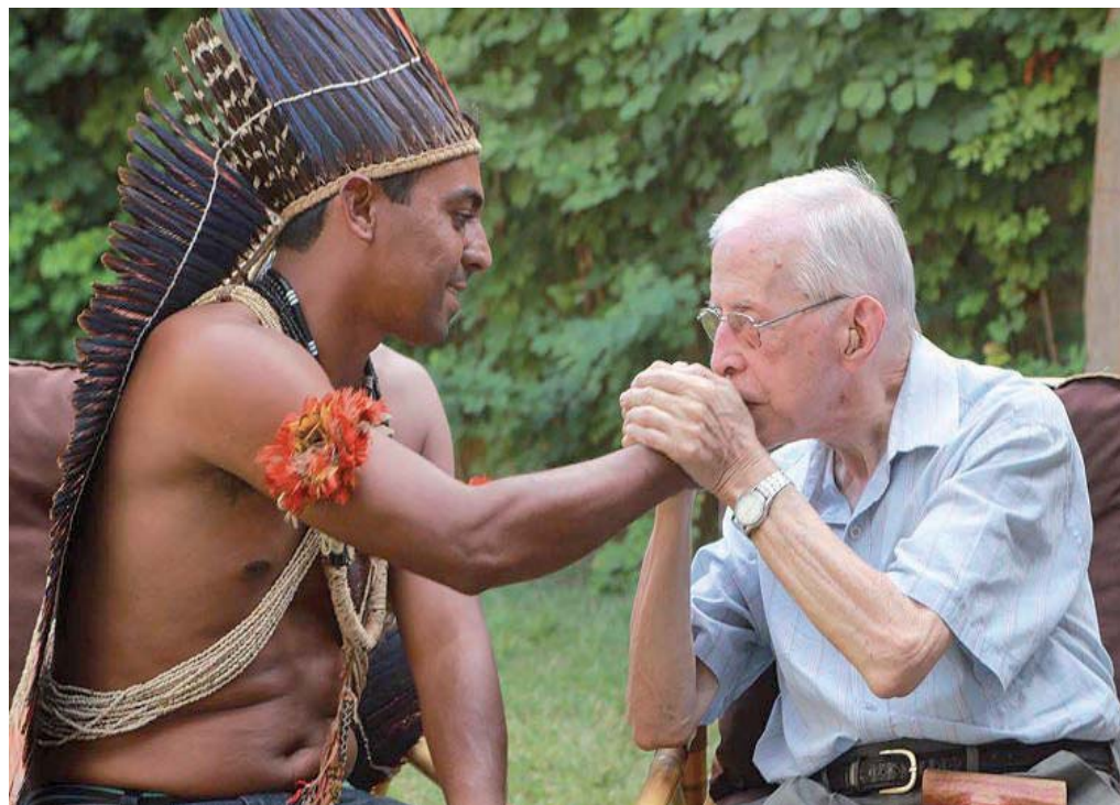
En su militancia con los pobres privilegió a los indígenas del Amazonas

¿Es la curia o es la calle/donde grana la misión?/Si dejáis que el Viento calle/¿qué oiréis en la oración?