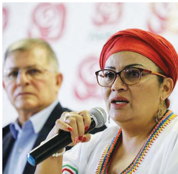
Victoria Sandino advierte que Álvaro Uribe podría salir libre de toda culpa

Por su parte, la Corte Suprema de Justicia notificó en Twitter que el caso carece de nexos con las actividades políticas del exsenador Uribe, por