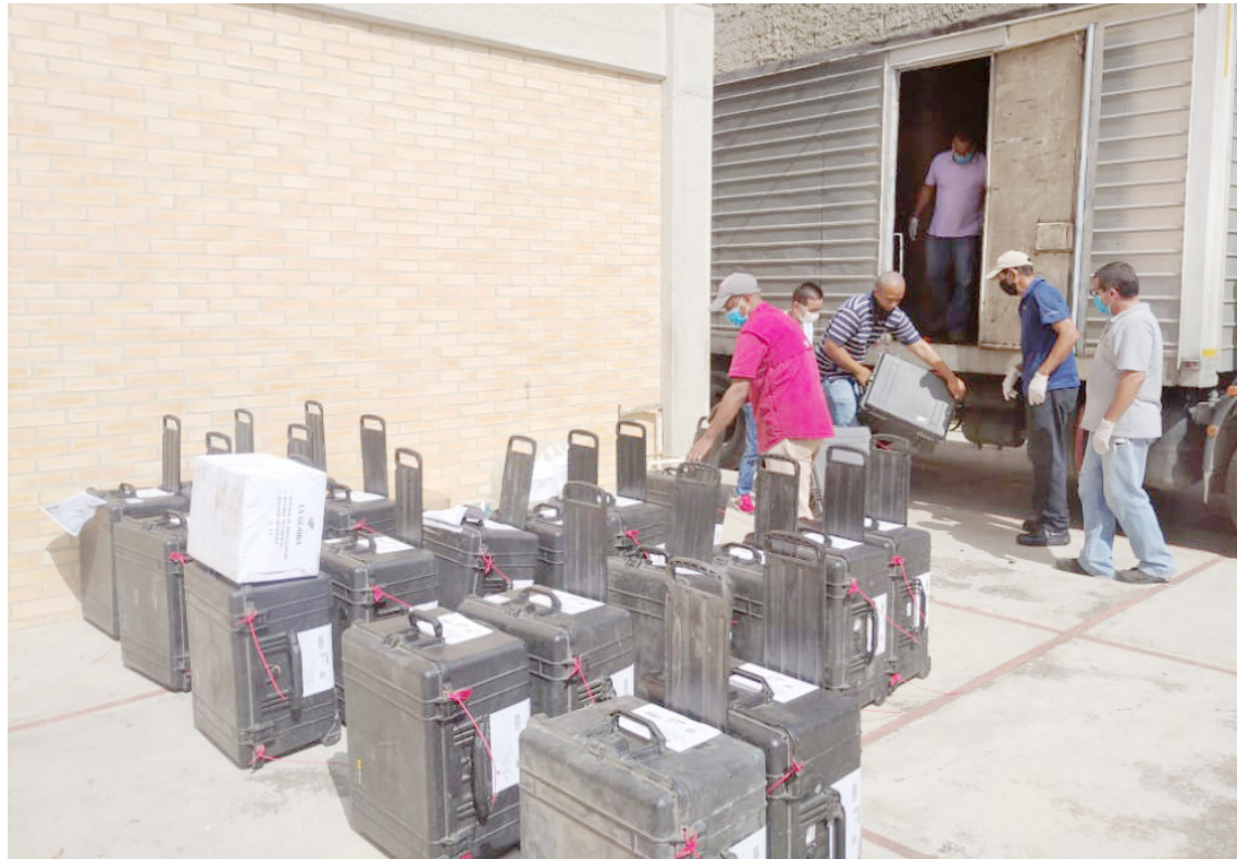
CNE y Ucsar impartirán pregrado y postgrado en Derecho Electoral

La información la suministró el ente electora, en un mensaje en Twitter: “@ve_cne avanza en la ejecución del Cronograma Electoral de los comicios del #6Dic, con el 1er despacho de equipos para optimizar las telecomunicaciones, trajes de protección e insumos para la desinfección,