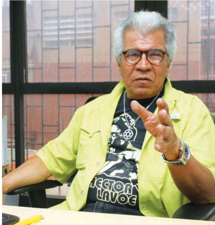
Su libro La biblia de la salsa quedó a la espera para publicarse