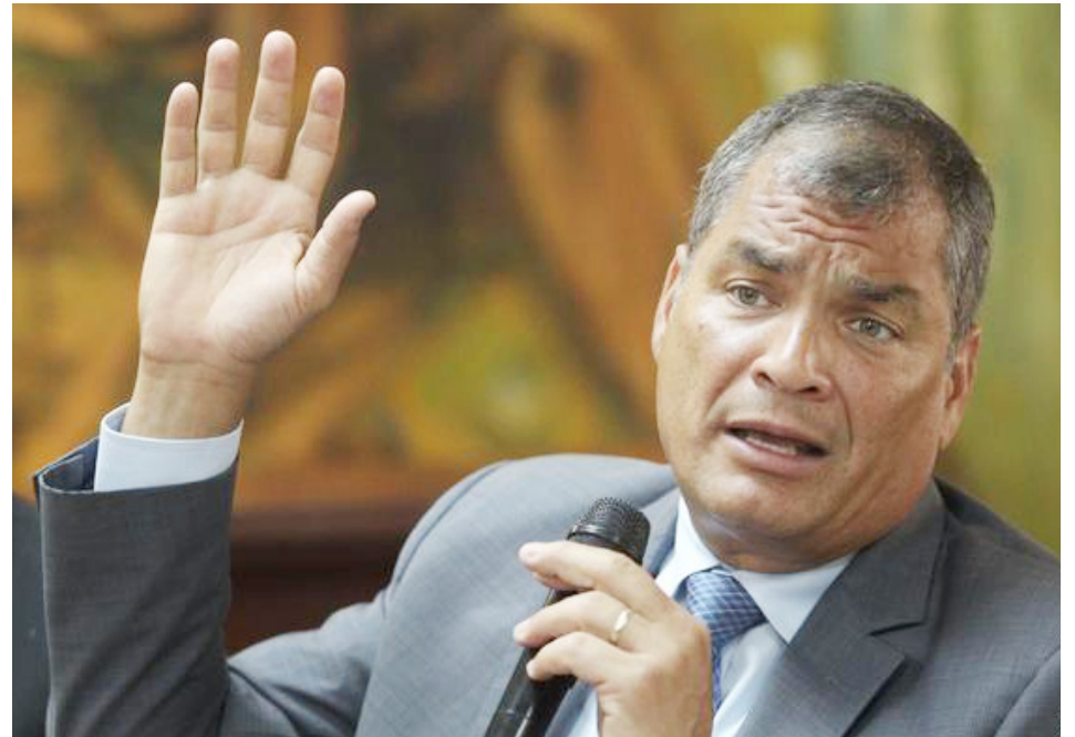
Rafael Correa denuncia que están violando su derecho a la participación política

Explicó el expresidente que debido a un reciente cambio realizado por el CNE en el Reglamento para la Democracia Interna de las Organizaciones Políticas, tras ser electos en las primarias partidarias, el siguiente paso era aceptar esas candi-