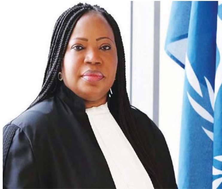
Desde que se inició la investigación en 2017, Trump ha boicoteado y atacado a la CPI

La CPI a finales de 2017, basada en pruebas razonables y en los resultados del informe preliminar de fiscales, inició una investigación contra soldados estadounidenses por