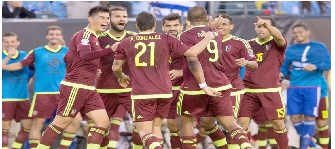
El balompié nacional está contra la pared en este momento.

Los miembros de este comité serán conocidos en las próximas semanas