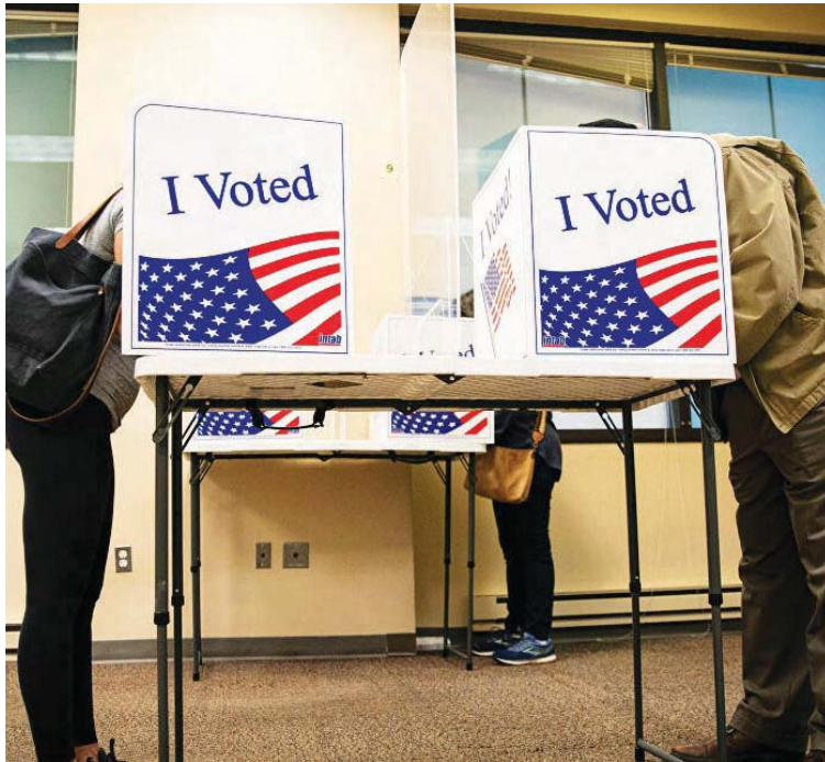
En Minnesota, Wyoming, Virginia y Dakota del Sur ya instalaron las mesas

Aunque este país tiene 50 estados, solo 13 decidirán realmente quién será el próximo presidente, y según las encuestas, en cuatro de estos lugares claves Donald Trump y Joe Biden están prácticamente empatados